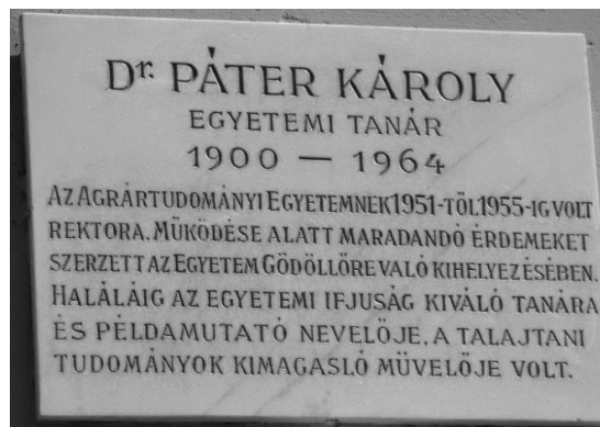
Pátzay Pál: Páter Károly emléktábla