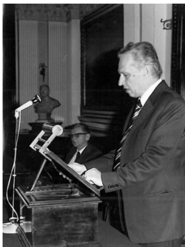
Stefanovits Pál az MTA rendes tagjaként tartja székfoglalóját, 1977.