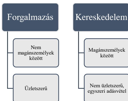
2. számú ábra.

A forgalmazás és a kereskedelem jellemzői ennek megfelelően az alábbiak szerint foglalható össze: