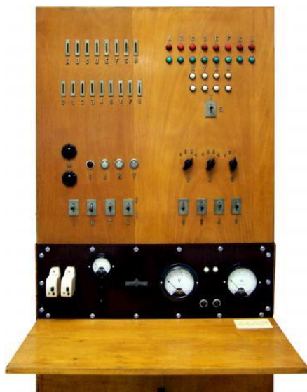
2. ábra: A Kalmár-féle logikai gép