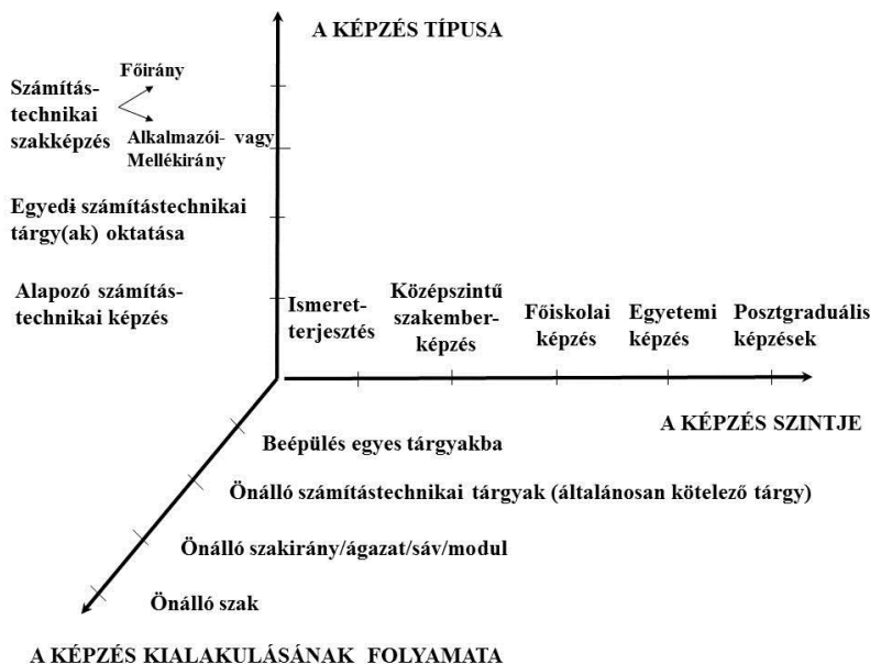
5. ábra: A számítástechnika képzési tere

Az 5. ábra a hazai számítástechnikai képzés kialakult formáit mutatja – a képzés típusa, szintje és kialakulásának folyamata által kifeszített képzési térben. (A képzési tér ötletadója és egyik kidolgozója Sima Dezső , az Óbudai Egyetem professzora.)