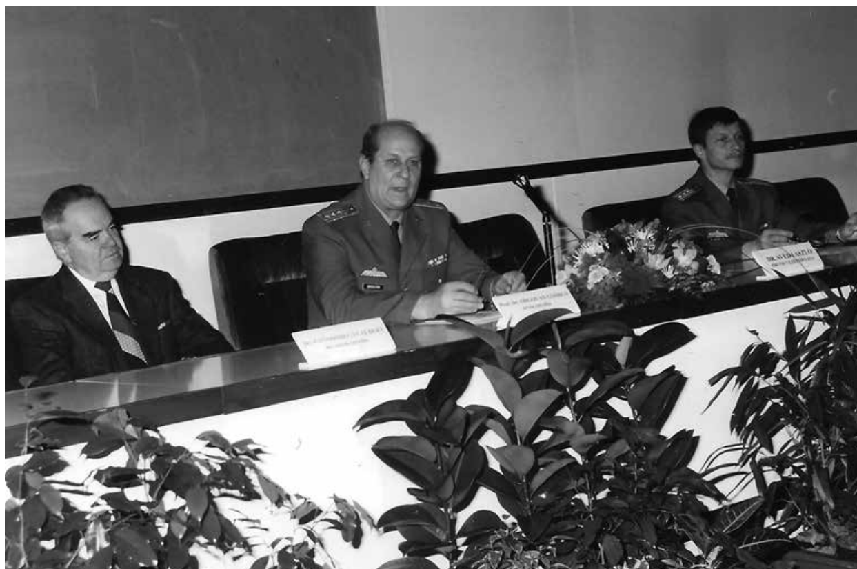
7. ábra. MKKOT-konferencia az 1990-es évek végén.

Mindezen feladatteljesítés és kihívások mellett szinte észrevétlenül röppent el az újabb négy esztendő, így 1999-ben az éves közgyűlés keretében újra tisztújításra került sor. A 2003-ig hivatalt viselő elnökség a következő lett, amely tagjai nagy részének, a tisztségviselők személyének azonosságán keresztül a szervezet irányításában jelentős folyamatosságot képvisel: