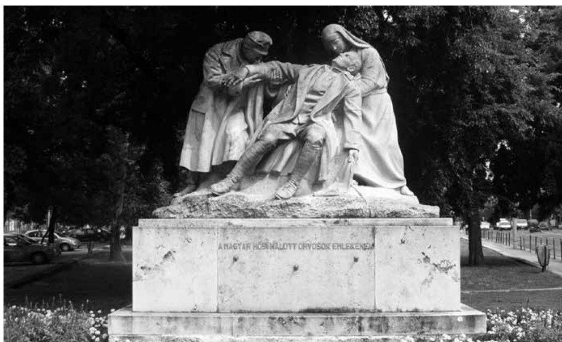
2. ábra. A hősi halott magyar orvosok emlékműve ma

Az 1991. december 19-ei nyilvántartás szerint a tagság 98 főt számlált az összesen hat regionális tagozatban: a budapesti tagozat (MH Egészségügyi Szolgálatfőnökség, MH Egészségügyi Intézetek Főigazgatósága (MH EIF), MH KHK, MH Közegészségügyi Járványügyi Állomás (MH KÖJÁL), MH Budapesti Katonai Kerületparancsnokság) mellett 5 vidéki, a veszprémi, a kecskeméti, a pécsi, a győri és székesfehérvári szervezetek működtek.