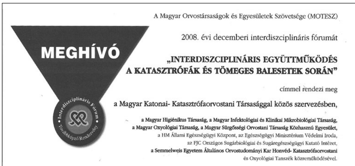
11. ábra. Az Interdiszciplináris Fórum meghívója, 2008