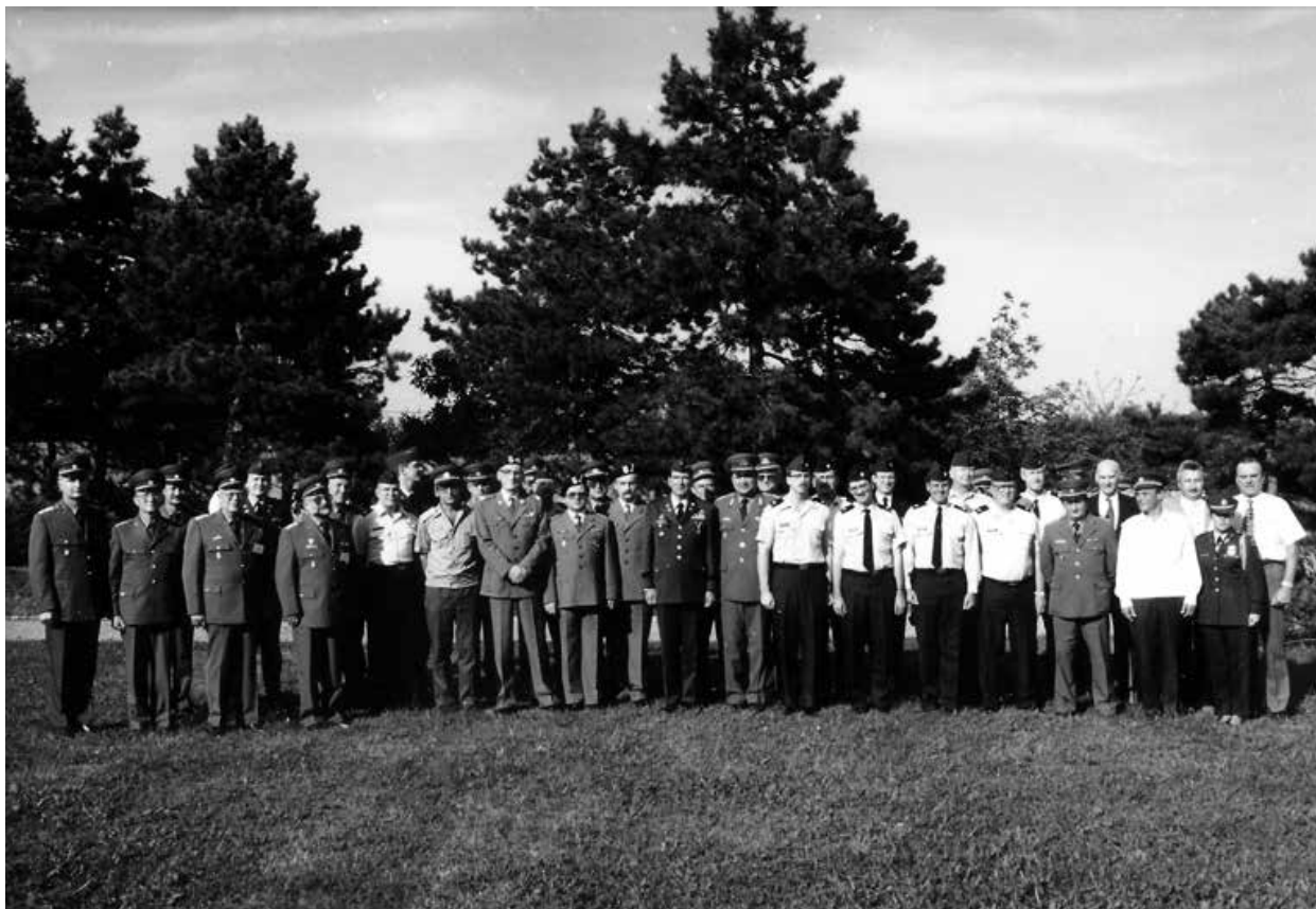
5. ábra. A III. Amerikai–Magyar Katonaorvosi Kongresszus résztvevőinek látogatása a budaörsi katonai temetőben

A következő évben, 1994. október 27-én került megrendezésre „A menekültek egészségügyi ellátásának kérdései” témában tartott III. Tudományos Konferencia, ahol a hazai előadók mellett külföldi vendégelőadók úgyszintén szerepeltek. Ebben az évben a genfi székhelyű Katasztrófaorvostani Világszövetség tagjai sorába is felvételt nyert a Társaság, amely az 1996. őszén tartandó nemzetközi konferenciát Budapestre invitálta. A felvétel elfogadása a nagy szakmai elismerés mellett kihívást is jelentett a Társaság vezetésének, hiszen a szervezés ideje alatt kellett a A III. Amerikai–Magyar Katonaorvosi Kongresszust is lebonyolítani Budapesten.