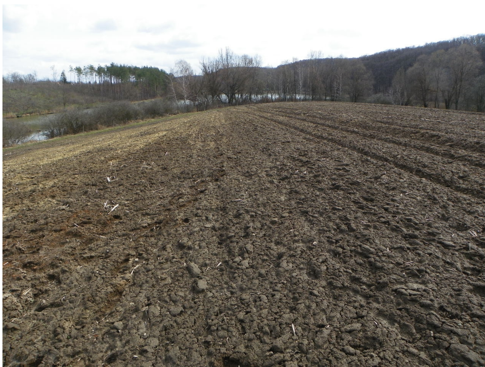
1. ábra: középkori eredetű mélyút a Barátok tava gátján vezető út folytatásában