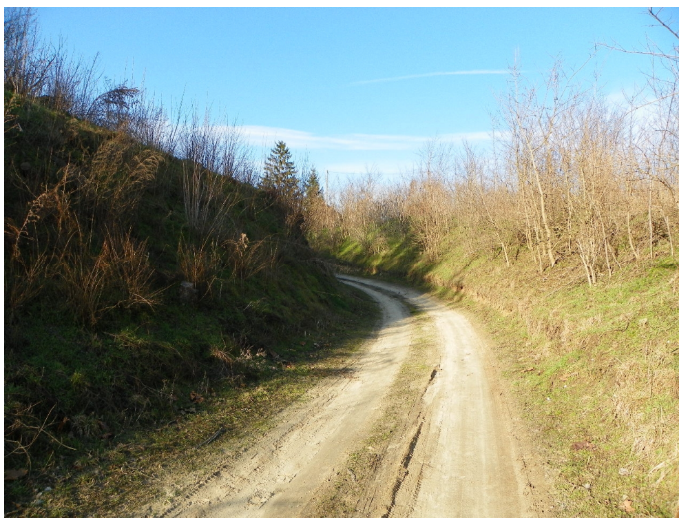
2. ábra: Temerkény falu helye a Barátok tava két ága által közrefogott földnyelven