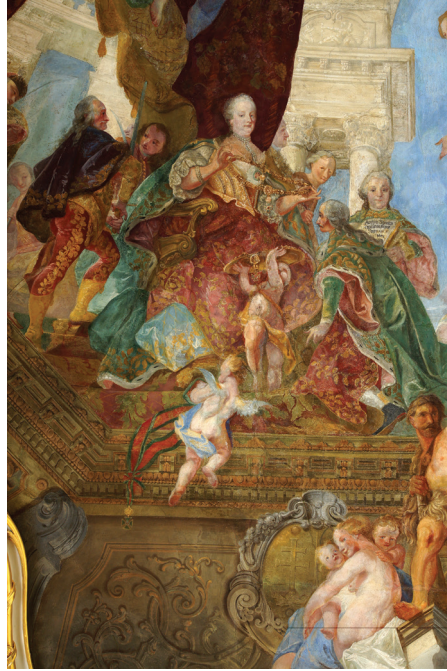
4. Franz Anton Maulbertsch: A Szent István-rend megalapítása-mennyezetkép a tanácsteremben, 1768

lakközökben kétoldalt Lotaringiai Ferenc és Mária Terézia egészalakos portréja kapott helyet, aranyozott, faragott díszkeretben, rajtuk egy-egy (egyfejtű) sas alakjával. A középső pilléren – szintén aranyozott, ám sas nélküli keretben – elhelyezett harmadik kép az 1741. évi pozsonyi országgyűlés egy jelenetét ábrázolta: 1741. szeptember 21-én a pozsonyi vár audienciatermében Mária Terézia bemutatja a trónörökös József főherceget a magyar rendeknek. Ez utóbbi képet a 19. század folyamán áthelyezték egy másik terembe, ahol ma is található. 32 A festmény méretét (245 × 130 cm) ugyanakkor eredeti elhelyezése határozta meg, a kép ugyanis pontosan illeszkedik a tanácsterem középső falpillére boiserie burkolatának faltükrébe. 33