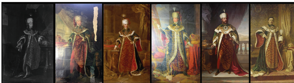
6/c A Magyar Udvari Kancellária nagymesteri portrégalériája. A szerző rekonstrukciója