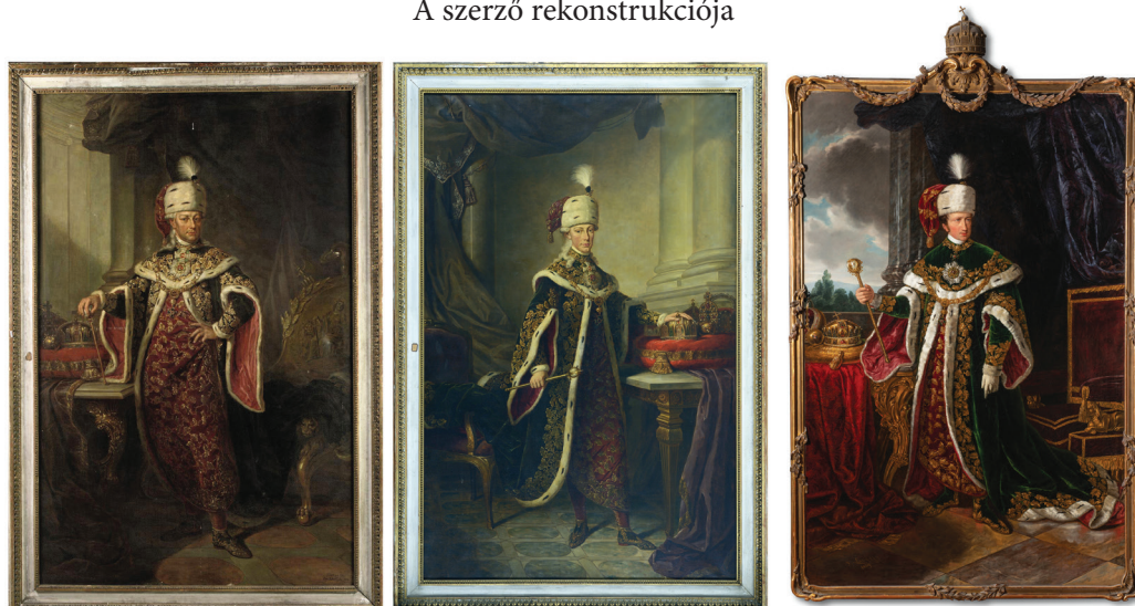
7/b. Az Erdélyi Udvari Kancellária nagymesteri portrégalériája. A szerző rekonstrukciója

Az uralkodói portrégaléria mellett a kancellárok arcképei is helyet kaptak a Kancellária palotájában. 1875-ben ezek a díszterem előterének falain függtek. 82 Az együttes 1899-ben a király személye körüli miniszterek (Festetics György, Wenckheim Béla, Tisza