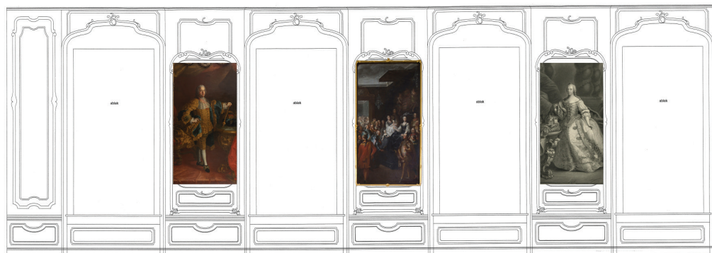
6/b. A Magyar Udvari Kancellária egykori tanácstermének északi fala. A szerző rekonstrukciója