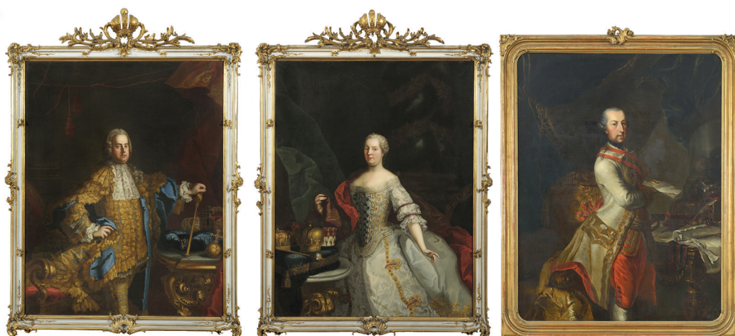
7/a. Az Erdélyi Udvari Kancellária uralkodói portrégalériája. A szerző rekonstrukciója