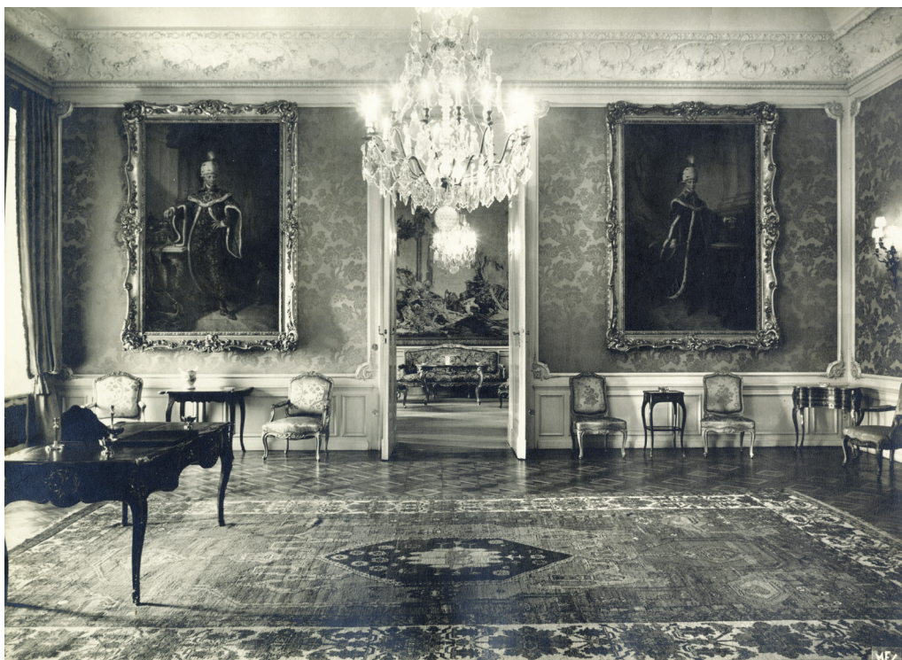
8. A Sándor-palota Vörös szalonja, 1940 körül

II. Lipót, jobbra pedig az ifjú I. Ferenc képmása kapott helyet a falon neobarokk keretben (8. kép). 87