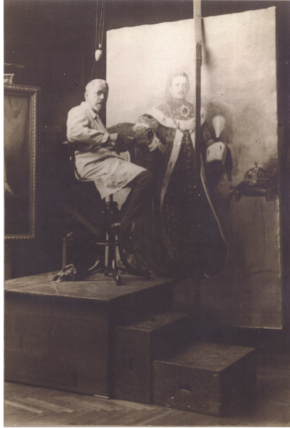
5. Éder Gyula IV. Károly portréjának festése közben, 1928

riumokat felügyelő, 60 fős magyar delegáció üléstermeként szolgált. 62 Jókai Mór egy írása szerint miután 1884-ben a díszteremből a budai Sándor-palotába szállították a beauvais-i falikárpitokat, az immár öt képből álló nagymesteri portrégalériát a díszteremben, feltehetően a hozzávetőleg 165 cm széles ablakközökben helyezték el. 63 Ebben minden bizonnyal szerepet játszott, hogy az öt portré csak zsúfoltan fért el a tanácsterem falain, 64 mivel 1868-ban a helyiségből ajtót nyitottak a szomszédos díszterembe, s így a hosszanti falon egyel kevesebb festmény elhelyezésére volt lehetőség. 65