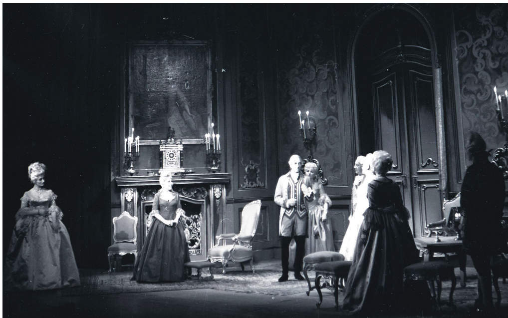
1. Jelenet a Nemzeti Színház II. József című előadásából (1964. január 31.), a háttérben Mária Terézia portréjával

A nagymesteri portrészorozatból elsőként I. Ferenc József portréja került restaurálásra, majd bemutatásra a Budapesti Történelmi Múzeum 2000-ben rendezett palotatörténelmi kiállításán. 11 Az 1864-ben Heinrich Ede által festett kép kancelláriai provenienciáját azonban az akkori kutatások még nem tárták fel, a festményt a budai királyi palota számára készült uralkodóportréként mutatták be. 12