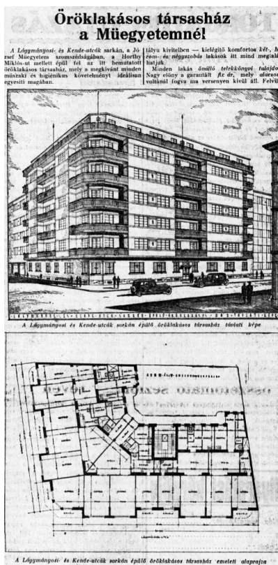
5. kép. Meg nem valósult társasház reklámja távlati képpel és alaprajzzal a Lágymányosi utca és a Kende utca sarkán. Magyarság , 1932. április 17. 26. 60

is megjelentetett, amelyek öröklakásos házait a társasház-propagandába ágyazottan reklámozták.