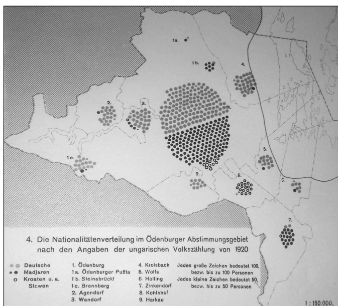
1. ábra. Nemzetiségi megoszlás a soproni népszavazási területen az 1920. évi magyarországi népszámlálás alapján

Az atlaszban Sopron történelme, valamint a népszavazás is kiemelt szerepet kapott. Ez utóbbi eseményről szakmai tekintélyként a korábban már említett Viktor Miltschinsky nyilvánult meg, a térképek és a kommentárok az ő munkája alapján készültek. A térképeket általában a szerzők vázlatai alapján Fritz Bodo öntötte végleges formába.