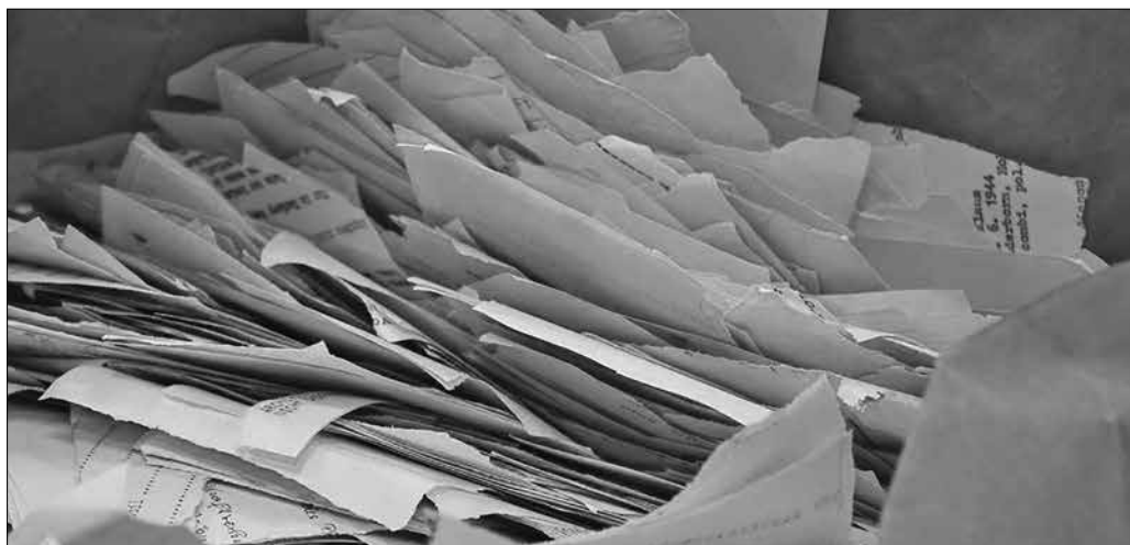
5. kép. Széttépett iratok a BStU levéltárában 21