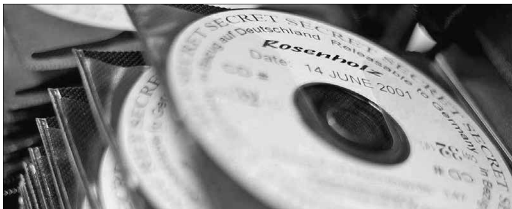
4. kép. A „Rosenholz-akták” 19

A „Rosenholz-akták” néven elhíresült irategyüttes története nemzetközileg is nagy visszhangot keltett és a német állambiztonsági iratok története szempontjából