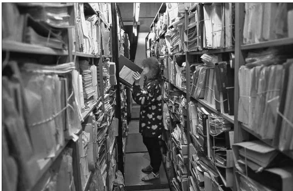
3. kép. A BStU iratraktárában... 17

A Stasi-levéltár működését legszemléletesebben a tevékenységéről közzétett statisztikai adatokkal tudjuk illusztrálni. 15 A Stasi mintegy 111 iratfolyókm-nyi anyagot termelt, pontosabban ennyi maradt az utókorra. (Összehasonlításképpen: Magyarországon az 1990 előtti titkosszolgálatok fennmaradt iratanyaga valamivel több mint 4 iratfolyókm.) Ebből a hatalmas tömegből kb. 12 km-t tesznek ki a karton-rendszerű nyilvántartások (kb. 41 millió darab karton), melyből 18 milliót a berlini központ, a többit a tartományi részlegek őriznek. A papíralapú iratok mellett 1,95 millió fényképet, 2 876 filmet és videót, 22 700 hangdokumentumot és 106 digitális adattárolót kezelnek még. Bár ez az iratanyag sem tekinthető teljesnek és hiánytalannak – példaként érdemes megemlíteni a Rosenholz-ügyet vagy az összetépett iratok hatalmas tömegét (lásd alább!) –, a magyarországihoz hasonló alkalmi és módszeres iratsejtezések vagy forradalmi helyzetek 16 kevésbé tizedelték meg a Stasi-archívumot. Érdemes megemlíteni ugyanakkor azt a kevésbé ismert tény, hogy 1990-ben a külföldi hírszerzés vagy a keletnémet néphadsereg katonai hírszerzésének iratanyagát az érintett szervek gyakorlatilag teljes egészében megsemmisítették.