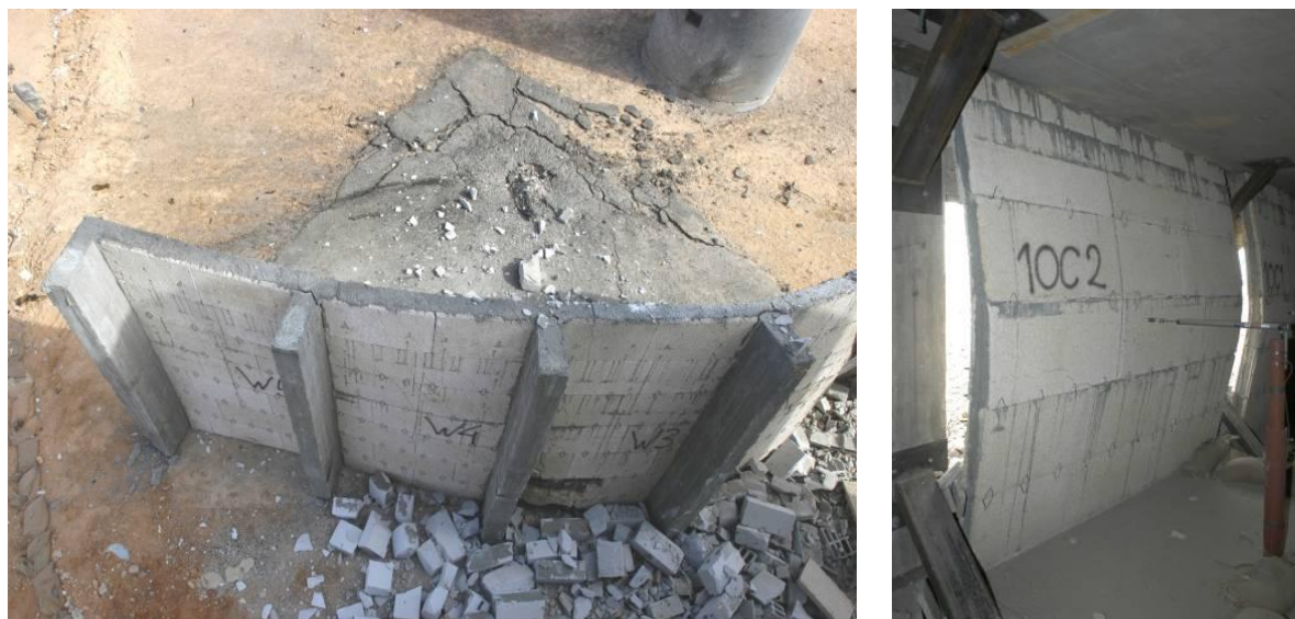
5. ábra. Merevítő bordákkal megerősített, valamint blokkos falszerkezetek 12

A falszerkezet mellett különösen fontos a tartó (váz-) szerkezet megerősítése. Az általánosan használt vasbeton tartóoszlopok ellenálló képessége növelhető például a szénszálalás műanyagok használatával, amely a merev szerkezetet a fellépő erőhatásokkal szemben sokkal rugalmasabbá teszi. A katonai rendeltetésű ideiglenes épületek védelmére szolgálhatnak a rugalmas, a lökéshullámnak és a keletkező nyomásnak ellenálló, az erőhatásokat csillapító, blokkokból készített falszerkezetek.