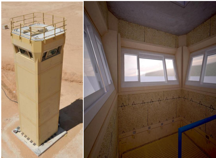
9. ábra. Blokkos elemekből épített őrtorony 17

Az építéstechnikai megoldásokon túl az eljárások rendjét is felülvizsgálták. A biztonsági távolság megtartása érdekében egy szélesebb biztonsági zónát kellett létrehozni a létesítmény körül; folyamatosan figyelés mellett használni kell különböző utakadályokat, jármű lassítókat; az átvizsgálás során szét kell választani a személyeket a járművüktől, amelynek ellenőrzése két fázisban történjen – előbb távolról, majd közelről – úgy, hogy ez a művelet sor a lehető legrövidebb időt vegye igénybe.