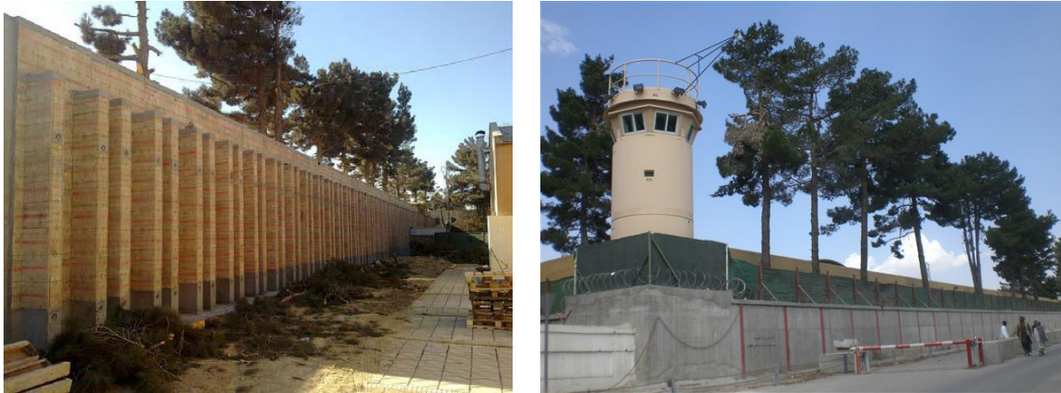
8. ábra. ISAF HQ blokkos, bordákkal megerősített kerítés szerkezete és őrtornya 16

Az ISAF Parancsnokság védelmét a robbantást követően újjászervezték, új külső védelmi rendszer került kialakításra, amelynek épített elemei többek között a már említett, a keletkező erőhatásokat csillapító blokkokból kialakított külső kerítés, őrtornyok. A gyakran alkalmazott drótkerítés sem a bejutást nem nehezíti meg, sem pedig a robbanás hatásai elleni nem nyújt védelmet, az elemekből épített – akár 7 méter magas! – kerítés azonban a fentiekén kívül a belátást, az orvlövészek támadását is hatékonyan gátolja. Kísérletekkel bizonyították, hogy az ilyen elemekből épített szerkezetek sikeresen ellenállnak akár 220 kg, közvetlen közelben detonáló robbanóanyag hatásainak is.