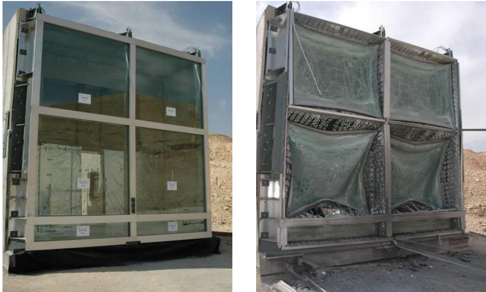
6. ábra. Speciális üvegfelület a robbanás előtt és után 13

Az egyik leghatékonyabb a többrétegű üvegfelület alkalmazása, amelynek PVB-gyanta alapanyaga az eredeti tulajdonságok megtartása mellett erősebbé, hajlékonyabbá teszi a nyílászárót. Hasznos megoldás lehet az üvegfelület fóliázása is, mely során a belső és a külső felületre poliészter alapú fóliaréteget rögzítenek, amely az ablaküveg törésekor összefogja azt, és nem engedi az üvegszilánkokat, repeszeket szétszóródni. 14 Az üvegfelület erősítésére alkalmazható az üveglapok drótrácsozása, amely szintén megakadályozza az üveg berobbanását, szilánkok keletkezését.