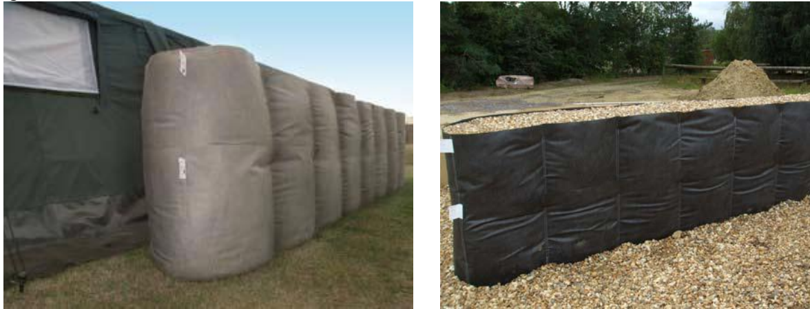
3. ábra. DEFENCELL modulok alkalmazási lehetőségei 10

azonban nem szabad elfelejteni a személyek ellenőrzésének, valamint a robbanószerkezet észlelésének, felfedésének fontosságáról sem! Erre alkalmazhatók a különböző röntgenberendezések, a milliméteres hullámhosszúságon működő szkennerok, amelyek a ruházaton is „átlátnak”, valamint a gázkromatográfiás berendezések, melyek a levegőből vett „szagmintával” képesek az ellenőrzésre.