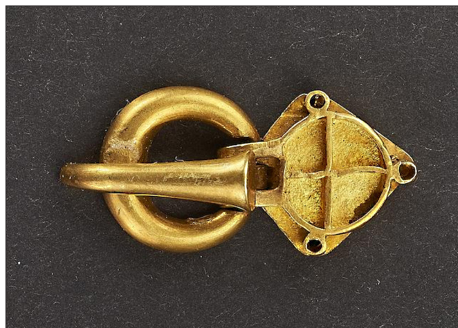
9. kép. Az ún. marcelházi csat. MNM ltsz.: 62/1889 N 222 ( https://www.museumap.hu/record/-/record/oai-aggregated-bi55860274;jsessionid=DDC25A6E9E9494C4B46D1AF4507DFC57 , 2022.02.16-i állapot)

Az 5. század első feléből származó tárgyak elhelyezésének korabeli módját, illetve háttérében meghúzódó okokat jelenleg nem tudjuk minden kétséget kizáróan rekonstruálni, illetve megválaszolni. A felvetődő kérdések közé tartozik, hogy a tárgyakat – az aranyozott ezüst, pikkelydíszes lemezhez/lemezekhez hasonlóan – eredeti hordozó felületükről eltávolítva, és/vagy bőr övekkel/szíjakkal együtt, esetleg azokat feldarabolva deponálták-e? Az ásatási megfigyelések alapján további kérdés, hogy beásások, elszíneződések hiányában a tárgyakat esetleg a felszínen helyezték-e el? Mi lehetett a tárgyak elhelyezésének háttéré-