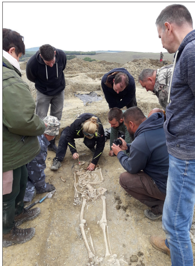
6. kép. A 13. sír mellékletének felszedése.

A gyermeksírok sorának déli végén egy újratemetett személy vázát tártuk fel (2. sír), vázcsontjai egy viszonylag mély, kerek gödörben rétegesen, de ízületi kötődést mutatva voltak elrendezve. A gödör tetejére helyezték koponyáját, arccal ellentétes irányba tájolva a többi vázától. A 40–50 éves férfi életkorából fakadóan ízületi problémákban szenvedett, és még életében elvesztette minden fogát. A fogvesztést indokolja az egyén előrehaladott kora és az állkapocs cisztás megbetegedése is. A jobb