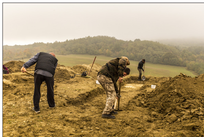
4. kép. Az önkéntesek végzik a humusztávolítást.