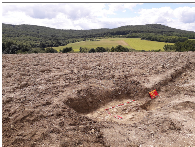
1. kép. Kisbárkány, Kukely-tanya lelőhely, az 1. sír helyzete.

A fémkeresős kutatást a feltételezhető temető területén indítottuk, hogy megállapítsuk egyrészt annak korszakát, másrészt veszélyeztetettségi fokát. Egy mélyebb ekenyomban elpusztított váz koponyacsontjai között keltező értékkel bíró mellékleteket találtunk. Az ékszerek a koponya és a nyak környékéről származhattak, erre a két bronzhuzalból készült S-végű hajkarika és a nyitott hajkarikák utalhatnak. A mellékletek egyike, egy ezüsthuzalból csavart gyűrű a váz kar- és kézfejsontjainak pusztulását jelezte (1–2. képek).