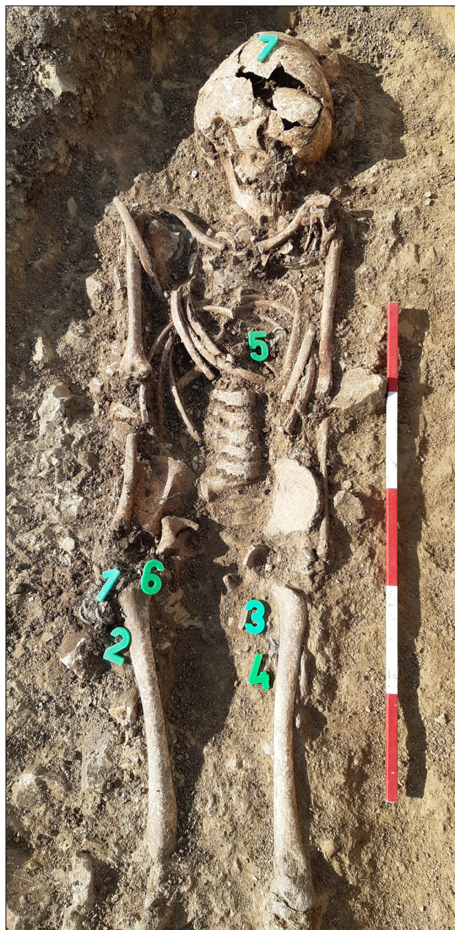
8. kép. II. sír kibontva.

Az obulusként kapott éremleletek mellett a temető leletanyagát a sírok ékszerei, továbbá a dombon 2016 nyaratól a feltárás időpontjáig előkerült fémkeresős találatok tárgyai alkotják. A tárgyak a Dornyay Béla Múzeumban, illetve a Magyar Nemzeti Múzeumban kerültek elhelyezésre. A koordináttákkal ellátott tárgyak kirajzolják a teljes dombtető