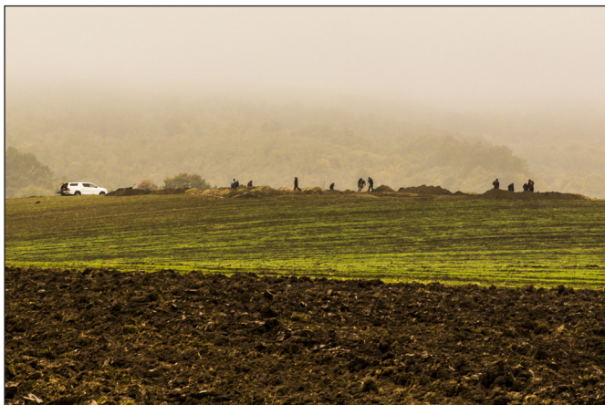
5. kép. A temető helyszíne. (Tóth Krisztián)

sította a vázak elcsomagolásához szükséges anyagokat, illetve a múzeum két antropológusa, Szvák Enikő és Madai Ágota szedte fel a vázakat. A Várkapitányság, a MNM, a Dornay Béla Múzeum, a Kubinyi Ferenc Múzeum régészei közül pedig sokan saját szabadidejükben jöttek el segíteni (3–6. képek).