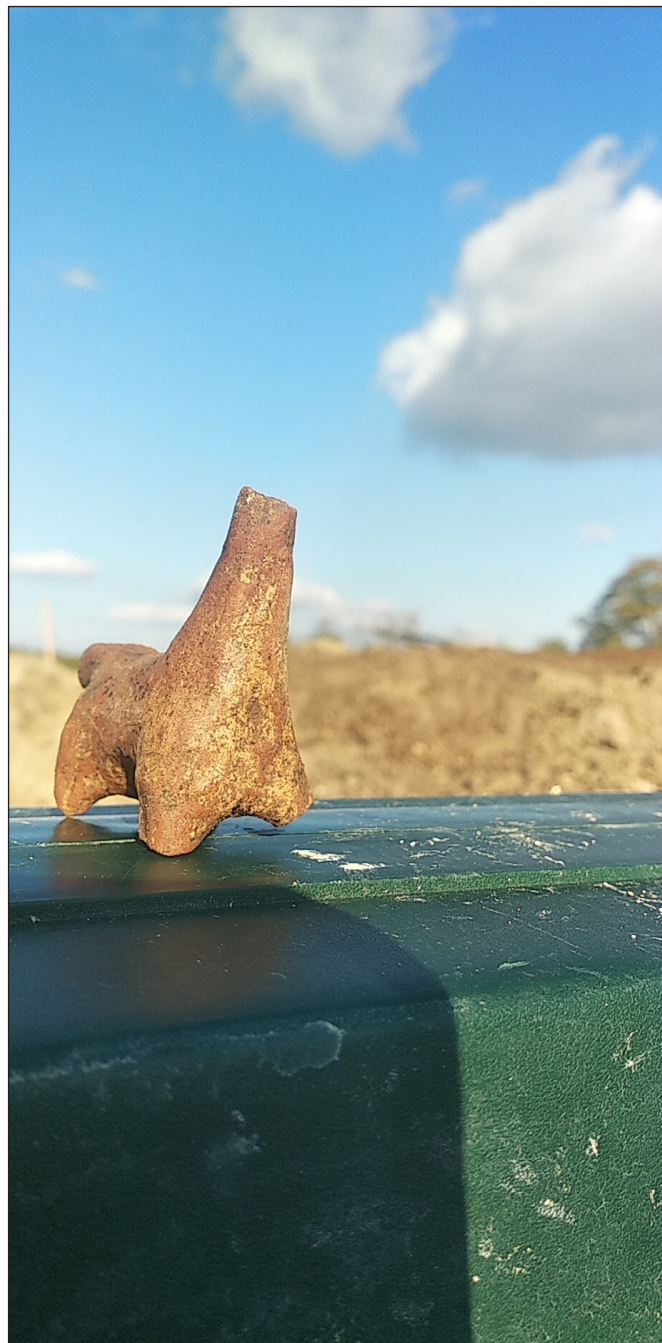
10. kép. Vaskori állatfigura.

A feltárás óta az eredményekről beszámoltunk a szentendrei közösségi régészeti konferencián, és a helyi múzeum számára is éves beszámolót adtunk a szokásos médiamegjelenések mellett. Márciusban kiállítás nyílt a Magyar Nemzeti Múzeumban közösségi régészet témakörben („Kincset érő közösség”, megtekinthető március 7-től szeptember 4-ig), melynek része a kisbárcányi feltárás is; készül a nyáron megjelenő tanulmánykötet, melyben a kisbárcányi civilek is feladatot kapnak.