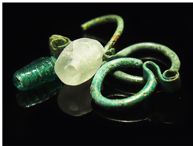
2. kép. Az 1. sír mellékletei.