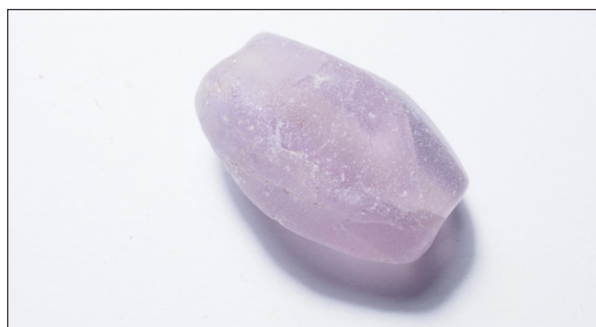
9. kép. Féldrágakő (fluorit), a 6. sír melléklete.