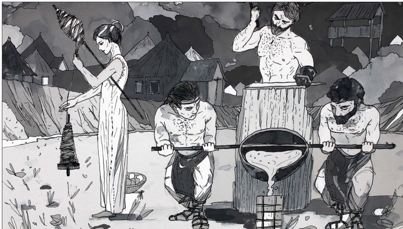
2. kép. Aktív férfi – passzív nő fejezet fő illusztrációja, a mellette olvasható idézettel: „...valószínű, hogy a nők, akik a férfiakkal együtt dolgoztak, közösen játszottak szerepet abban a kísérletezésben, amely megváltoztatta a növényi táplálékhoz való viszonyunkat, és a természethez ...és általában a világhoz, örökre.”

(COLTOFEAN-ARIZANCU, GAYDARSKA & MATIĆ 2021, 14–15)