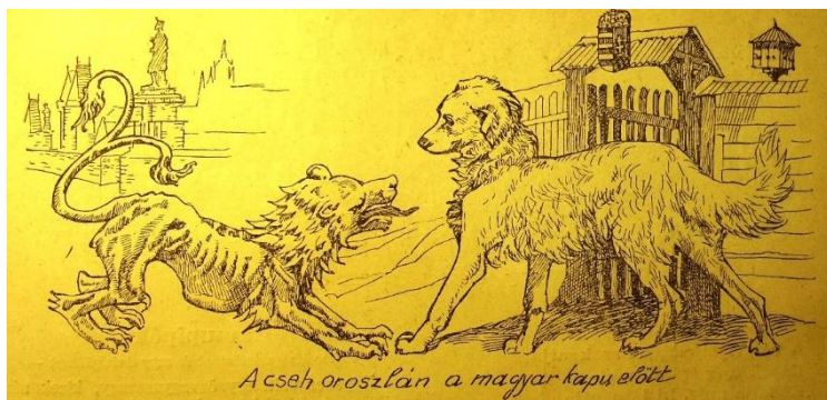
A cseh oroszlán a magyar kapu előtt. Borsszem Jankó (Budapest), 50, 44. sz. (2604) 1917. november 4.

Az államfordulat idején még senki sem számolt hasonló turbulenciákkal. Teljesen más dolgok élveztek prioritást. Míg Prágában órákban mérték a fordulat idejét, Csehországban és Morvaországban napokban, a határvidéken, főként a Szudéta-vidéken pedig hetekben, addig Szlovákiában csupán elkezdett kibontakozni a politikai, diplomáciai és katonai küzdelem az új államhoz való csatlakozásért, bár annak határaitól nemegyszer egymásnak ellentmondó elképzelések éltek. A köztársaságnak még bizonyítania kellett Szlovákiában az életképességét, ami politikai bölcsességet, diplomáciai tapintatot, katonai határozottságot és kellő meggyőző képességet igényelt.