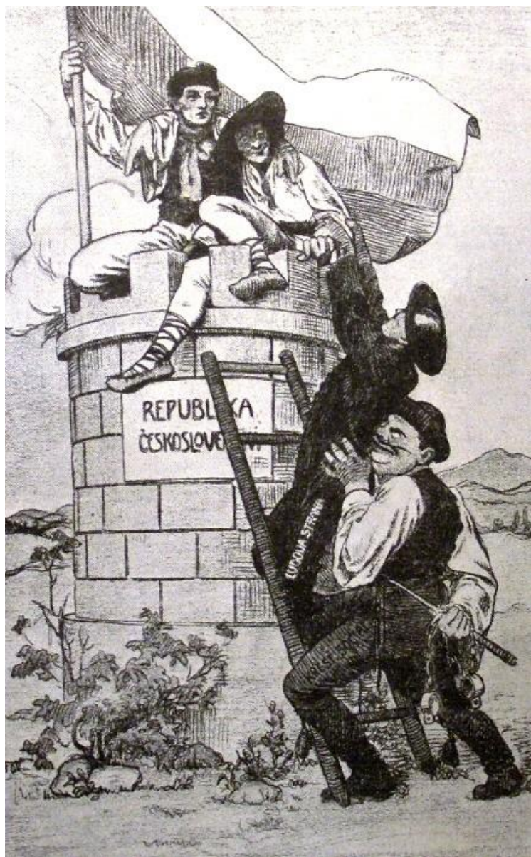
(Szlovák) Néppárt-ellenes plakát