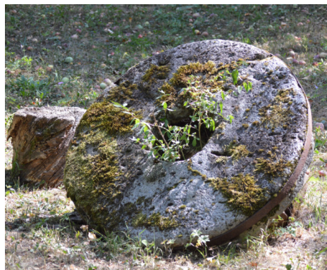
1. ábra. A tanulmányozás tárgya, a kidei malomkő

A tanulmányozott malomkő összpontszáma 7 pont ( 2. ábra ), így csak idegenforgalmi adottsági funkciója van (hiszen nagyon távol áll a 25 ponttól). Anyagi befektetésre és munkára volna szükség ahhoz, hogy ebből a tárgyból idegenforgalmi attrakciót hozzunk létre.