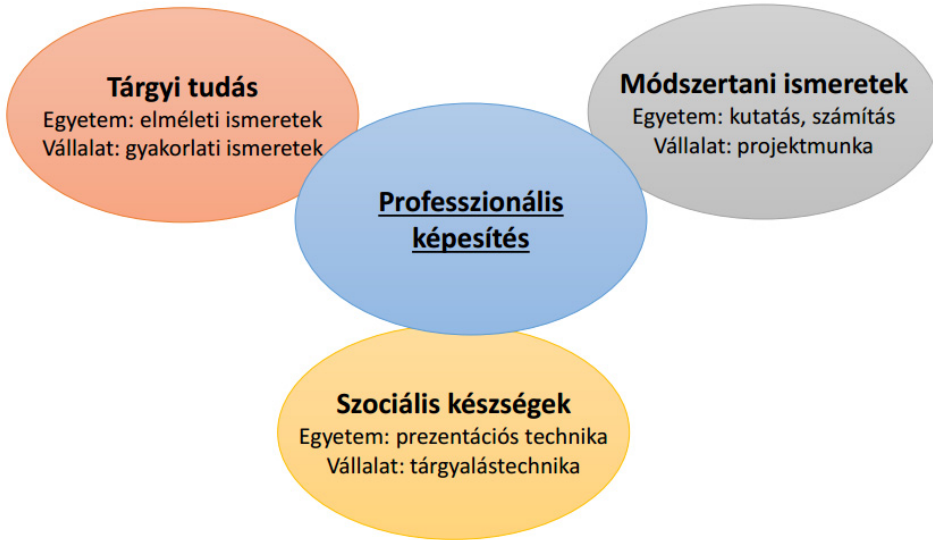
1. ábra. A duális képzés elemei

Legfontosabb jellemzője, hogy az elméleti képzés a főiskolán, a gyakorlati képzés az együttműködő vállalkozásnál folyik, amelynek során a hallgatók közel ugyanannyi időt töltenek a vállalatnál, mint a felsőoktatási intézményben ( 1. ábra ). A hallgatók a duális képzés során a leendő gépészmérnöki szakképzettségüknek megfelelő munkahelyen és munkakörben összekapcsolják a főiskolán szerzett elméleti ismereteket a partnervállalatnál elsajátított gyakorlati ismeretekkel. A vállalati gyakorlati képzés során lehetőség nyílik a munkafolyamatokban a gépészmérnöki feladatkörök gyakorlásához szükséges munkavállalói kompetenciák (önálló munkavégzés, kreativitás, problémamegoldó képesség, projektszemlélet stb.) fejlesztésére. A hallgatók így gyakorlati jártasságot szereznek az anyag-