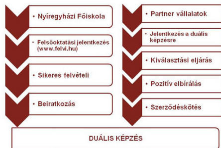
3. ábra. Felvételi eljárás folyamata

A duális képzési szakokra való jelentkezés a felvételi eljárásban két, egymással párhuzamos szakaszból áll: az állami, általános felvételi eljárásból – amely semmiben sem különbözik a nem duális szakokra való jelentkezéstől – és egy vállalati felvételi szakaszból (3. ábra).