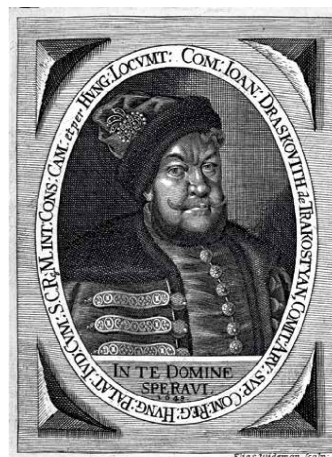
Draskovich János mellképe

Nem véletlenül időzünk ennyit a gyűlések-nél, hiszen ez volt a korszak politikai életének legfontosabb fóruma. Itt dőltek el a legjelentősebb politikai kérdések, a bárói kinevezések, adókérdések, és itt lehetett a legkönnyebben meggyőzni az uralkodót az egyes ügyek elintézésének a módjáról. Itt zajlott az az alapvetően kétpólusú irányítási rendszer, melyet rendi dualizmusnak nevezünk, és a mindennapokban általában az uralkodó, illetve a királyság rendejeinek együttműködését jelentette. A 17. század elején ez a viszony megbicsaklott, ma talán úgy mondanánk, hogy a politikai rendszer bizalmi válságba került, és a következő