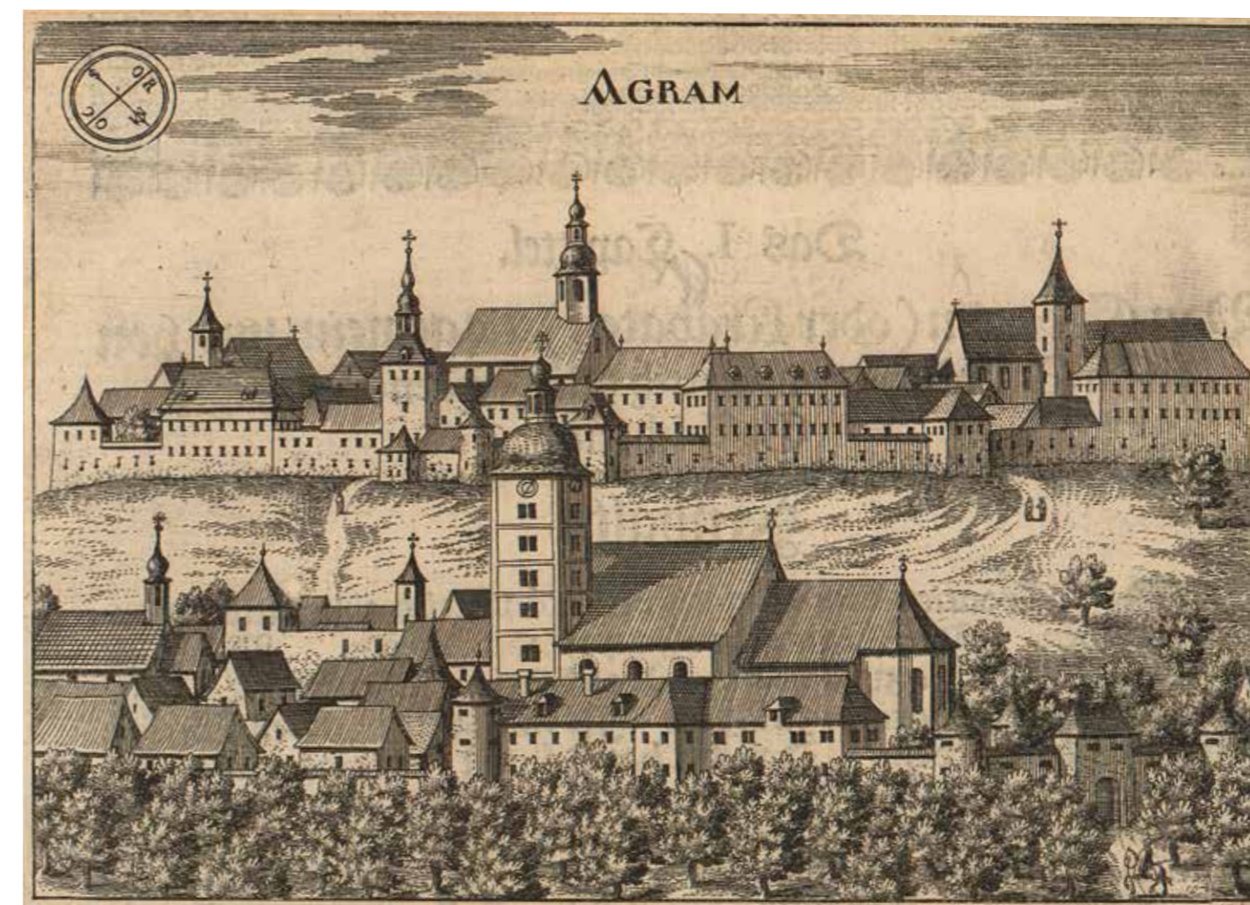
Zágráb a 17. században

A horvát-szlavón rendi gyűlés a középkortól kezdve rendszeresen küldött követeket a magyar országgyűlésre, általában három főt (1598-ban, amint láttuk, csak kettőt), akik közül egy