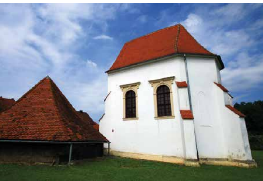
Szent Ilona pálos kápolna