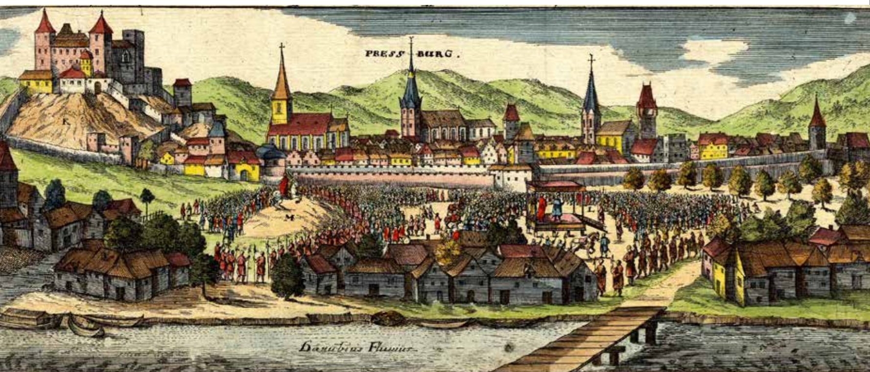
Pozsony, a királykoronázás helyszíne, ismeretlen német mester színezett rézkarca, 1655.