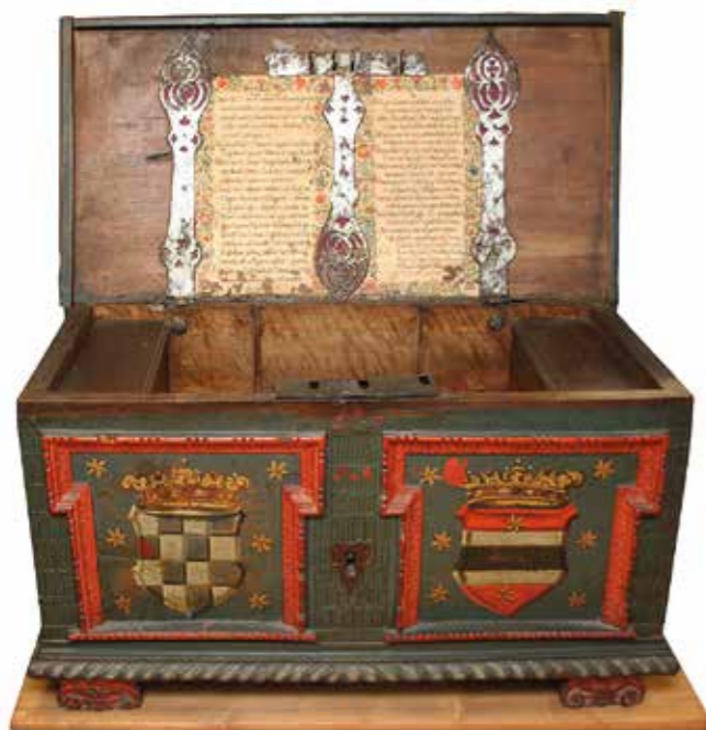
A horvát-szlavón országláda

Nagyon tanulságos a szlavóniai házfőnökök érvelése, miszerint azért nem maradhatnak tovább egy tartományban, mert túl nagy a horvátok és a magyarok között a nyelvbéli és identitásbéli különbség. 73 Az egyházi értelmiség egy része tehát Zrínyi báni időszakában eljutott a kiválás gondolatáig, és meg is valósította azt, a zágrábi püspökök pedig a század végén vetették fel az önálló egyháztartomány ötletét. A világi nemesség politikai gondolkodásában ekkor még nem merült fel mindez, de miként Ráttkay műve is mutatja, többé már nem a Magyar Királyság alávett részeként identifikálták magukat, hanem miként az 1655. évi pozsonyi országgyűlésre készülő követutasításban megfogalmazták, a vele egyenrangú Horvát,