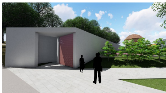
3. ábra. Tervezett látogatóközpont bejárat