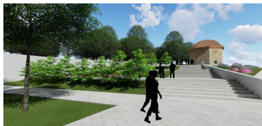
2. ábra. Tervezett park bejárat

A bejáratot egy az utca szintről levezető nyaktaggal (a lejutást egy rámpa és egy lépcsősor is biztosítja) képzeljük le, ami folyamatosan lejtve belésimul, a már említett térbe. Úgy terveztük, hogy a földfelszínen csak ez a nyaktag jelenik meg és jelzi új épületünket. Burkolatára két féle gondolat merült fel, az első a fehér látszóbeton falak, a második pedig világos színű csiszolt kőlapok mind fedésként, mind az oldalakon. A tervezett bejáratot egy perforált corten acél ajtó, amibe tervünk