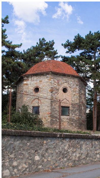
1. ábra. Idrisz baba türbéje

Pécsen ahány nép megfordult annyi féle szokással és annyiféle helyre temetkeztek. A török időkből származó temetők nehezen behatárolhatóak,