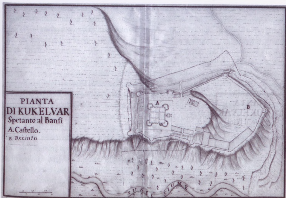
2. A kastély és környéke 1687-ben

özvegyével: Thököly Máriával), akik 1693 táján részüket II. Apafi Mihálynak elzálogosították. A kastély 1693-ban kelt összeírásában így már a teljes együttest II. Apafi Mihály számára vették számba. 31