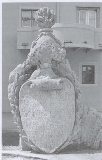
8. Bethlen Miklós feliratos emléktáblája, 1773

A kastély főhomlokzata is teljesen átalakult ebben az időszakban: a hajdani felvonóhidat felszámolták, egy rögzített, fedett híddal helyettesítették. Ennek tetején egy teraszszerűséget alakítottak ki, amelynek párkányát barokk faragványokkal díszítették. Főhomlokzatára az építető 1773-as évszámot viselő, babérmagányos és bőségszarúval kerített, feliratos faragványát helyezték el (7–8. kép). A faragvány súlyosan rongálódott, töredékes állapotban ma a kastély hátsó homlokzata előtt hever. Felirata: