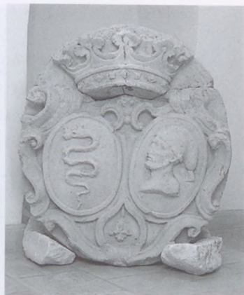
10. Bethlen Miklós és Csáky Katalin házassági címere, 1769

tetünk, hogy a gróf felhagyta a második emeleti kis toronykápolnát, és helyette egy nagyobb, vélhetően két szintet (a földszintet és az első emeletet) átfogó, boltozott kápolnát alakított ki a kastély hátsó traktusában, amelyhez egy emeleti oratóriumot is kapcsolt. 55 A kápolna berendezését illetően tizenkét székről, egy lépcsővel emelt oltárról és egy szószékről szerzünk tudomást.