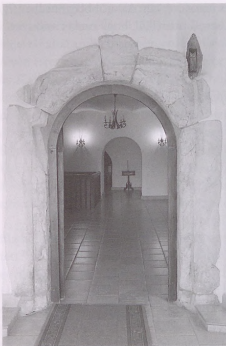
4. A kastély egykori kőkeretes főkapuja

dott eredetileg is, melynek külső lejtőjét téglával bélelték. Felvonóhid vezetett az árkon keresztül a kastély egyetlen kapujához, amely a délnyugati homlokzat középtengelyében nyílik.