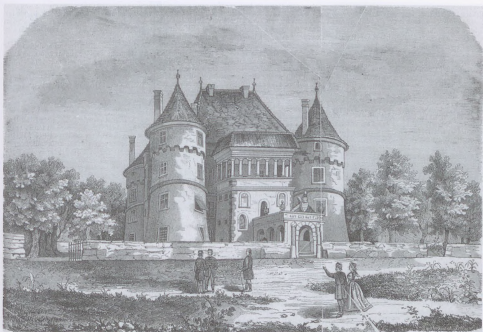
7. A kastély főhomlokzata, 1866

A fentiek alapján megállapítható, hogy a kastély reprezentációs szintje a második emelet volt. Az első emelet 18. századi funkcióit nem ismerjük, csupán „a néhai grófné asszony ő excellentiája (ti. Csáky Kata) ebédlő kis palatáját” említik, amelyet ugyancsak a 18. század utolsó harmadában festettek ki. 51