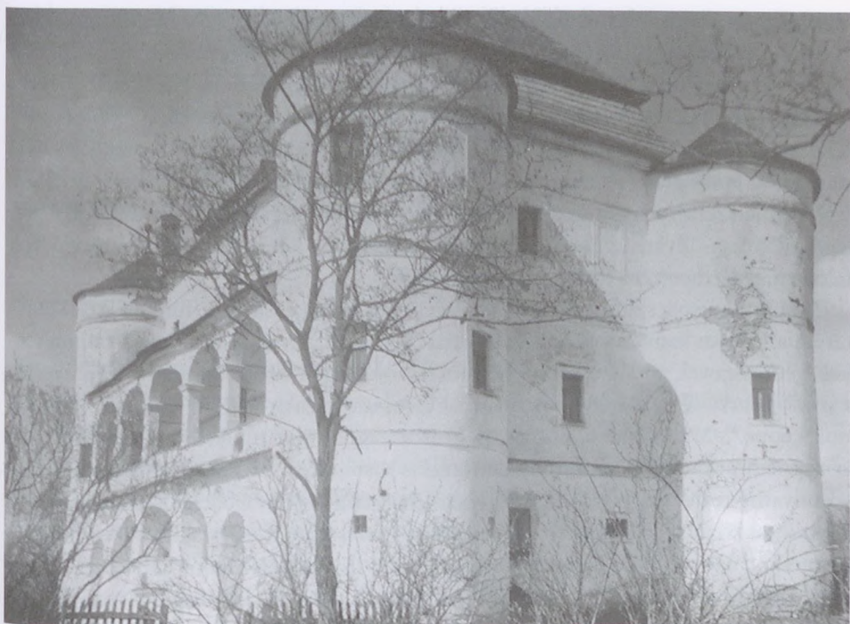
11. Az alsómicseyei kastély, 1951