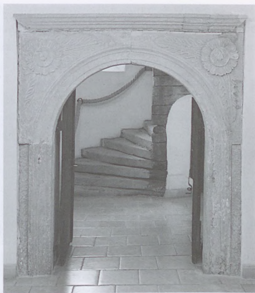
6. A lépcsőtornyony kő ajtókerete

bizalmasabb vendégek az „audienciás házon” keresztül juthattak a déli toronyban berendezett „úr házába”. 43