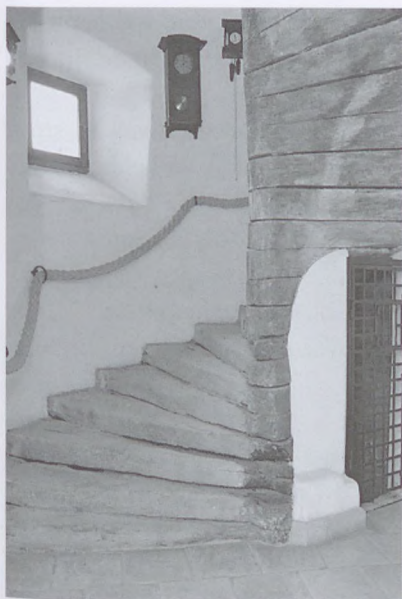
5. A kastély csigalépcsője