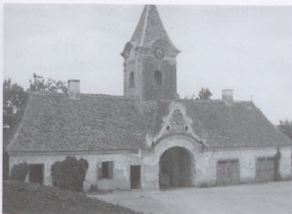
9. A hajdani kapuépület, 1935