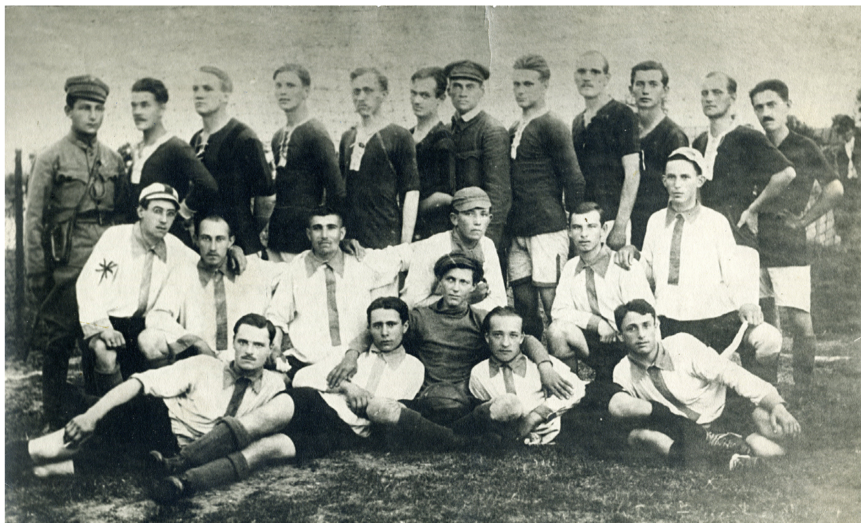
11. kép. A Budapesti Vasas és a Szekszárdi Törekvés csapatai között 1919. május 1-én játszott barátságos mérkőzés után készült kép