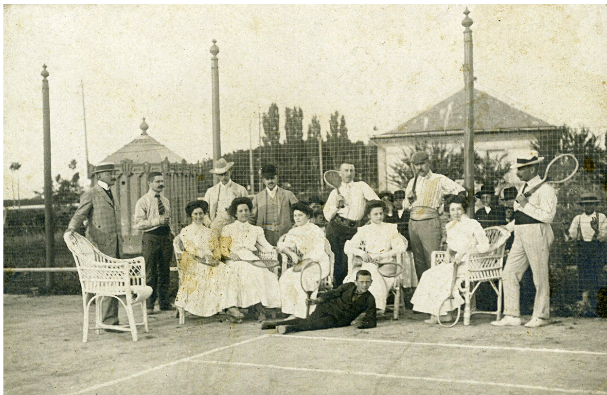
7. kép. A Szekszárdi Tenisztársaságról készült csoportkép