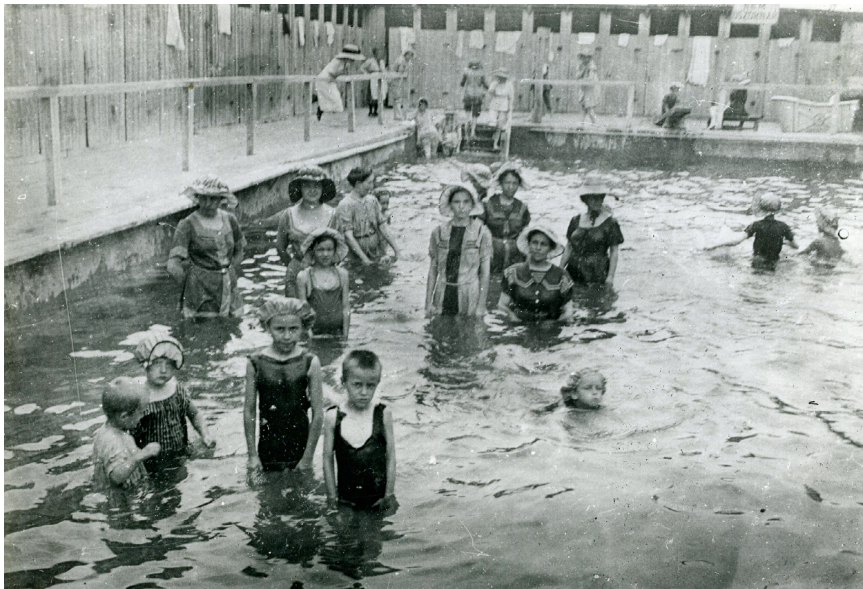
2. kép. Fürdőzők Szekszárdon a Schwarcz-féle fürdőben az 1900-as évek elején