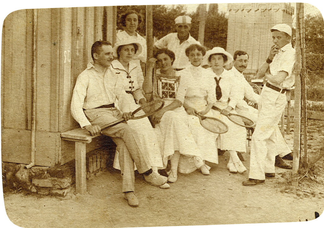
8. kép. A Szekszárdi Tenisztársaság csoportképe