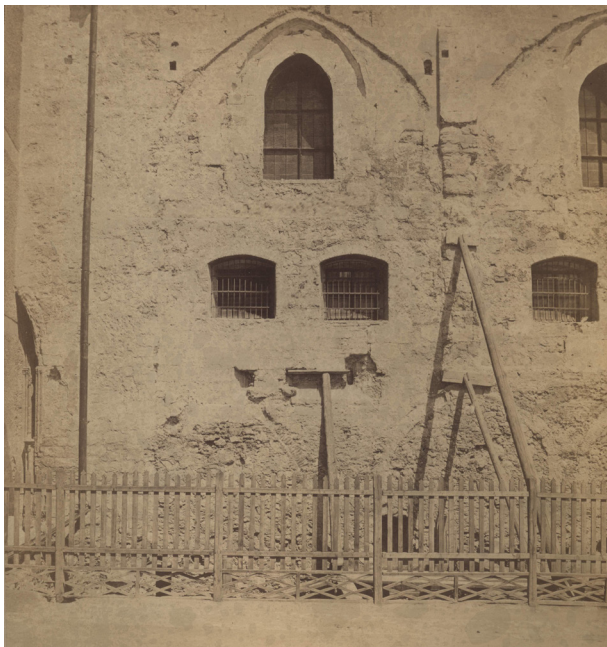
4. ábra. A Mátyás-templom felújításakor készült fénykép a gótikus ablakok török kori átalakított képével