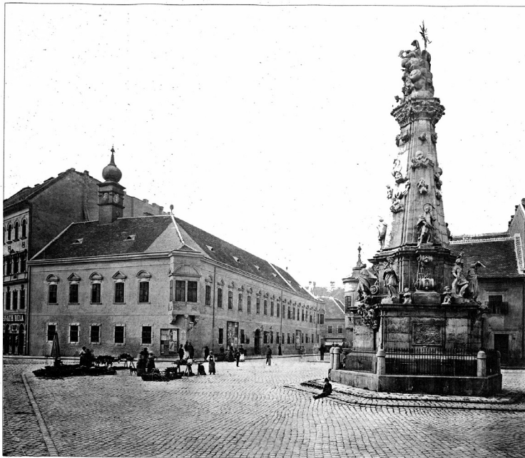
3. ábra. A budai városháza a Szentháromság-szoborral. 1891.