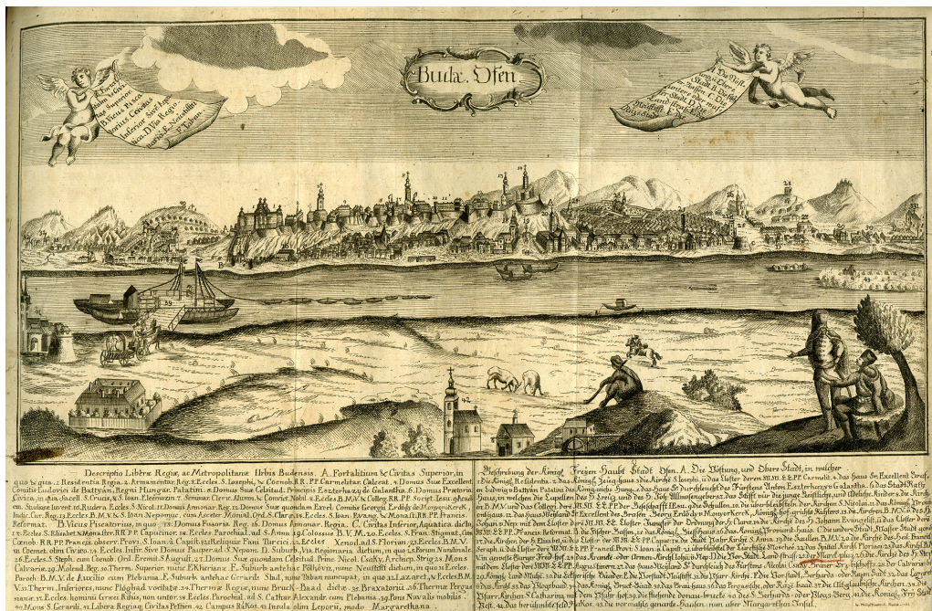
2. ábra. Buda látképe. Johann Philipp Binder rézmetszete, 1761. (Közlki: Epitome 1761. 36–37. FSzEK Budapest Gyűjtemény)