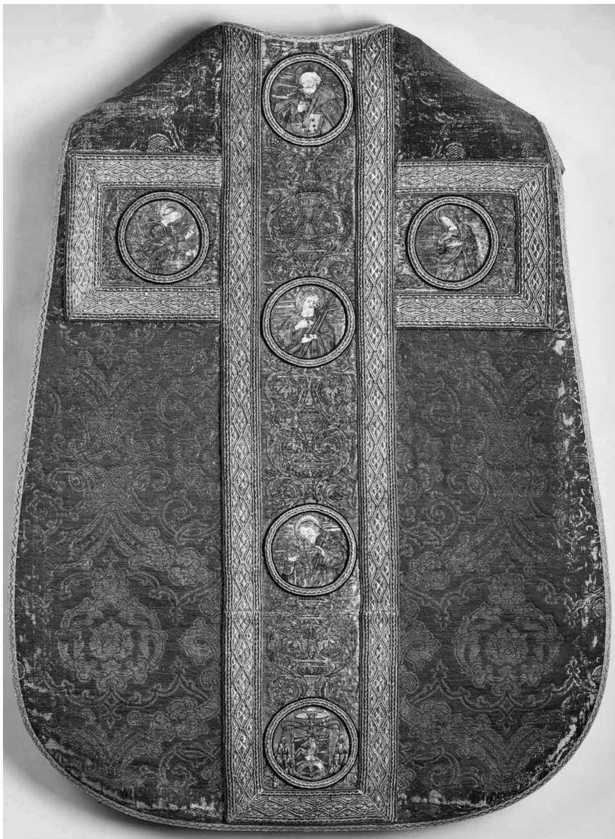
2. Bakócz Tamás miseruhája (háttoldal). Esztergom, Főszékesegyházi Kincstár