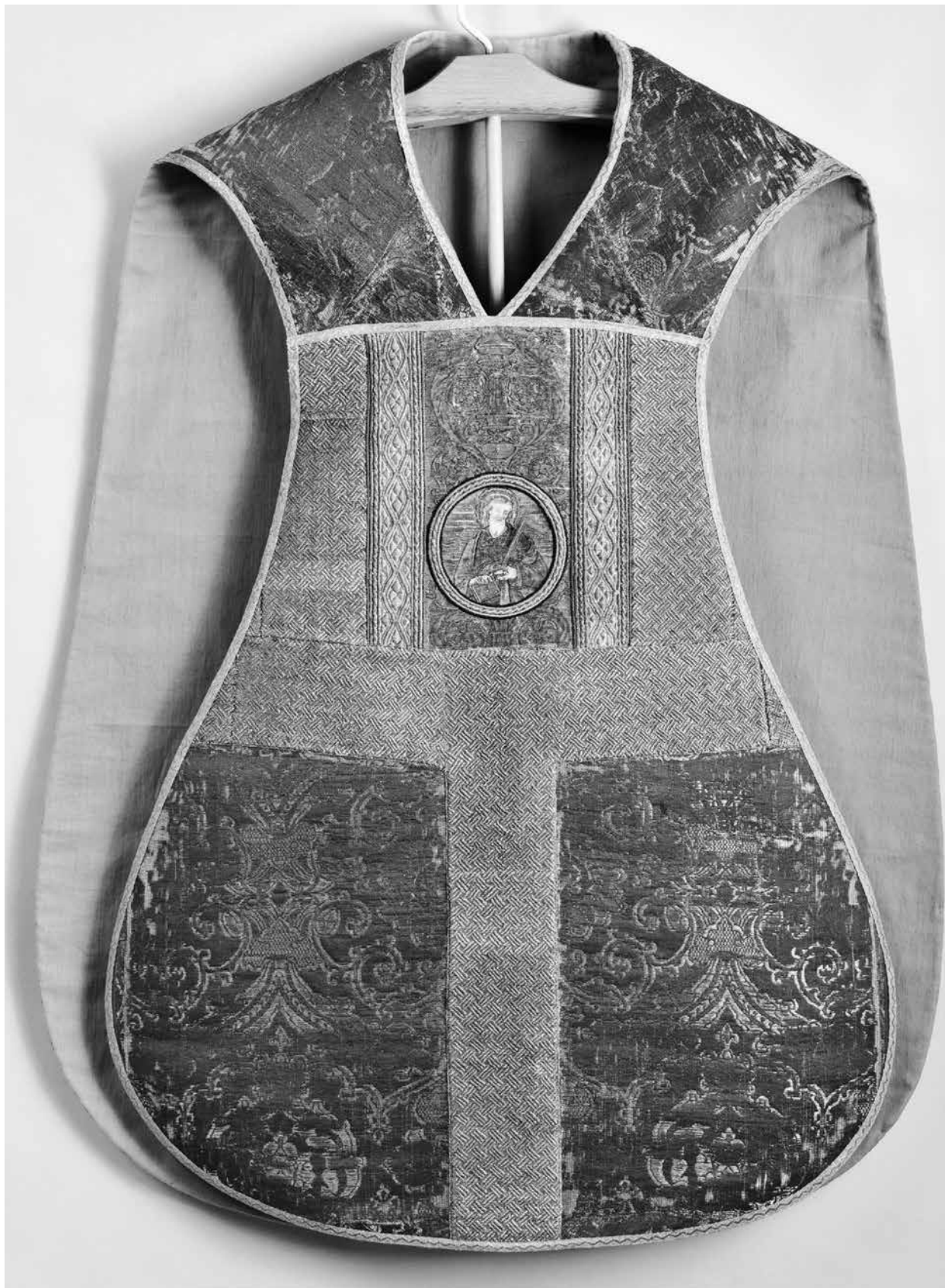
1. Bakócz Tamás miseruhája (előoldal). Esztergom, Főszékesegyházi Kincstár