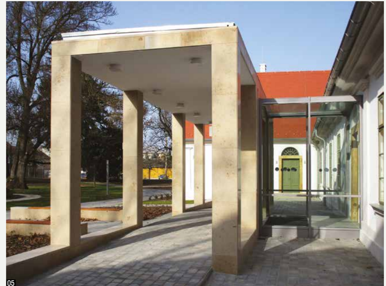
04 A szépen felújított Perczel utcai főhomlokzat 05 Az új bejárati építmény és azt az épülettel összekapcsoló üvegezett nyaktag/szélfogó