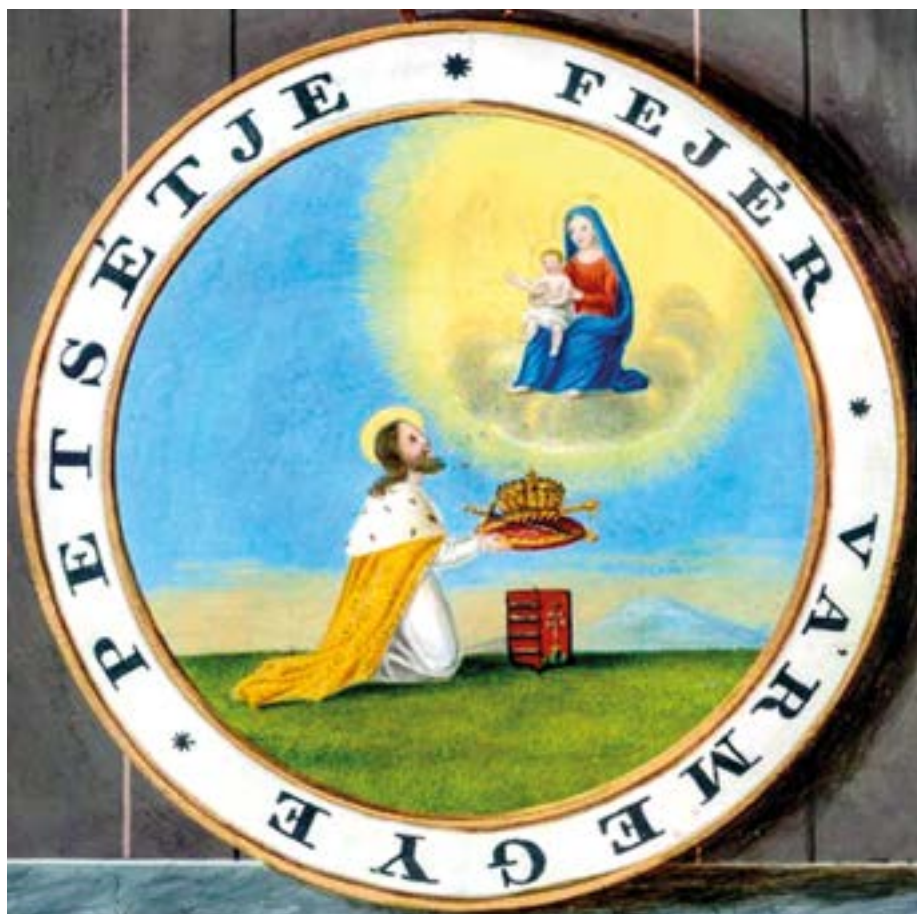
9. kép. Fejér vármegye címeres pecsétadománya V. Ferdinánd adományozóleveléből, Fejér megyei Levéltár XV.22.16 jelzet.

Fejér vármegye pecsétképe a XVII. század végén, a barokk korban keletkezett, az élő heraldika szigorú szabályait feloldó időszakban, amikor gyakran előfordult, hogy a klasszikus pajzsforma oválisra vagy kerek alakúra változott. 94 A címer használatát, ismertségét feltehetően elősegítette az 1802–1812 között