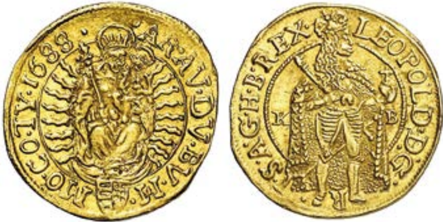
5. kép. I. Lipót (1657–1705) aranydukátja.

Ezzel szemben a nyugaton és északon megmaradt országrészek, vagyis a Magyar Királyság területén I. Lipót uralkodásától (1657–1705) kezdve az a tendencia figyelhető meg, hogy a Magyarok Nagyasszonyának tisztelete a politikában is dominánssá válik. 45 A Szent Liga felszabadító hadjárata előtti időszakban a diadalmasan trónoló Máriát láthatjuk, valamint az álló alakos Napba öltözött Asszonyt. A Madonna napsugárkoszorúja tagolt és kidolgozottabb az előző korszak érmeihez képest, épp ezért hangsúlyosabb (5. kép). A későbbiekben ez a megoldás válik általánossá. A felirat karakterisztikusan gazdagodik az „Immaculata” szó hangsúlyozásával.