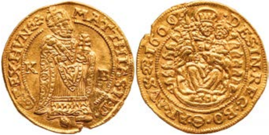
3. kép. II. Mátyás (1608–1619) aranyforintja 1609. Forrás: Soós 1998, 101.

II. Mátyás (1608–1619) időszakában, valamint II. Ferdinánd (1619–1637) uralkodásának elején, 1613 és 1620 között vertek olyan érmeket, amelyek hátlapján a koronával és jogarral ábrázolt Madonna baljában a gyermek Jézust tartja, és egy holdsarló feletti vánkoson ül, a Nap képe viszont hiányzik az éremről. A nagybányai típuson mindig hiányzik a sugárkoszorú, viszont a Madonna ruhája egyöntetűen díszes kivitelű. 34 A garasok esetében is a készítés helye meghatározó eltéréseket, változatokat jelez. A hátlapon azonos differenciálódás figyelhető meg, mint a forintoknál (3. kép): sugárkoszorúval vagy nélküle ábrázolják a Szent Szüzet. Változatot jelent az is, hogy a kis Jézus tart-e országalmát a kezében, vagy nem. A garasok körfeliratán azonban egységesen Patrona Hungariae szöveg olvasható. Nagyjából ugyanez mondható el a tallérokról is.