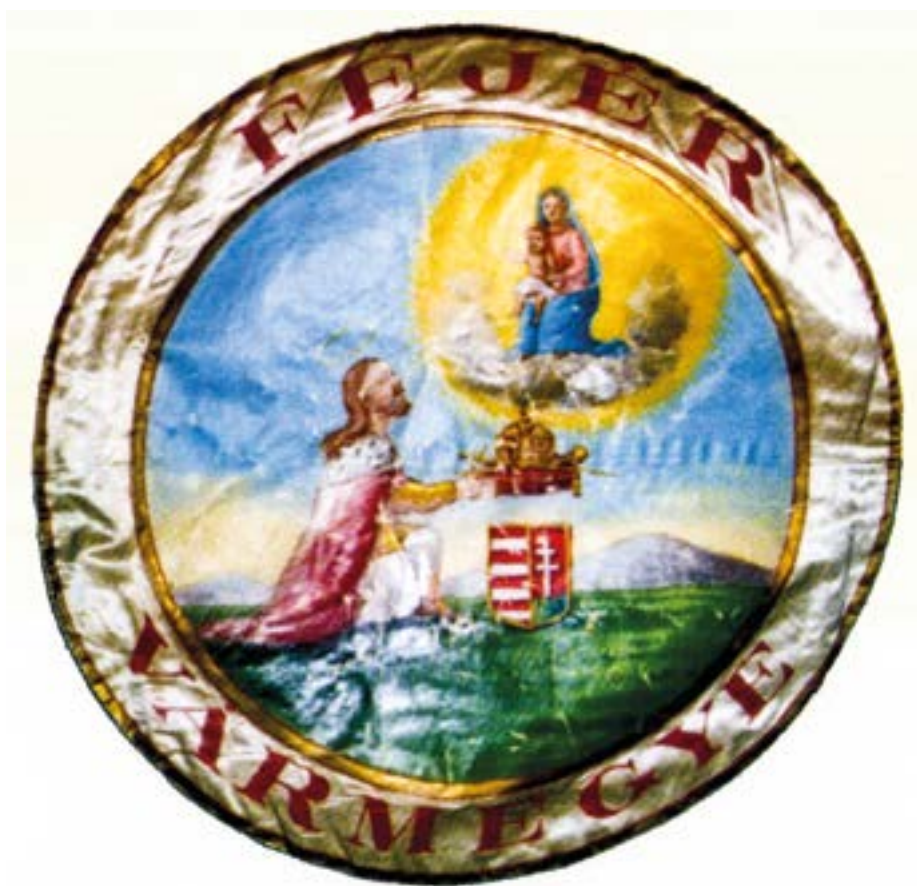
14. kép. Fejér vármegye zászlaja XVIII–XIX. század fordulója.