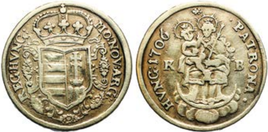
6. kép. II. Rákóczi Ferenc (1704–1711) ezüstforintja – féltallér, 1706.

czy Ferenc 1704-től az erdélyi rendek által megválasztott fejedelem is, így élvezve pénzverési jogával, új Madonna-típust alkalmaz (6. kép). Erdélyi fejedelemként