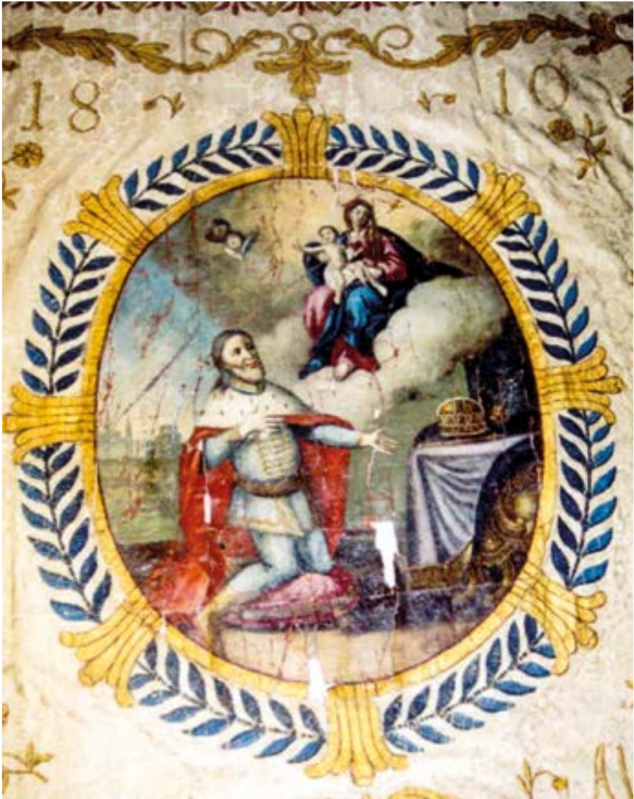
13. kép. Fejér vármegye insurgens zászlaja 1810-ből.