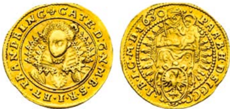
4. kép. Brandenburgi Katalin fejedelemasszony (1629–1630) két aranyforintos, 1630.

szimbolizálja. 41 A fejedelem 1629. november 15-én bekövetkezett halála után felesége, Brandenburgi Katalin rövid ideig tartó fejedelemsége alatt maga is veretett a Napba öltözött Asszony képével érmet. Szűz Mária alakja a hátlapon található, napfénymandorlában, alul a brandenburgi sassal (4. kép). A köriratban rövidítéssel szerepel: PAR(tium) R(egni) H(ungariae) D(omina) SIC(ulorum) CO(mitissa) A(c) B(ergae) I(uliae) C(liviae) M(ontium) D(ucissa). 42