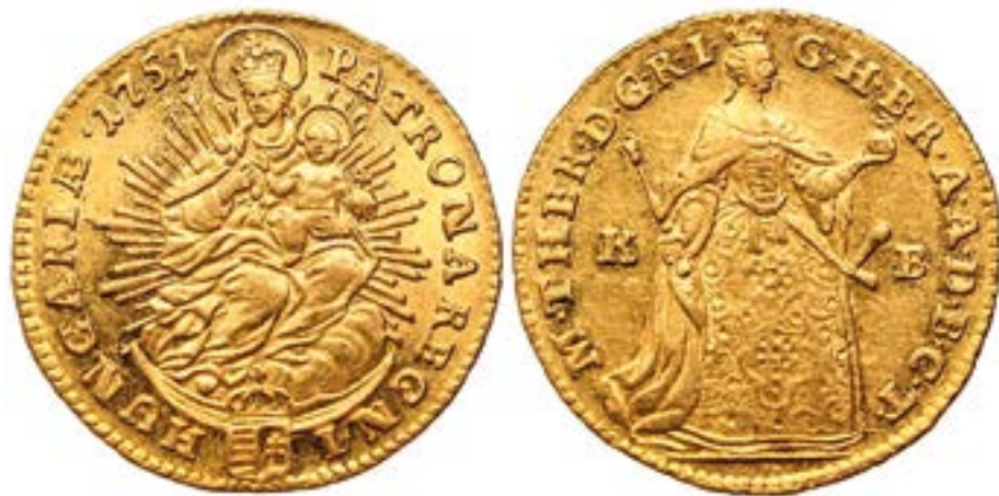
7. kép. Mária Terézia (1740–1780) aranydukátja, 1751. Forrás: Soós 1998, 205.

Mária Terézia uralkodása alatt készült dukátokon és a tallérokon a Mária lába alatt lévő holdsarlót átvágja a magyar címér, és a Szent Korona ékesíti (7. kép). Általánosságban elmondható, hogy a királynő uralkodása alatt a fémpénzekon a nemzeti jelleg egyre jobban kidomborodik. 56 Ez leginkább a tallérok és féltallérok hátlapján figyelhető meg, ahol a korábbi, általánosnak mondható kétféjű sas helyett a Madonna álló alakját helyezték el. 57