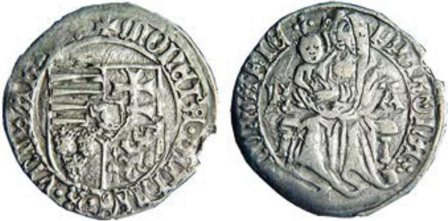
1. kép. I. Mátyás (1458-1490) ezüstgarasa 1468 után.

pénztörténetben, mert „Madonnás” érmei (1. kép) századokra meghatározták a magyar pénz jellegzetes típusát. 2