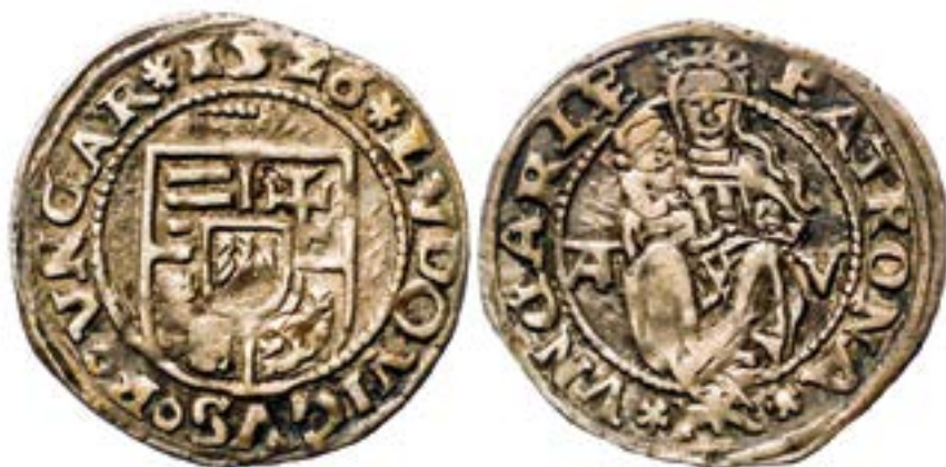
2. kép. II. Lajos (1516–1526) ezüstdénárja 1525.

Az I. Mátyás-féle fátyollal és a koronával ábrázolt Madonna-típusok tovább éltek II. Ulászló uralkodásának időszakában is, azonban az 1500-as évektől megjelentek az úgynevezett holdsarlós ábrázolások. 23 Itt a Madonna alakját helyezték arra a vízszintesen elhelyezett vékony ívre, mely a Hold sarlóját jelképezte. Ez az ikonográfiai ábrázolás II. Lajos (1516–1526) időszakában rögzült (2. kép). Mind a körmőcbányai, mind a nagyszebeni és nagybányai éremvedre ezeket a holdsarlós képeket verte a pénzekre. 24