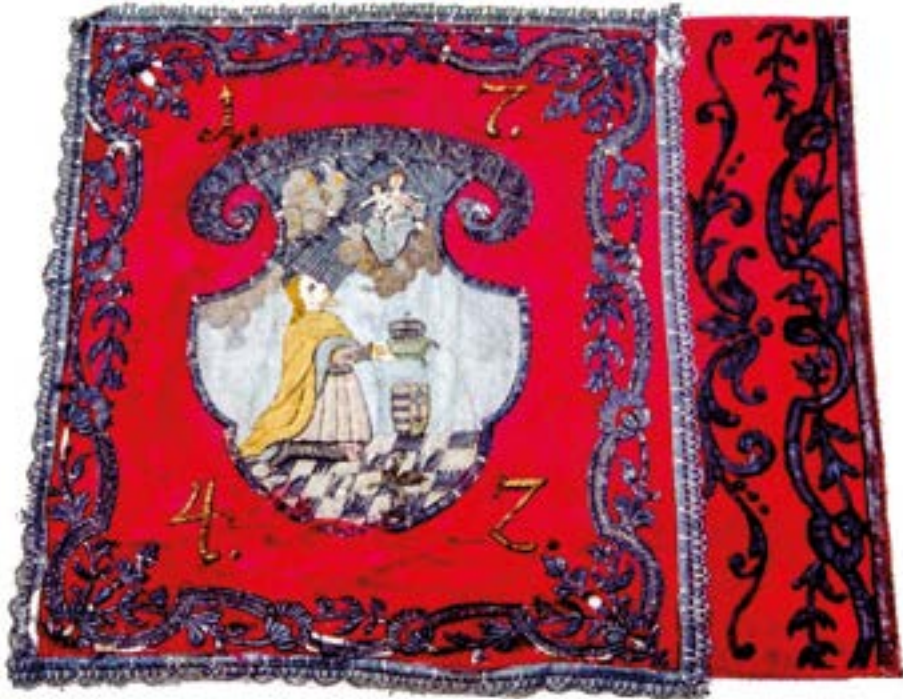
11. kép. Fejér vármegye insurgens (nemesi felkelési) zászlaja 1742-ből.

A Habsburgok uralkodásának első kétszáz esztendejében, gyakorlatilag Mária Terézia uralkodásáig a magyar színek használata már nem önálló és nem folyamatos. 132 Ez vezetett oda, hogy csak jeles ünnepek alkalmával, mint például a koronázás vagy az uralkodó látogatása, vonultatták fel a magyar címeres országzászlót, és annak színeivel díszítették fel a termeket, épületeket. 133 Ez a helyzet azonban Mária Terézia uralkodásától kezdve megváltozott, mivel számára a magyar nemesség támogatásának megszerzése és megtartása jelentős tényező volt a politikai stabilitásban, valamint a birodalom katonai helyzetének megtartásában.