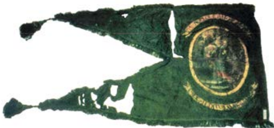
12. kép. Fejér vármegye insurgens zászlaja 1797-ből. Forrás: Vitek 2009, 106.

Fejér vármegye esetében öt címeres vármegyei zászló maradt fent, ezek közül négynek maradt meg a címerképe. A legrégebbi a XVIII. század közepén készült, az 1742-es megyei nemesi felkeléshez. (11. kép) A zászló – hasonlóan a főúri zászlókhoz – egyik oldalán a vármegyei címet, másik oldalán a későbbi kiscímet ábrázolja. Anyaga kétlapos vörös selyemdamaszt, mérete 57 × 50 cm. A vármegyei címet tűhímzéssel selyem-, ezüst- és aranyszállal készítették. A zászló ezen oldalának alsó részén a gróf Esterházy család kardot és virágcsokrot tartó koronás griffmadara is látható. A címer feletti szalag felirata „PROTEGE ET CONSERVA” (oltalmazd és őrizd), valamint az aranyfeliratú évszám, a négy sarokban az 1749-es évszám számjegyei egyesével lettek elhelyezve. 134