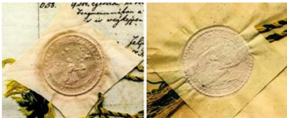
8. kép. Fejér vármegye pecsétjének lenyomata 1696-ból és 1838-ból.

adtuk és engedélyeztük kegyesen úgy, ahogy mindaz jelen levelünk élén, vagyis kezdetén a festő tanult kezével és művészetével természetimen kifejezve és megfestve látszik.” 88