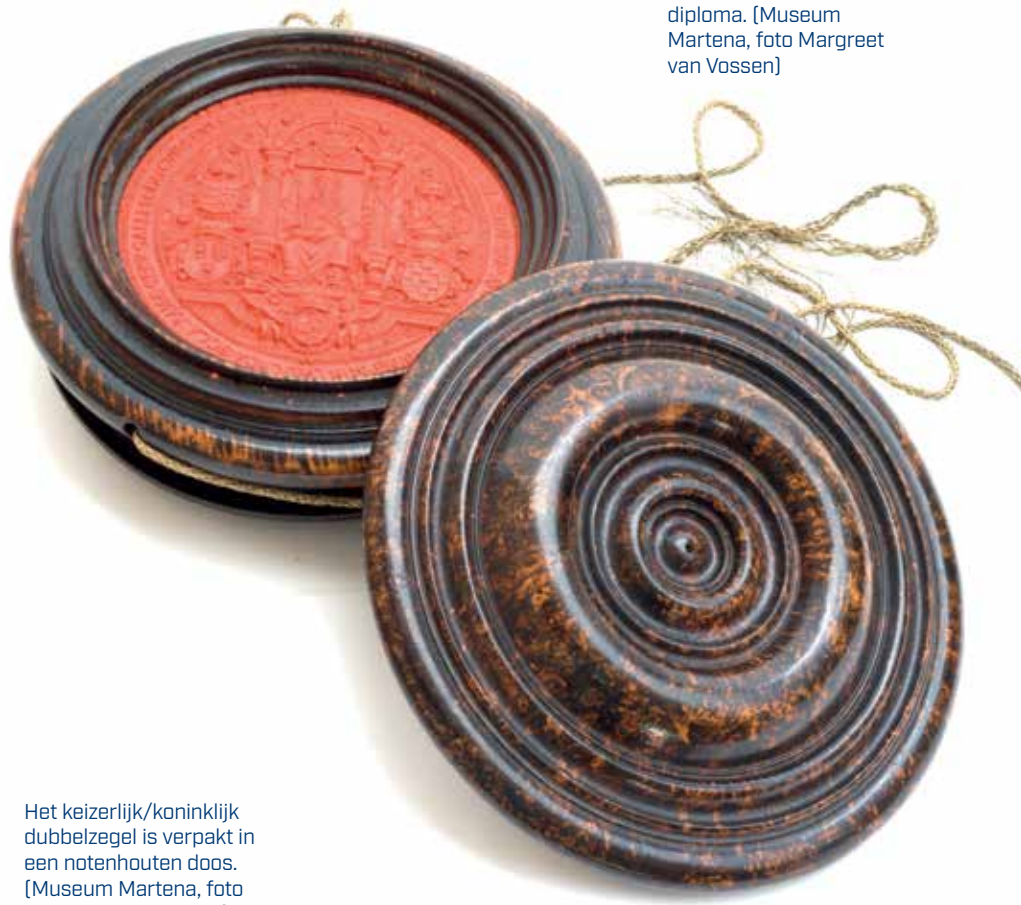
Het keizerlijk/koninklijk dubbelzegel is verpakt in een notenhouten doos.

In het Biographisch Woordenboek van Van der Aa uit 1862 wordt Van Ghemmenich beschreven als 'Een Friesch Advocaat, die de Latijnsche dichtkunst slechts zeer middelmatig beoefende [...]'. Deze vermeende middelmatigheid heeft de keizer van Oostenrijk er dus niet van weerhouden om Van Ghemmenich in de adelstand te verheffen. Ook het feit dat Van Ghemmenich protestant is en de keizer een notoire rooms-katholieke protestantenhater, is klaarblijkelijk geen beletsel. En net zo gemakkelijk zweert Van Ghemmenich op