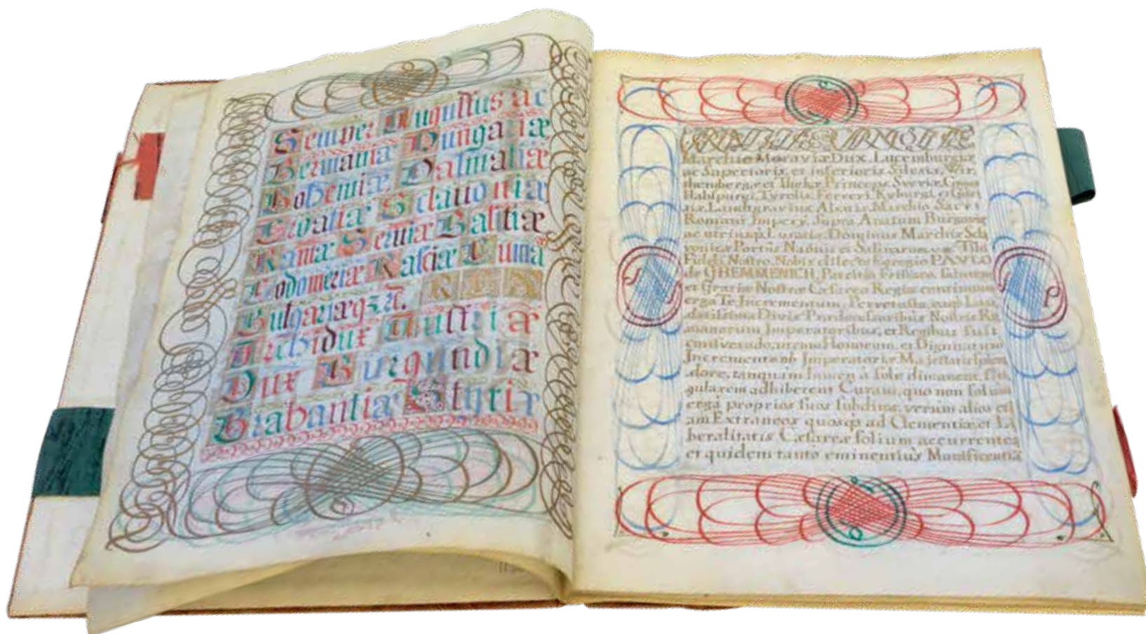
Het adelsdiploma bestaat uit twintig pagina's.