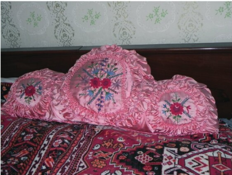
34–35. Halványrózsaszínű selyem díszpárnák (Drágszél és Bába)