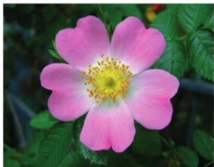
28. Rosa Canina .