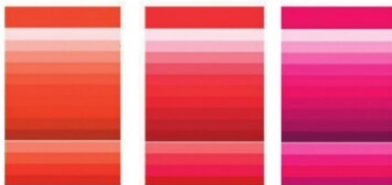
44. A szerző által szerkesztett színskála.