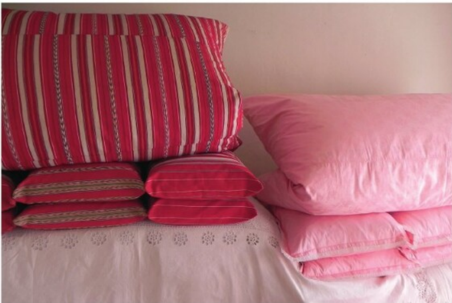
8. Kazár: Piros és rózsaszín ágyneműk (2010)