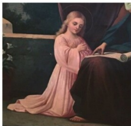
36–37. Ismeretlen festő a még gyermek Szűz Máriát rózsaszín ruhában ábrázoló festménye.