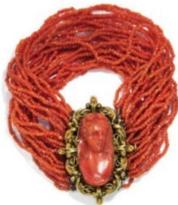
42. Egy György-korabeli korall-arany karperec.