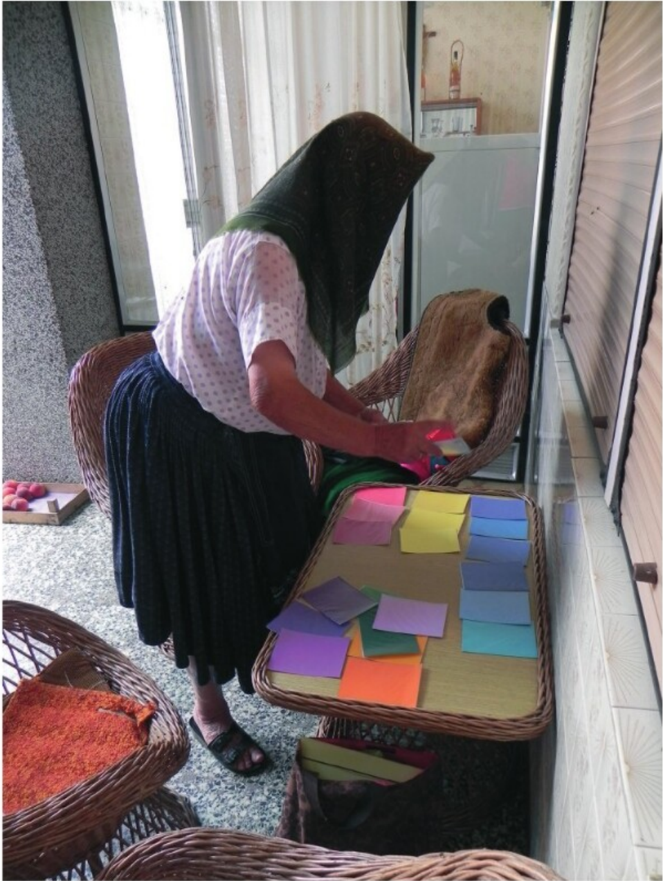
1. Színmintás gyűjtés (Kupuszina, 2010)