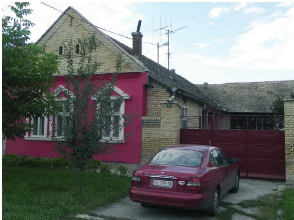
18. Kupuszina: Egy ház a Petőfi Sándor utcában (2010)