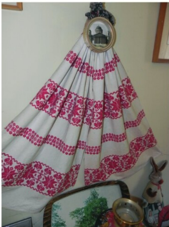
13. Bába: Lakásbelső (2011)