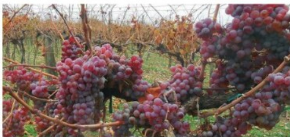
40. A kővidinka.