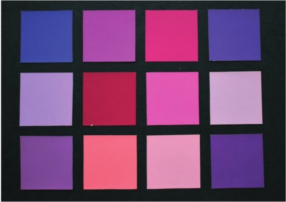
7. Fekete alapú rózsaszín-lila színtábla (ugyanazokkal a Munsell-mintákkal, mint amilyenek a fehéren szerepelnek)