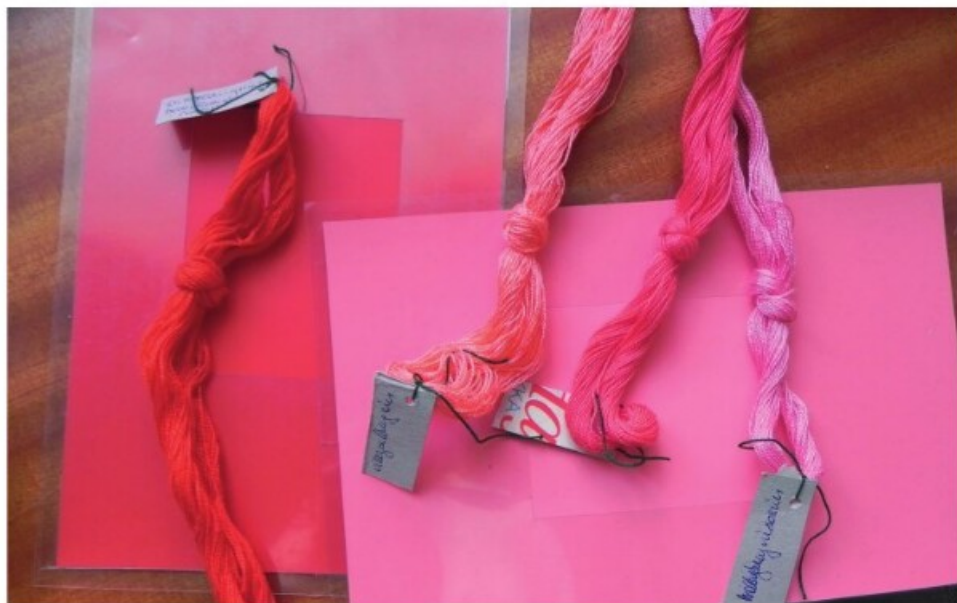
5. Színminták összehasonlítás közben (Kalocsa, 2011)