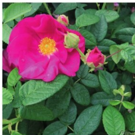
29. Rosa Gallica .