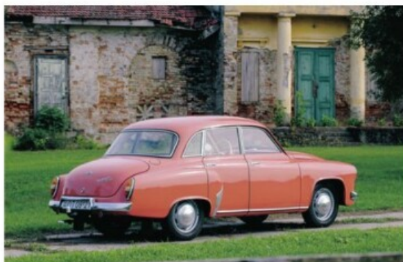
43. Egy 1963-ban gyártott korallszínű Wartburg 1000.