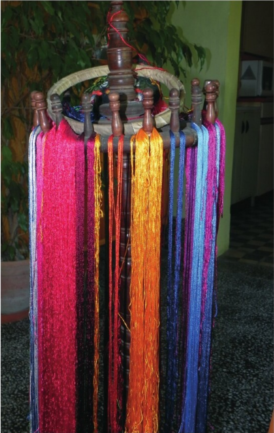
11. Mezőkövesd: Hímzőfonalak (2011)