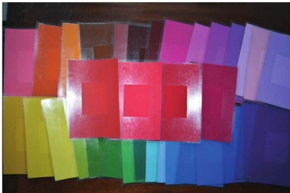
3. Munsell-színminták a színek megneveztetéséhez