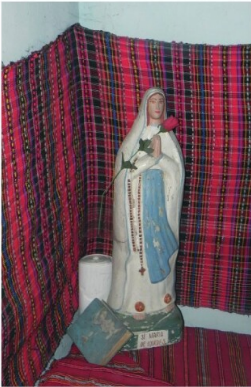
15. Klézse: Szentsarok (2011)