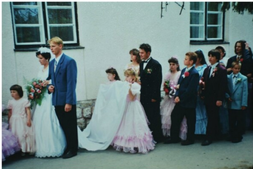
38. Nászmenet rózsaszín és világoskék öltözetű koszorúslányokkal (1990-es évek, Drávaszabolcs)