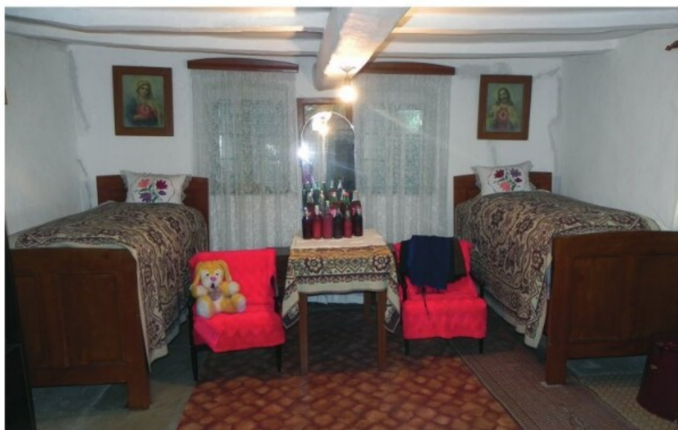
19. Kupuszina: Első szoba (2010)