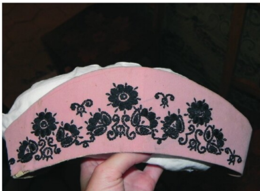
27. A bártai lányok „egyleti pártája”