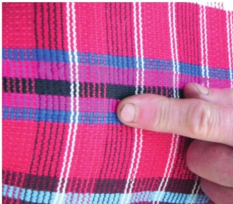
20. A klézsei ruzsinka