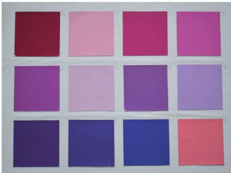
6. Fehér alapú rózsaszín-lila színtábla (Munsell-mintákkal)