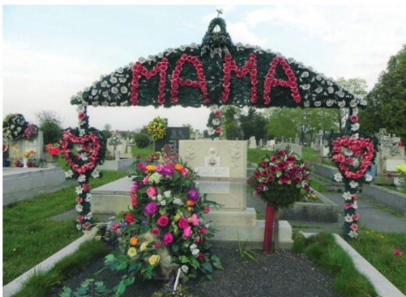
10. Kalocsa: Egy díszes sír a temetőből