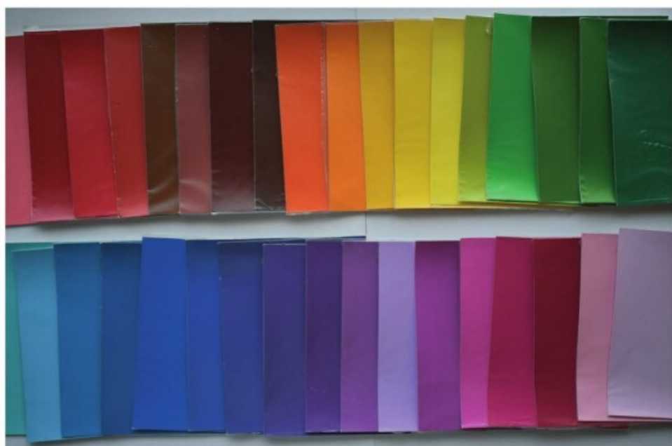
4. Munsell-színminták a színek szerinti csoportosításához