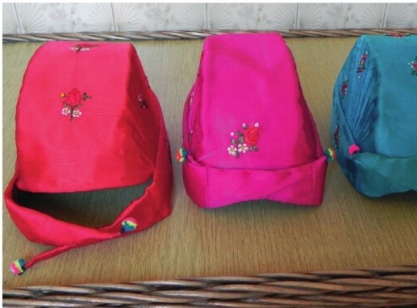
33. Egy piros és egy „borszínű” (anilines parasztrózsaszín) kupszínai fityula