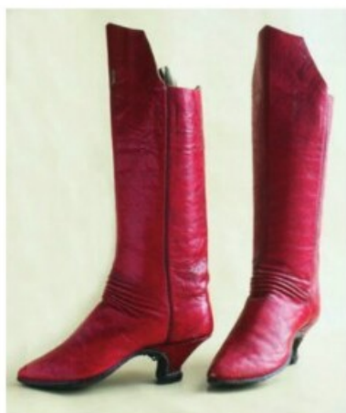
24–25. A „piros csizma”.