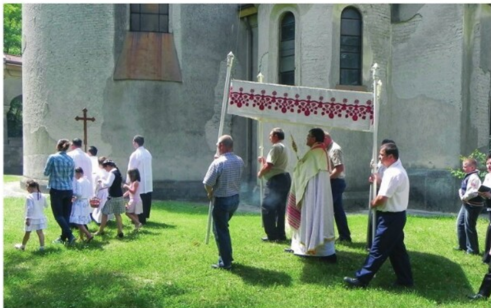
12. Bába: Körmenet (2011)