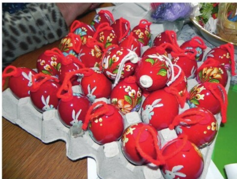
21. Egy szakmári asszony által készített húsvéti piros tojások (Terepmunka Kalocsán és a szállásokon, 2011)