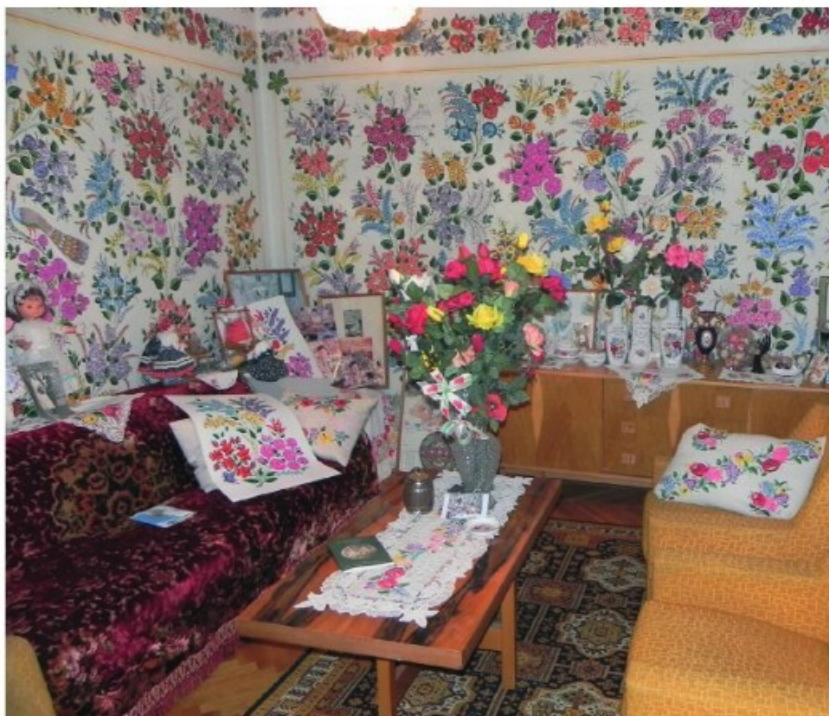
9. Kalocsa: Pingált falú szoba (2011)