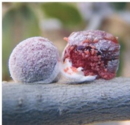
23. A gubacszerű kermesznőtényekből kikelő lárvák.