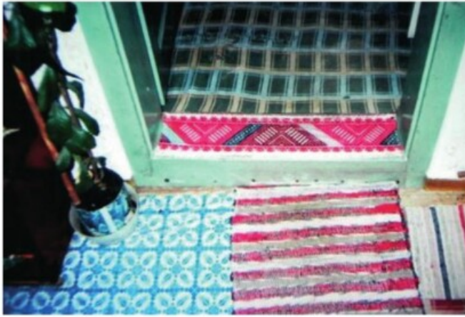
14. Gyimesközéplök: Szőttessel díszített küszöb (2006)