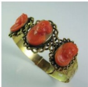
41. Egy 1840 körül készült korall-arany karkötő.