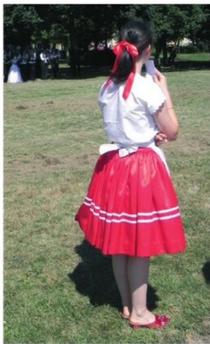
16–17. Szilágyi: Templombúcsú 2010. augusztus 20-án