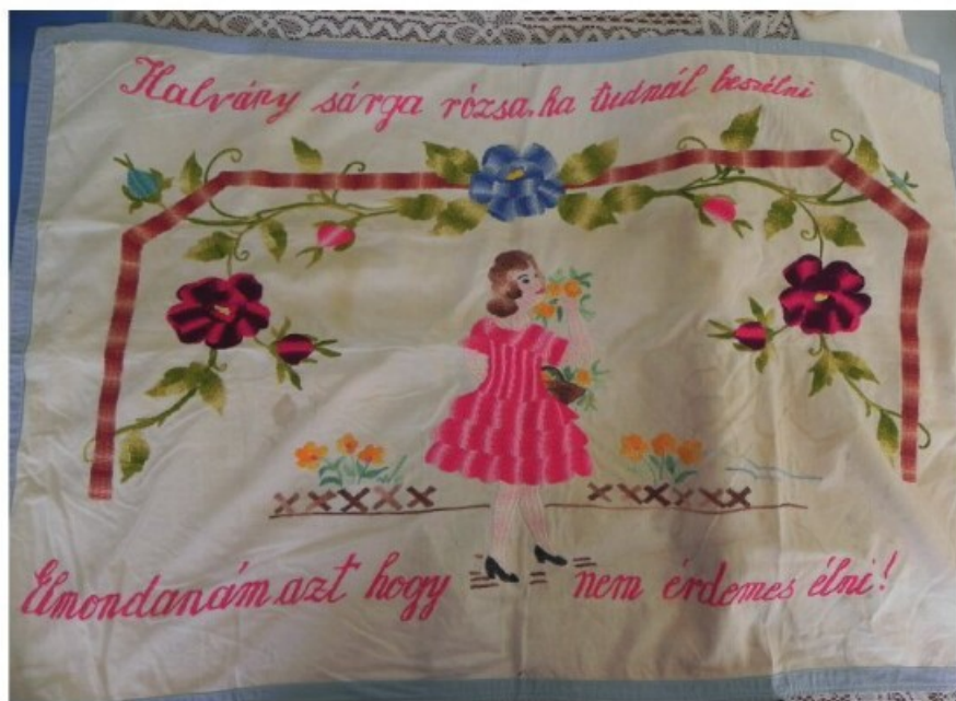
26. Egy kupuszinai falvédő