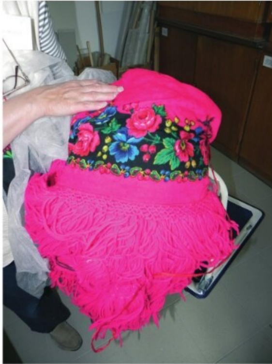
32. A matyó „tüdőszín”