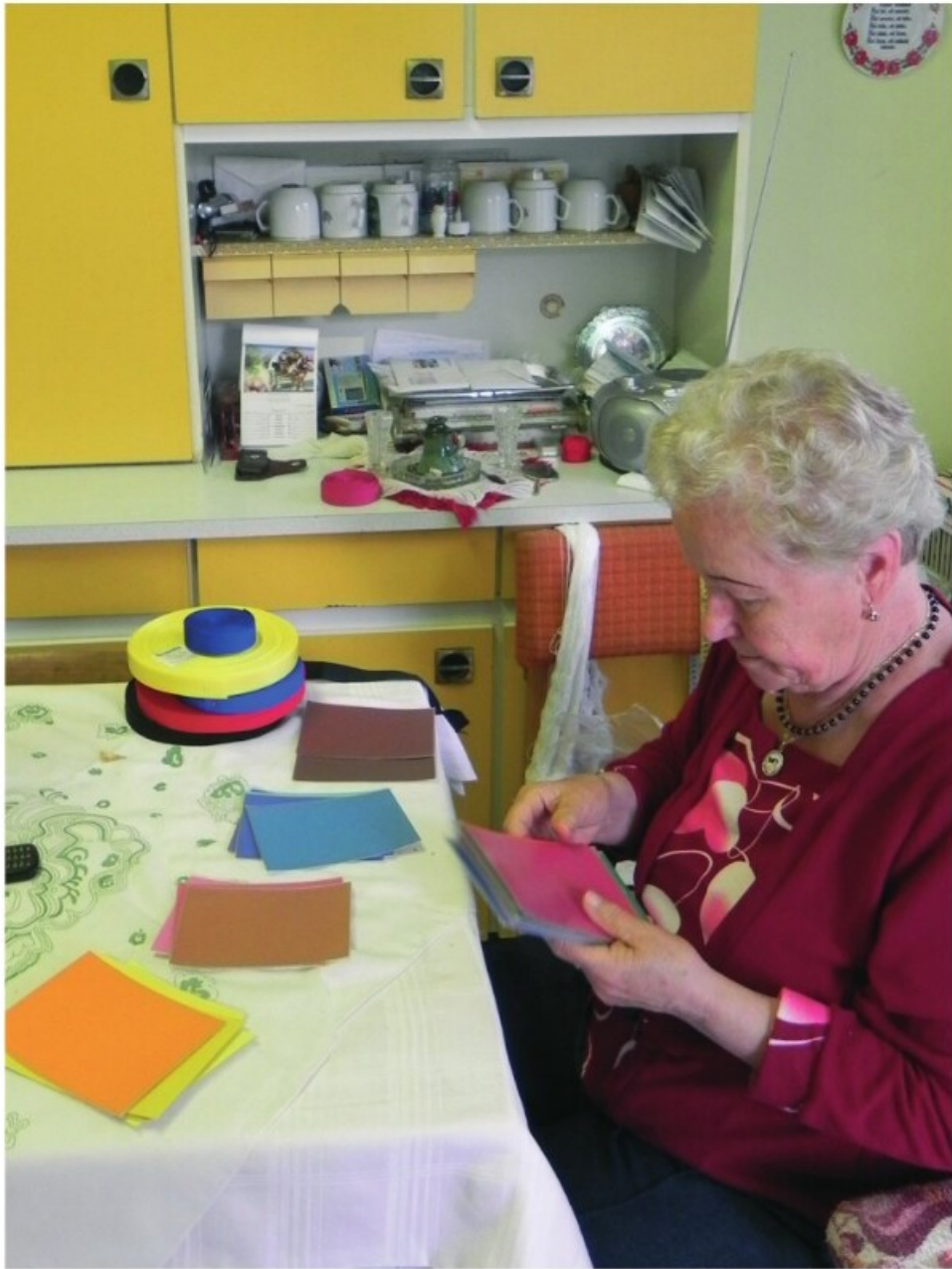
2. Munsell-színminták csoportosítása (Mezőkövesd, 2011)