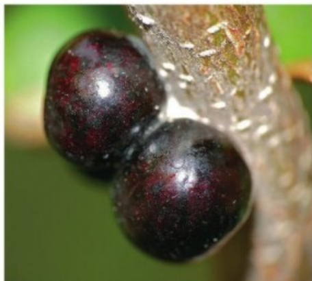
22. A bogyónak látszó kermesznőtények.