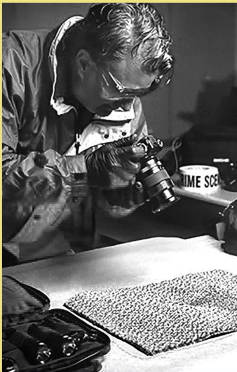
A bűnügyi fényképezés története

A biztosításfelügyelet története Magyarországon a 19. századtól a rendszerváltozásig