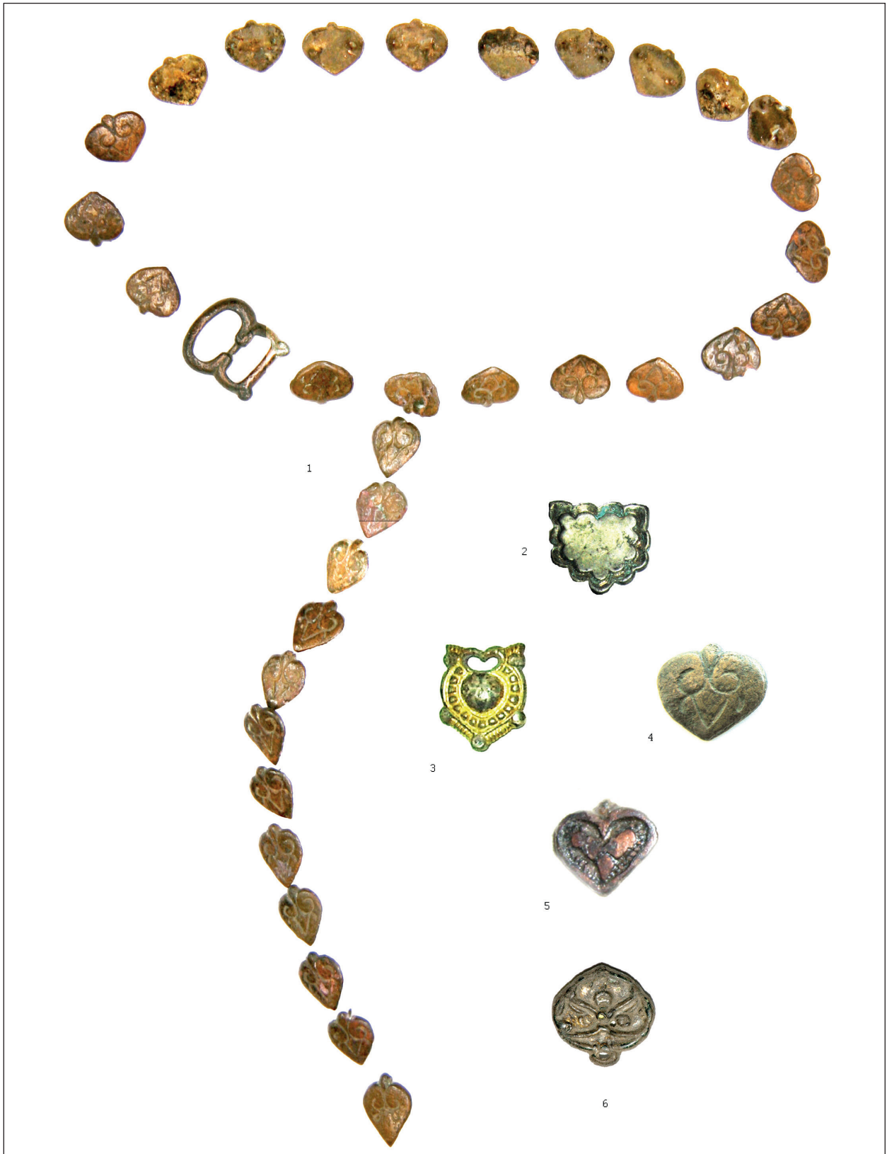
Рис. 1. Предположительная реконструкция поясного набора из Екимаяц (1) и поясные бляшки из Слободзеи (2), Старых Бэдражей (3), Екимаяц (4–5) и Тарасова (6). Масштаб разный

1. kép. Az echimăuți övkészlet elméleti rekonstrukciója (1) és övveretek Szlobodzejából (2), Sztarije Bedrazsiból (3), Echimăuțiből (4–5) és Tarasovából (6). A méretarányok eltérőek