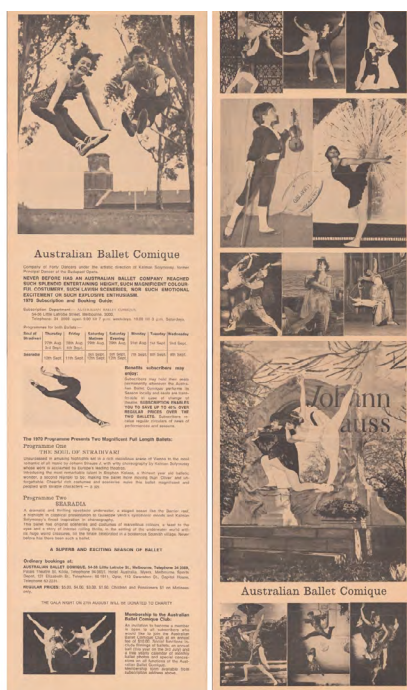
7. és 8. ábra: Az ausztrál Ballet Comique szeptember-októberi műsorfüzete 1970-ből. ([Australian Ballet Comique : Programok és kapcsolódó anyagok az Ausztrál Nemzeti Könyvtár gyűjteményében].)