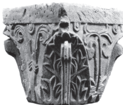
10. ábra. Karzattartó pillér Zalaszentgyörgyről. (Pannonia Regia I-80. 152. o.)