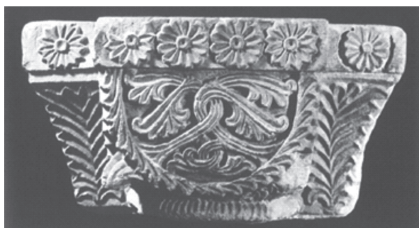
7. ábra. Pécs-Szt. Kereszt oltár akantuszos oszlopfője. (Kristó-Makk 46. ábra)