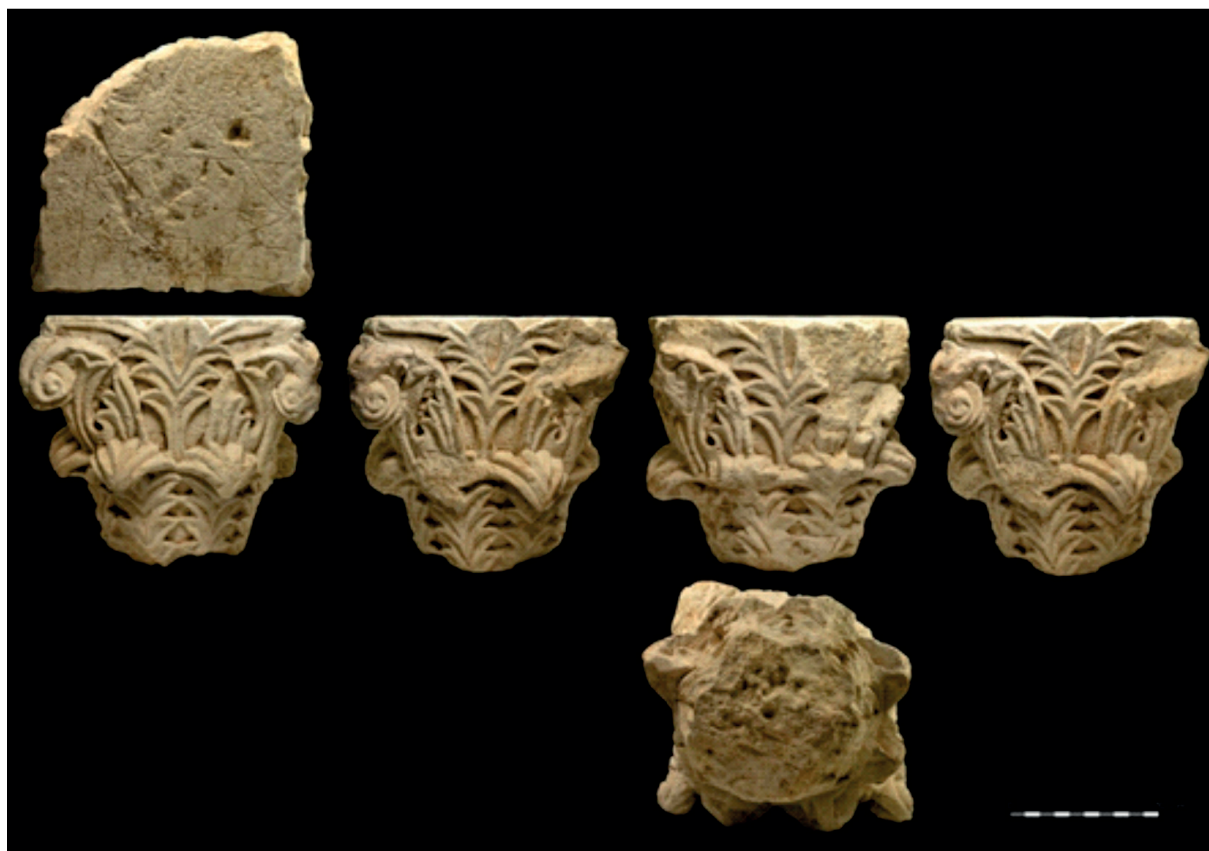
1. ábra. A berzencei oszlopfő felső, alsó és oldalnézetei

záncai herceg korában is, illetve anyja székesfehérvári preceptorium felé tett hitbérével kapcsolatban is. Míg a 12. század fordulóján a magyar perjelség nem alkotott külön nyelvet (a cseh nyelv részét alkotta), a 13. század közepétől megalakult a független Magyar-Szlavón perjelség. Ennek alapjait az Eufrozina által tett birtokadomány jelentette, így nem csoda a létrejövő tartománynak aránytalan dunántúli és szlavóniai elhelyezkedése. 7 A keresztések Magyarországon a zárándokok fogadása (ld. Székesfehérvár) és a betegápolás mellett hiteleshelyi tevékenységet is folytattak.