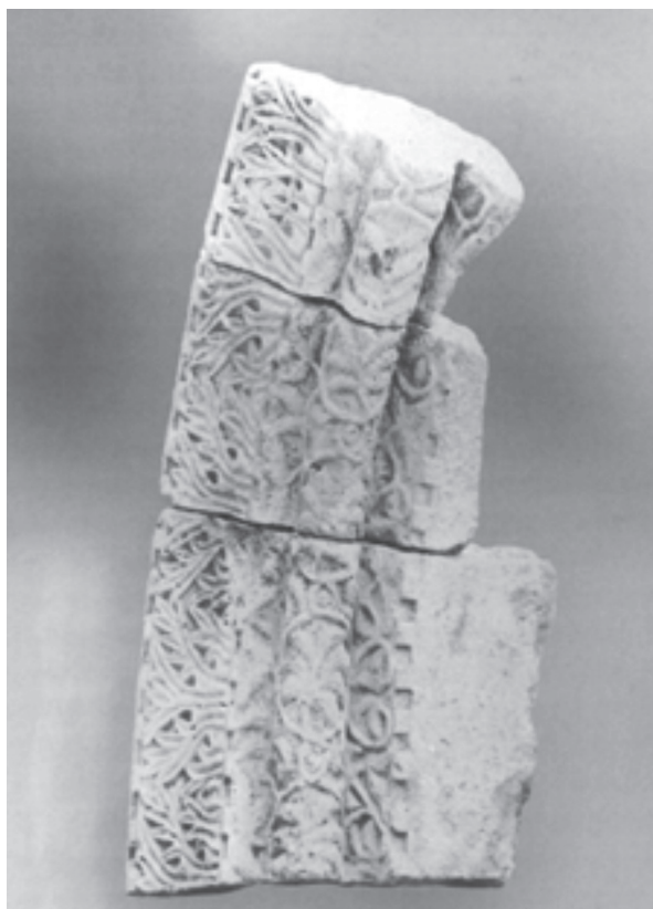
6. ábra. Íves székesfehérvári nyíláskeret töredéke szőlősleveles-akantuszos díszítéssel. (Mentényi 2015, 352. o., 45.)