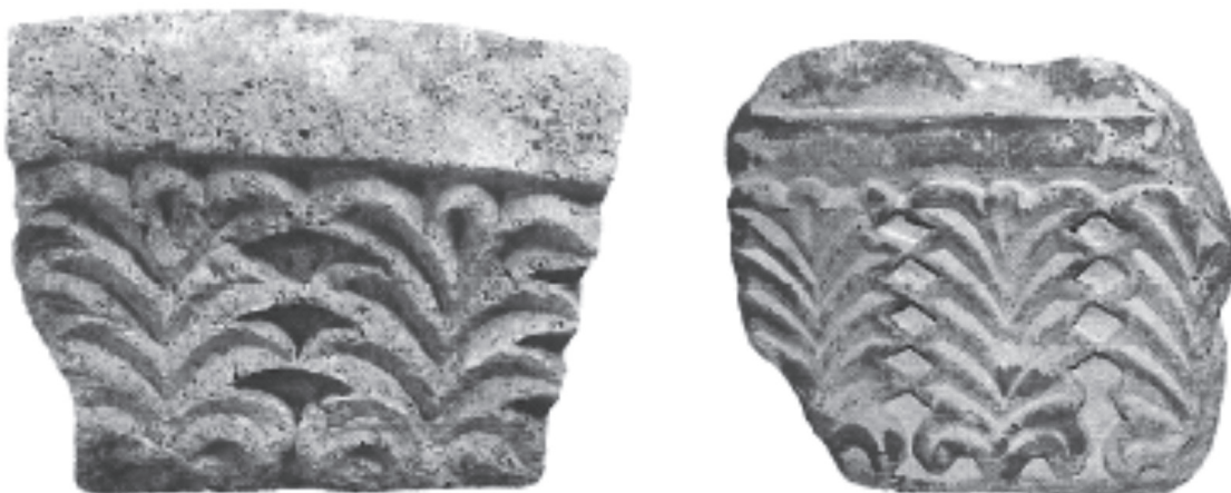
4. ábra. Íves töredék (Székesfehérvár) és vállpárkánytöredék (Pécs) összeérő ujjú levelekkel. (Mentényi 2019, 33 o., 36/a-b.)