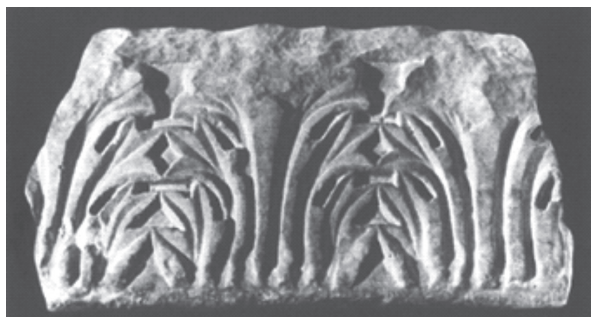
8. ábra. Esztergom-Szentkirályi Stefanita kolostor párkánytöredéke. (Kristó-Makk 1981. 58. ábra)