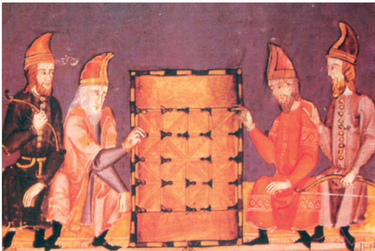
12. ábra. 13. századi alkerk ábrázolás Bölcs Alfonz kéziratából, a Libro de los juegos -ból. (Endrei-Zolnay 1986, XXVIII. kép)

faragványok II. Géza 1148-as vámadományához kapcsolódhattak, és az 1150-es években zajlott építkezések lenyomatai. 19 (9. ábra)