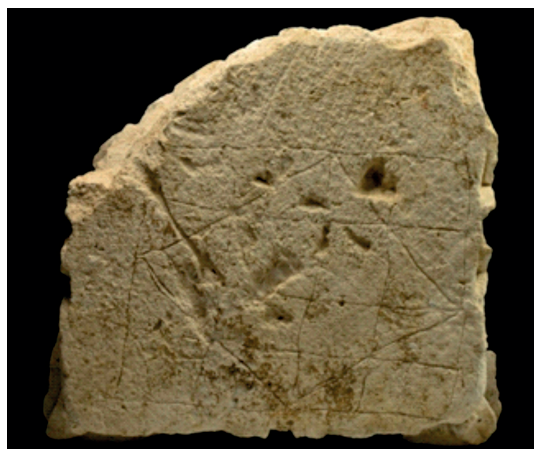
11. ábra. A berzencei kőbe karcolt vonalak