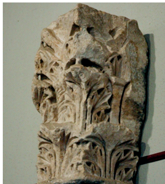
9. ábra. Akantuszos pillérfő az óbudai Szent Péter prépostság területéről. BTM (Budapest im Mittelalter 127) http://muvtor.btk.ppke.hu/romanika/DSC_2647.jpg