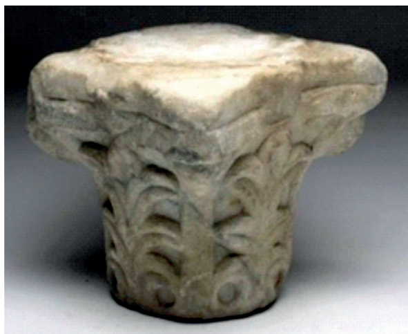
2. ábra. 12. századi bizánci oszlopfő