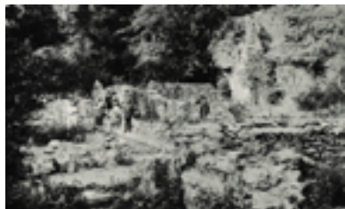
1. kép. A Boldogaszony-templom és rendház romjai, az 1920-as évek.