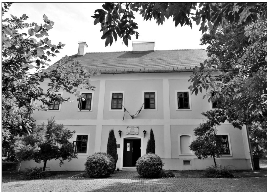
2. kép A söjtöri Deák-kúria, Deák Antal szülőháza napjainkban