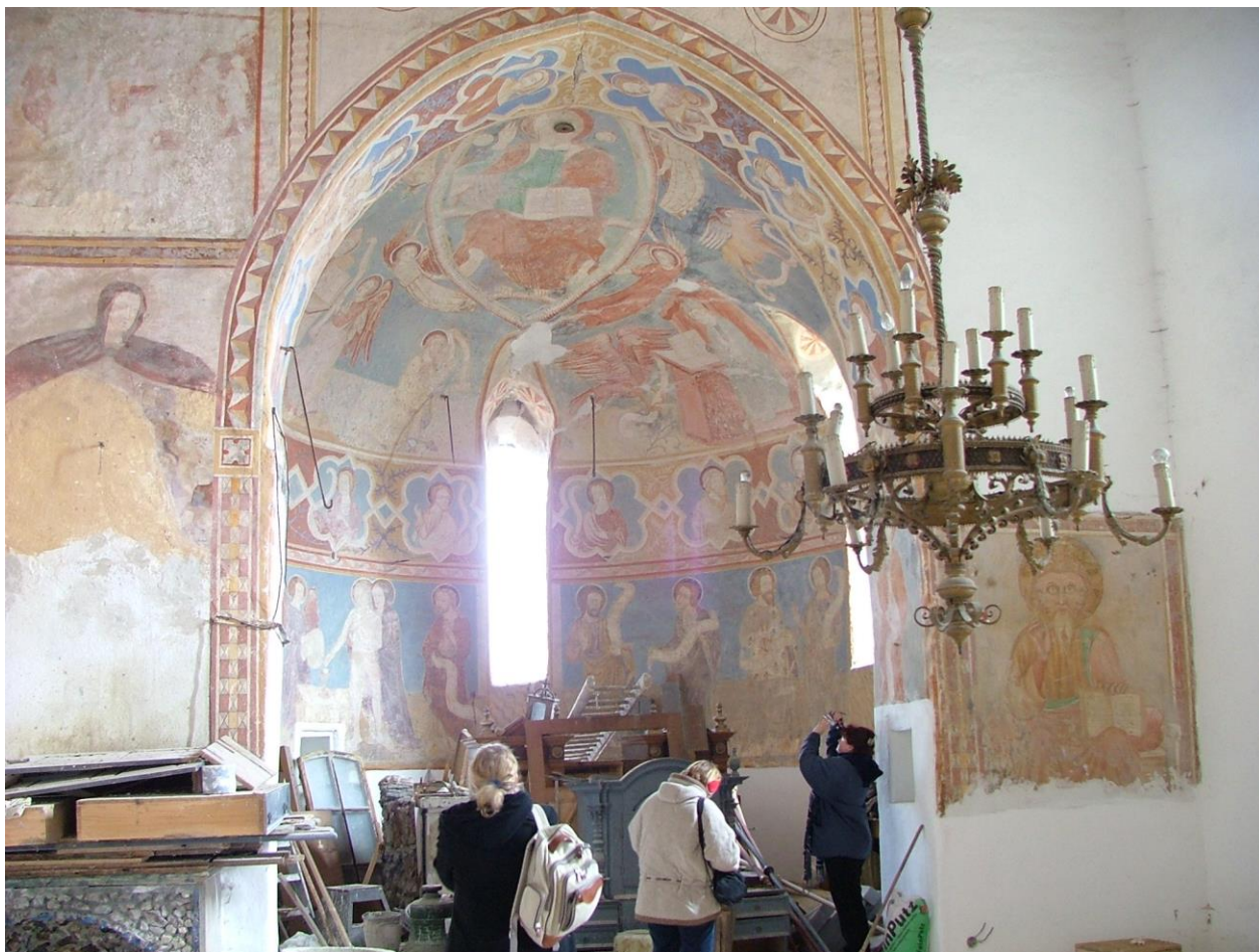
8. kép: Rákos, a szentély freskódíszje, 1360-as évek

Rákos község (Gömörrákos, Rákoš) Hiznyótól kissé délre, a Rákos-patak partján, Kövi vára közelében, a 13. századtól az Ákos nemzetségbeli Bebek család birtoka volt. A tatárok ellen 1241-ben tanúsított hősiességükért kapták IV. Béla királytól a Sajó felső folyásánál a hatalmas gömői birtokukat. A központjuk Pelsőc volt. Nagy Lajos király korában már országos méltóságokat viselt a család. Imre országbíró volt 1360–1369-ben. A fia, Imre horvát-dalmát bán, majd országbíró és erdélyi vajda volt. Bebek III. Detre Zsigmond király nádora volt 1397–1401 között. A fél kupolával fedett szentély egységes kifestése a fenséges Krisztus mennyei dicsőségének víziójával, a tudós teológiai program szerint az 1360-as években készülhetett (8. kép).