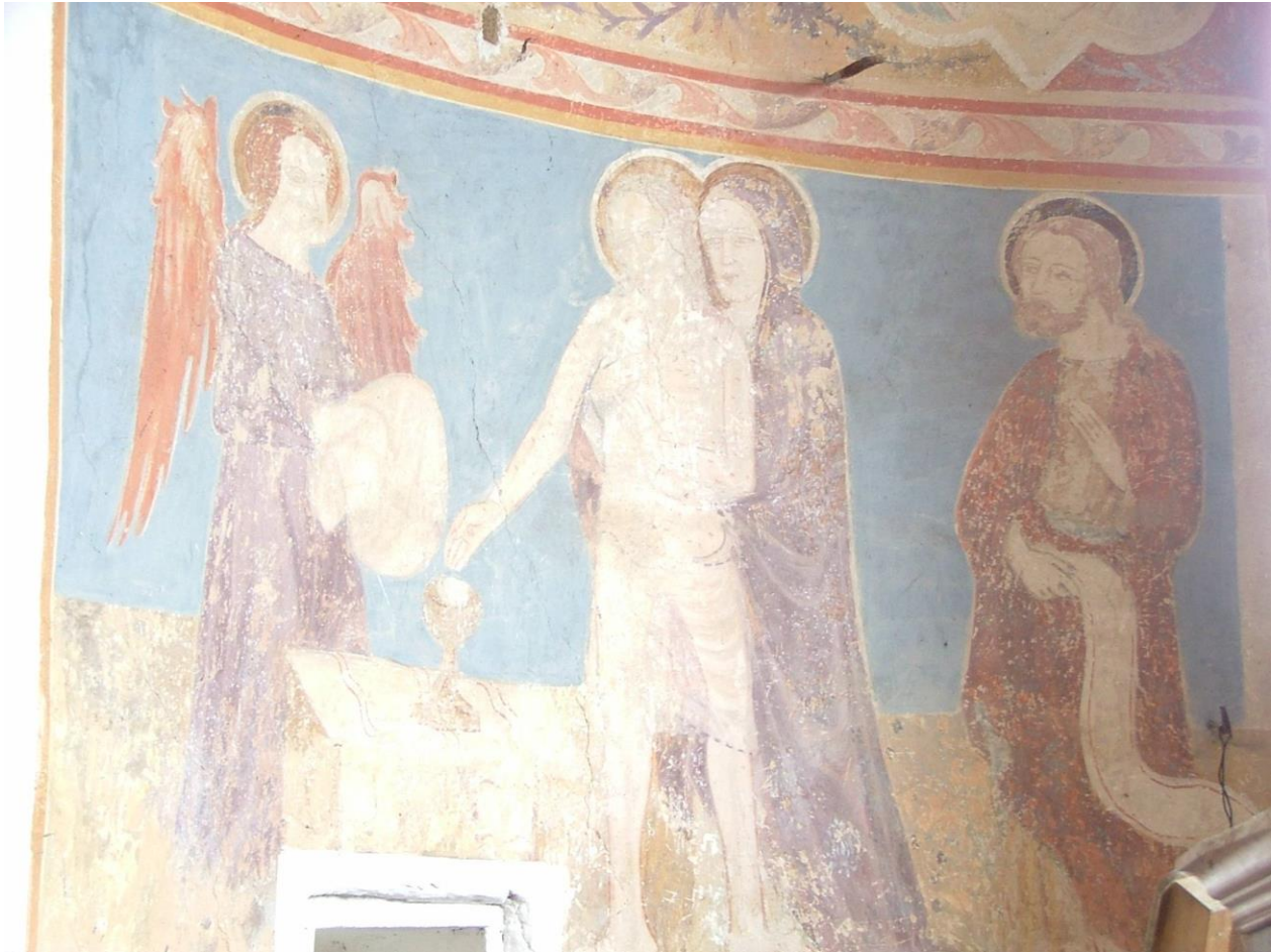
9. kép: Rákos, a szentély freskódíszje: az Eucharisztia ábrázolása a Fájdalmak Férfiát átölelő Fájdalmas Anyával (a 8. kép részlete)

jobb oldalán Szent János apostol tartja a mondatszalogot, amelyen eredetileg bizonyosan Jézus szavai voltak olvashatók, amelyekkel az Utolsó vacsorán megalapította az Eucharisziát, és elrendelte: „Ezt cselekedjétek az én emlékezetemre.”