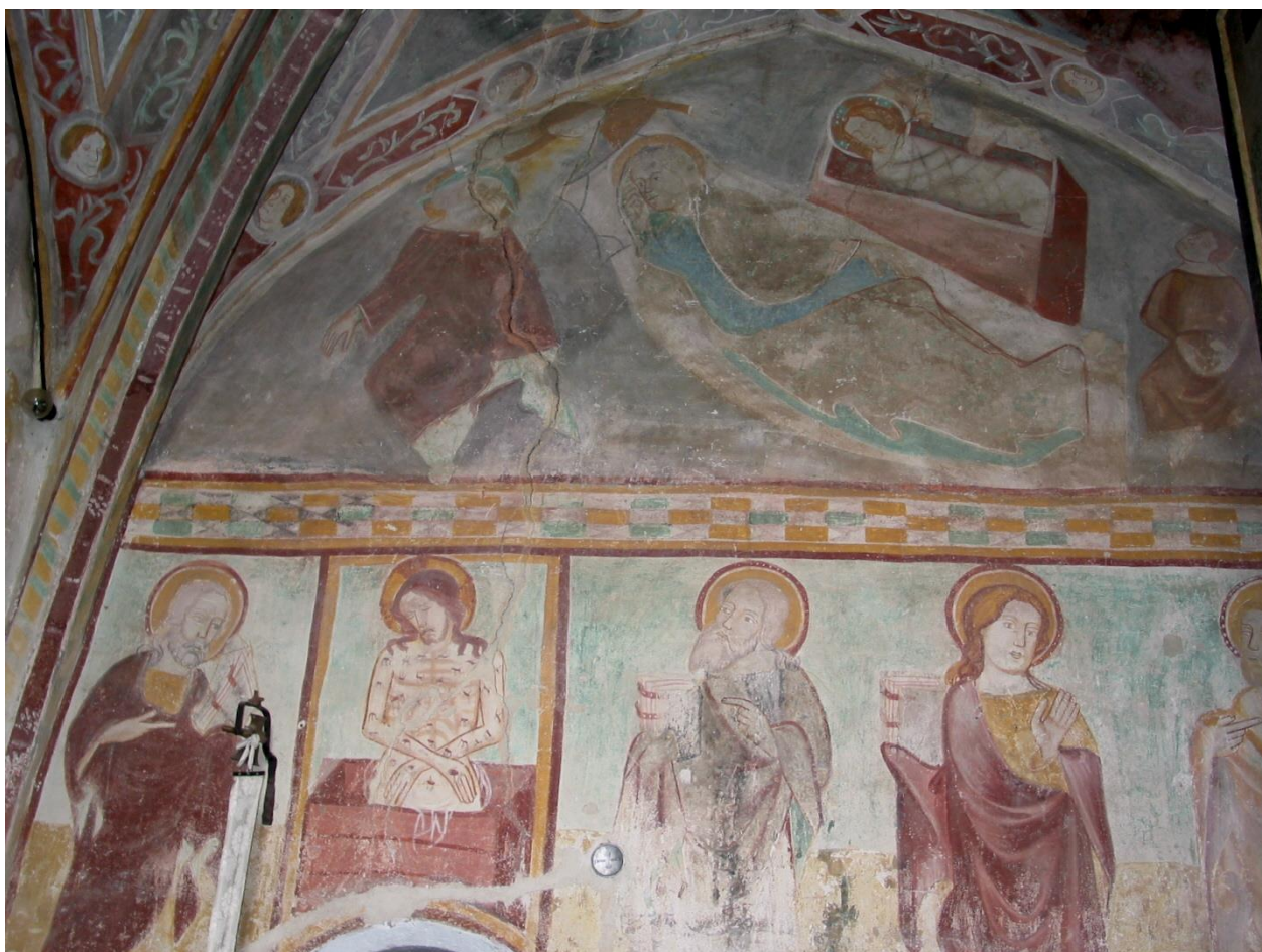
5. kép: Hiznyó, falkép a szentély északi falán, 1360-as évek

A hiznyói templom Istenanya-ábrázolásaira figyelve jól látjuk a nagy különbséget az 1400 körüli kora gótikus falkép és az 1508. évi késő gótikus-reneszánsz táblakép ábrázolása között. A falképdíszítés programjában a 12 apostol testülete áll, akik Jézus tanítását leírták, az embereknek továbbadták, amelyet az Egyház a Bibliában őriz. Felettük jelennek meg az emberiség megváltásának, vagyis Jézus, az Isten Fiának megtestesülését bemutató képek: a főhelyen, a keleti falon az Angyali üdvözlet , az északi falon Jézus születése és a déli falon a Három királyok imádása ábrázolást látjuk. Mindhárom freskóképen az Istenanya-ábrázolás a teljes elfogadást, az Istenre hagyatkozást jeleníti meg igen elvontan, a kora gótika szellemiségében (5. kép).