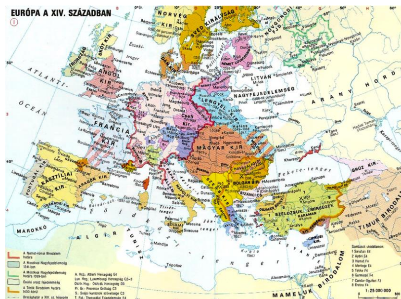
1.a kép: A Magyar Királyság helye Európán a 14. században