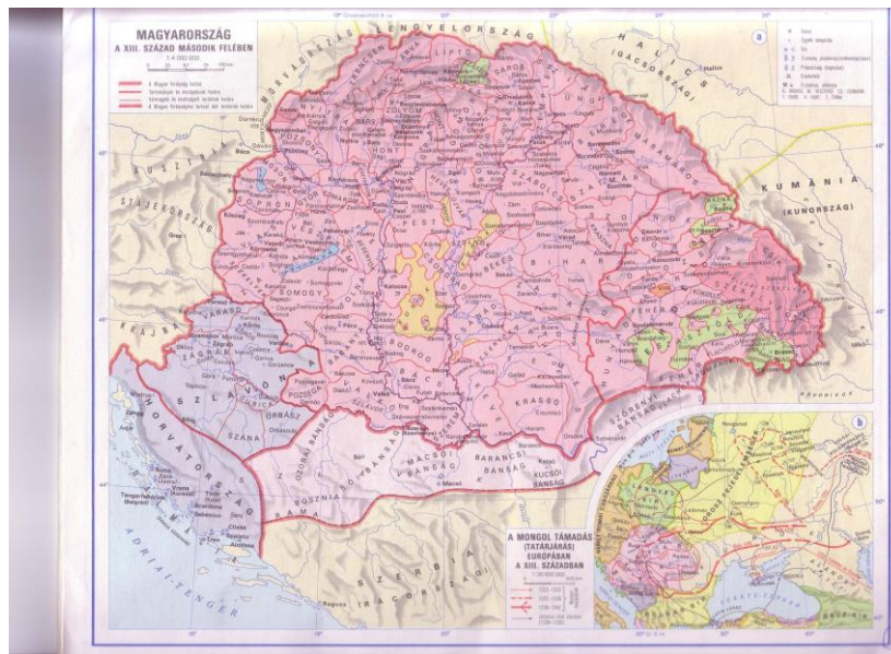
1. kép: A Magyar Királyság térképe a 13. század végén – 14. század elején

István király országa magába foglalta a Kárpát-medence egész területét (1. kép, 1.a kép).