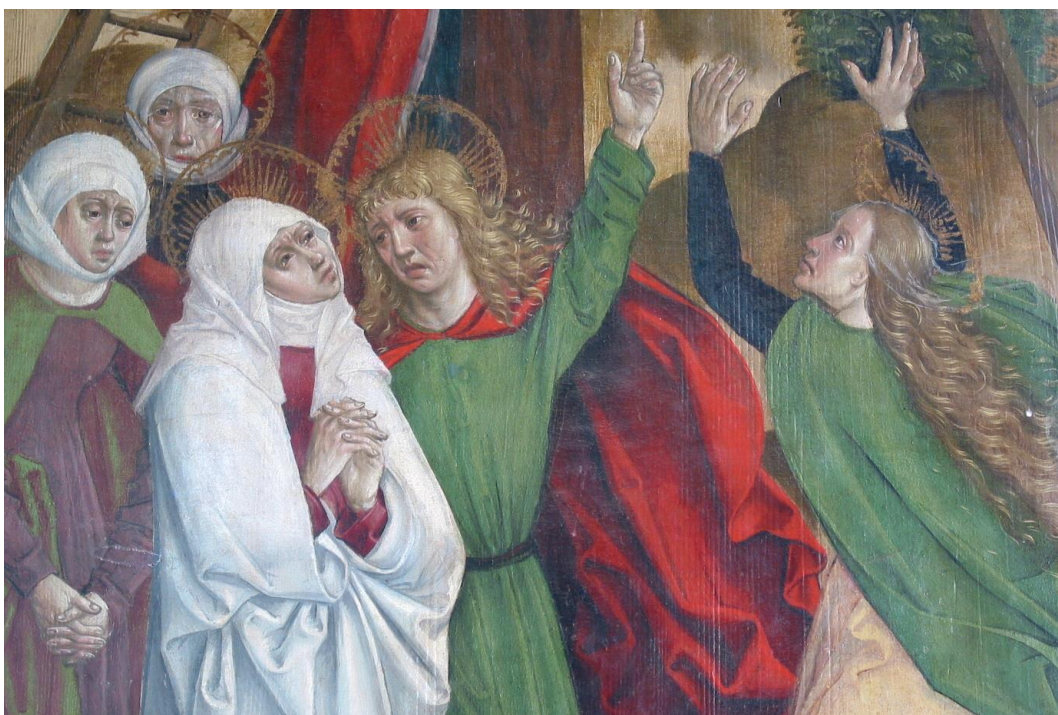
7. kép: Hizsnyó, a főoltár szárnyának külső képe: a Fájdalmas Anya (részlet a 4. képből)