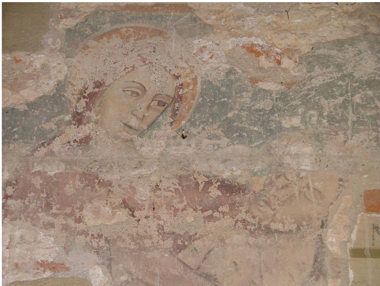
3. kép: Sűvete, Pietà, részlet, Istenanya, 1350 körül

1330-ban a községet is birtokló Zách Felicián követte el a merényletet Anjou I. Károly királyunk ellen Visegrádon, a királyi palotában, Klára lányát ért sérelem megbosszulásáért. Ezután őt kivégezték, és birtokait elkobozták. Sűvete új birtokosa a királyhoz hű Rátold nemzetségbeli Jolsvai család lett, Lóránt nádor fiai. Ők a 14. század közepén a nagy fesztávolságú templom boltozatát csúcsíves diadalívvel megerősítették, és teljesen újrafestették a templomot az új, az Anjou I. Károly király által is támogatott itáliai trecento stílus szellemében. Ebből a freskóegyüttesből mutatjuk be az egyik fennmaradt Mária-ábrázolást (3. kép).