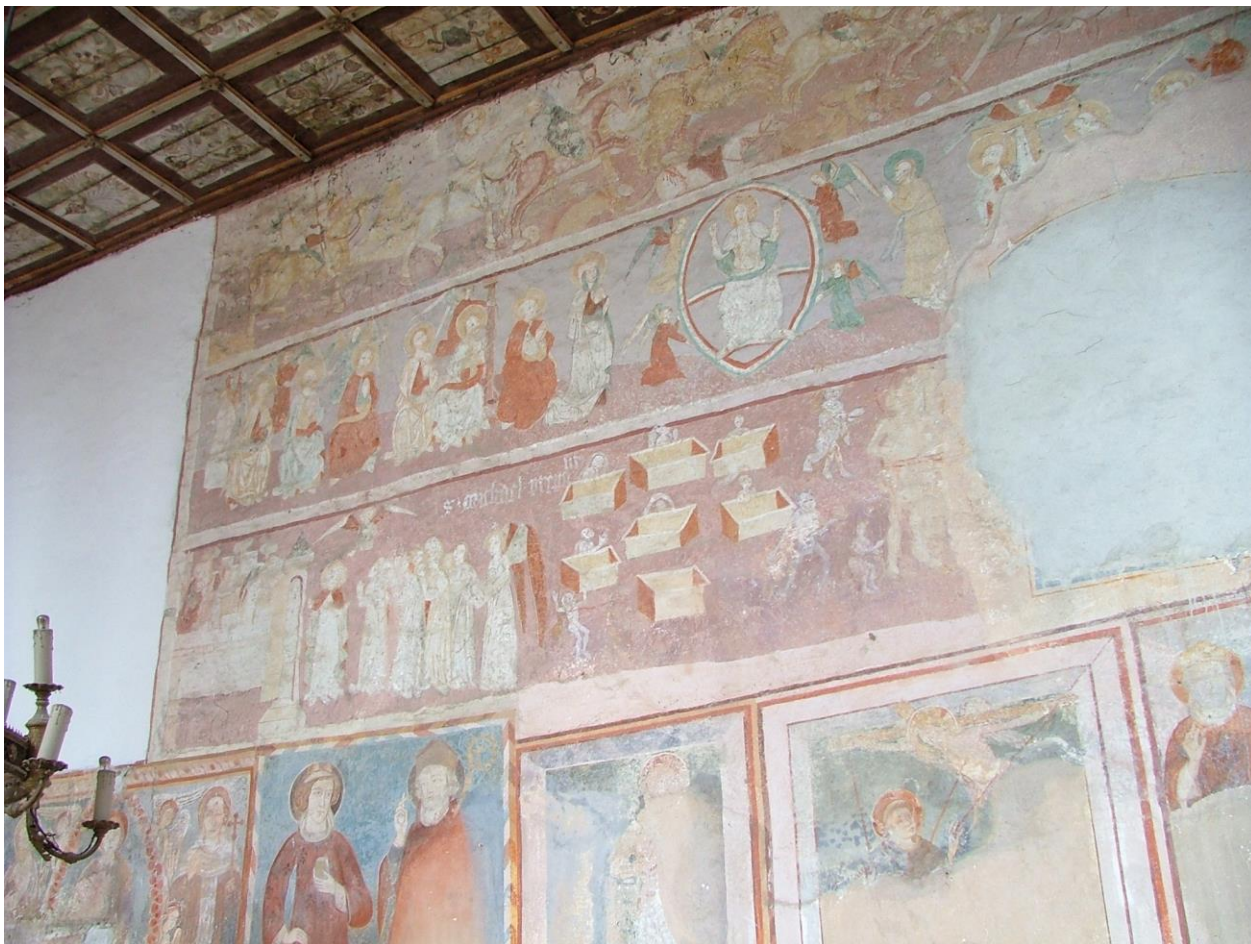
10. kép: Rákos, a hajó északi falán az Utolsó ítélet, 1400 körül