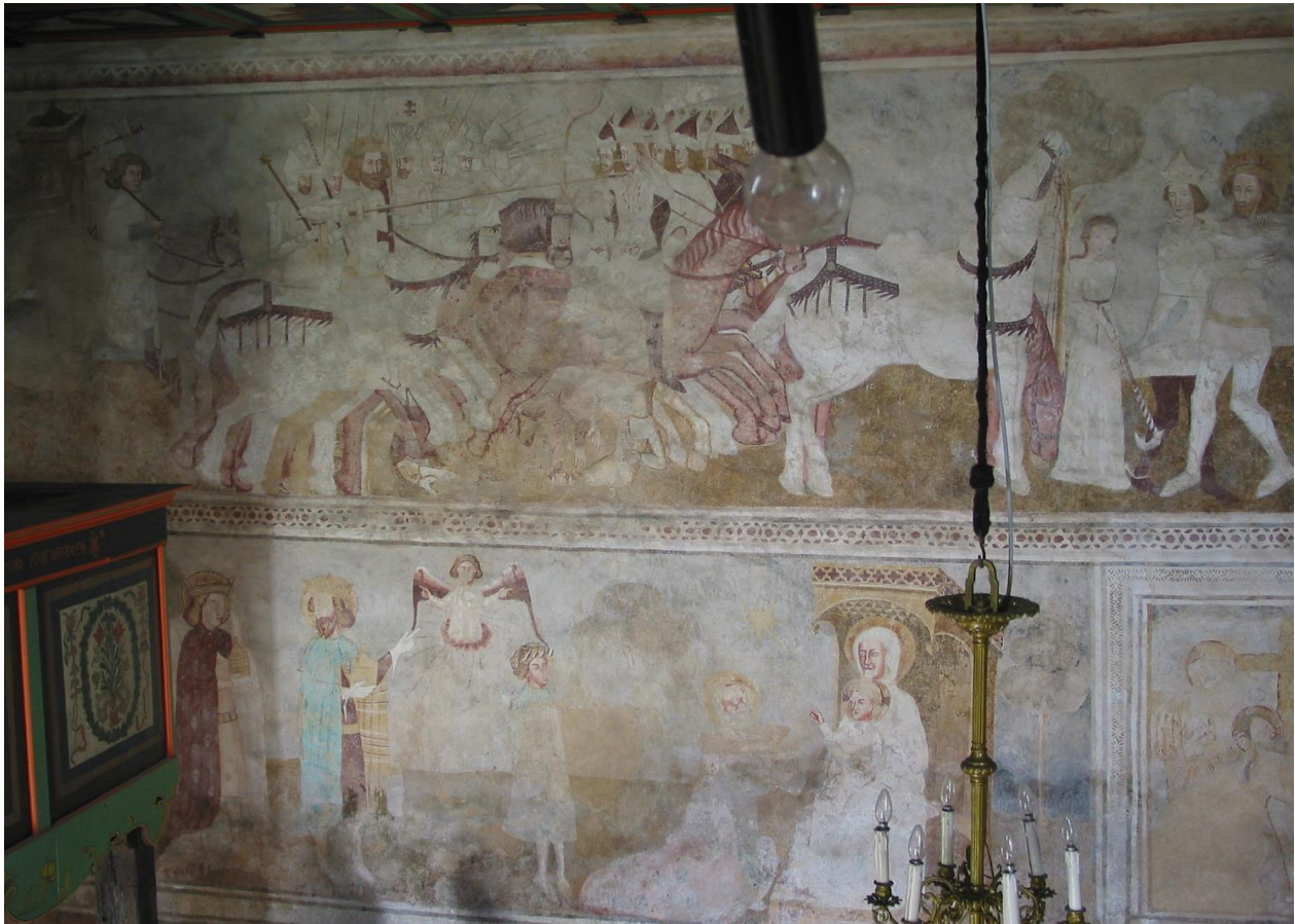
14. kép: Karaszko, az északi hajófalán fent: Szent László és a kun vezér seregének összecsapása, lent: Királyok imádása, részlet 1380-as évek

Karaszkon a templomhajó északi falán a Szent László legenda alatti sávban a Királyok imádása jelenetben figyelhetünk fel az Istenanya fenséges Matrónaként való ábrázolására (14. kép). A Napkeletről érkező, hosszú utat megtett előkelő uralkodók Istennek szóló ajándékokat adnak át a Szent Szűznek, aki az ölében tartja Isteni gyermekét. A művész itt nagy tehetséggel jeleníti meg az Istennek anyját, aki hivatásának teljes tudatában, alázatosan tartja a királyok elé az Istennek Fiát. Ez az ő feladata, felmutatni az Istent, az emberré lett Isten Fiát az embereknek. Ő a Bölcsesség széke, aki segíti az emberiséget az Isten, a legfőbb Jó, Igaz és Szép, vagyis az igazi Bölcsesség megismerésére.