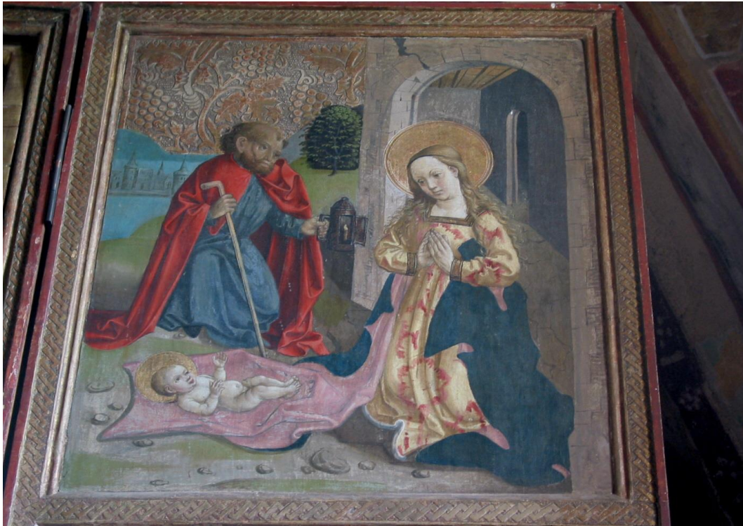
6. kép: Hizsnyó, a főoltár szárnyának belső képe, Jézus születése (részlet a 4. képből)

tanítványa, János apostol nagy részvétellel átöleli, és baljával lendületesen felfelé mutat, Jézusra. János zöld ruhája erőteljesen jelzi, hogy hiszi, amit Jézus a földi életében nekik többször is megmondott, hogy a halálból fel fog támadni!