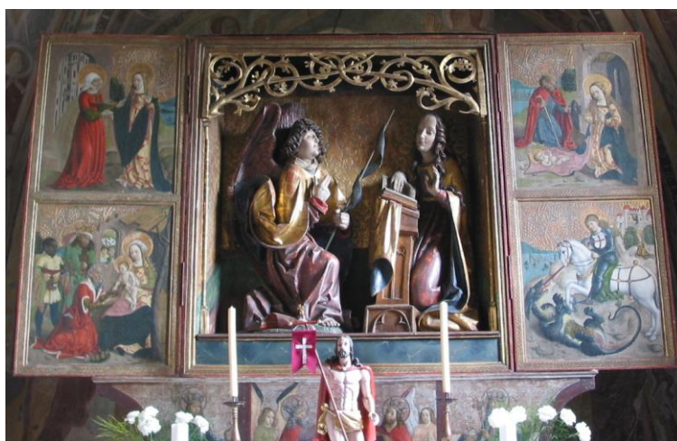
4. kép: Hizsnyó (Chyzné), szárnyas-oltár, Lőcsei Pál, 1508

A közeli Hizsnyó község (Chyzné) – a Murányi vár közelében – ugyancsak Jolsvai György tárnokmester , a királyi kúria tagjának művészeti pártolását élvezte a 14. századtól egészen a Mohácsi vészig. Hizsnyó középkori, 13. századi egyenes záródású szentélye a 1400-as évek elején kaphatta a ma is látható, a szentély teljes falfelületét beborító, magas teológiai műveltséget tanúsító, egységes program szerinti kifestését. S mivel a kezdetektől mindmáig a templom a római katolikus egyházé, így sosem lett bemeszelve. A 16. század elején állították a középkori oltárasztalra a ma is látható szárnyas-oltárt, amely a szepességi jeles szobrász, Lőcsei Pál mester műhelyében 1508-ban készült (4. kép).