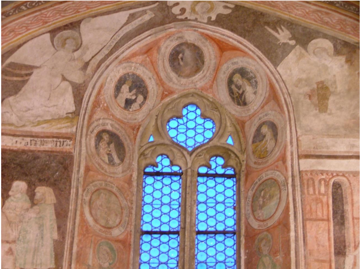
11. kép: Csetnek (Štítňik), a déli fal első szakaszán: Angyali üdvözlés és a Hét szabad művészet, 15. század eleje

jelenítését látjuk: a fodros felhőkkel övezett Atya Istentől sugárzóan repes a Szentlélek Galamb alakban az alázatosan térdelő Mária felé, aki éppen kimondta az angyal kérdésére az Igent.