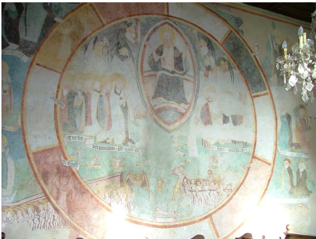
15. kép: Kiete (Kyjatice), a hajó északi falán: Utolsó ítélet, 1426