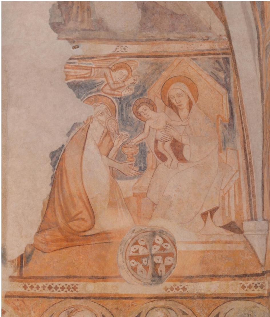
17. kép: Rimabrézó (Rimavské Brezovo), a szentély keleti falán a Napkeleti bölcsek hódolata, 14. század vége

A művész nagy rajzi felkészültséggel és anatómiai ismeretek birtokában jelenítette meg a halott Krisztus együttérzésre készítő siratását. Minden valószínűség szerint a budai királyi udvarból érkezhetett a festő. A kompozíció rokon a fiatal Michelangelo korai, vatikáni Pietájával. Jóllehet, itt az Istenanya alakja erőteljesebb. Az anya szélesre tárt ölébe süppedve, derékban meghajolva elhelyezett halott férfitest, a 15. század reneszánsz festészetében új kompozíciós megoldás a Pieta -ábrázolásokon. Korábban a halott test merevségét jelezve, vízszintesen ábrázolták a halott Krisztust Mária ölén.