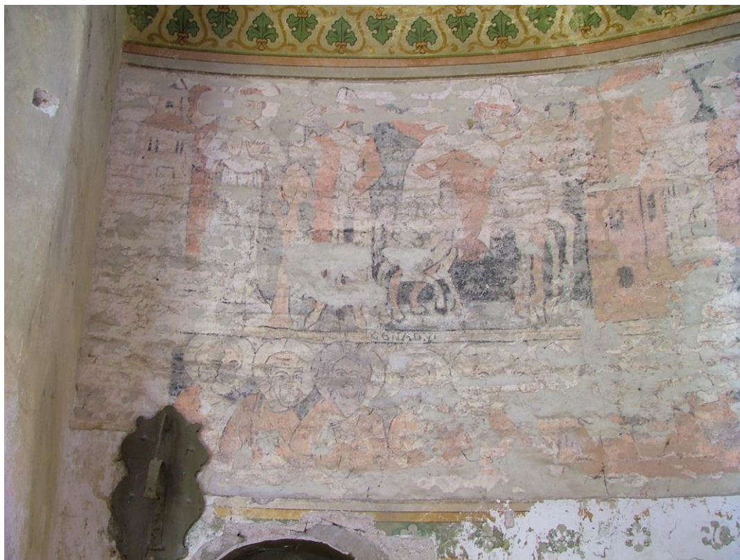
2. kép: Süvete (Šivetice), szentély, Antiochiai Szent Margit vértanúsága, 13. század (Fotó: Méry Gábor)