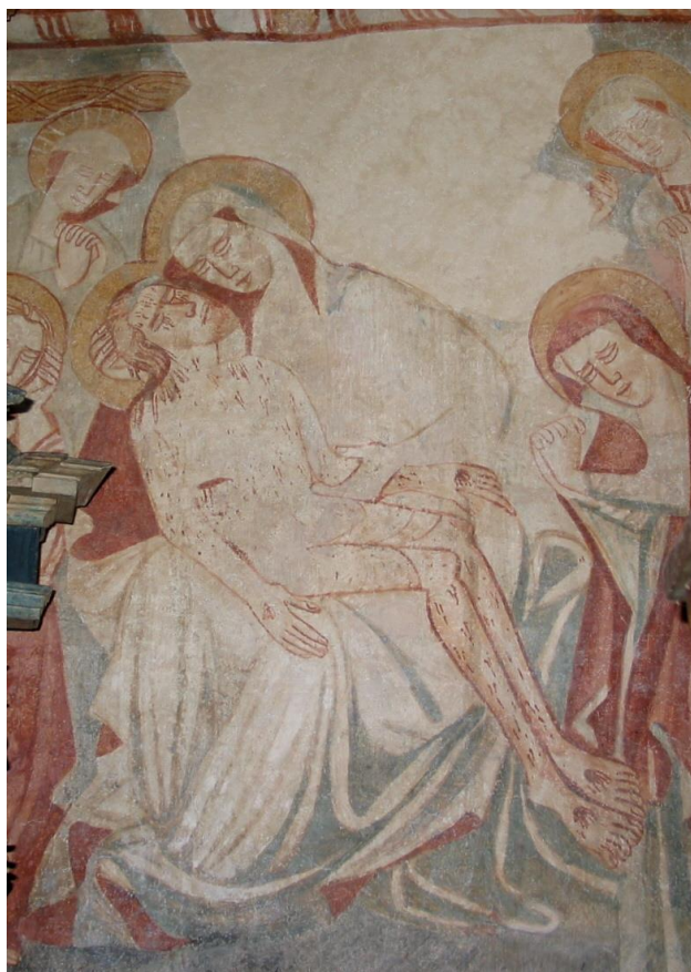
16. kép: Kiete, Pieta, 1460-as évek