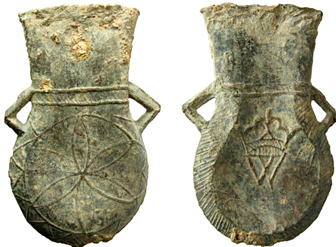
9. kép. Walsinghami ampulla, Winchester Museums, WINCM: VR72 S3442

A középkori magyar zarándoklatokról a 13–14. századtól egyre több forrás van, bár az is csekélynek mondható. Az Árpád-korból fennmaradt adatok alapján alig egy tucat Jeruzsálem, Róma