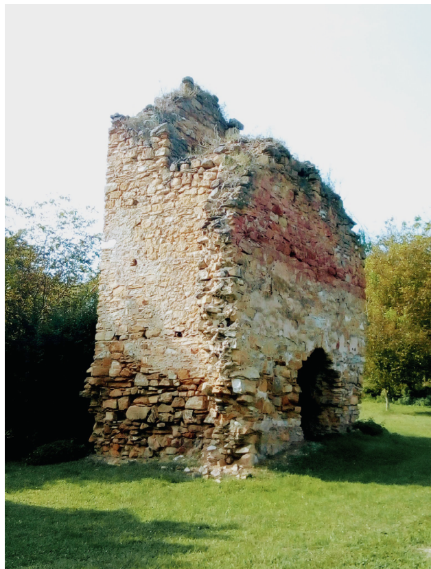
6. kép. Az eszterpusztai középkori templomrom

Az első zarándoklatok közvetlenül Krisztus halála megkezdődtek Jeruzsálemben és életének meghatározó helyszíneihez, Péter és Pál apostol halála után Rómába, majd a mártírok sírjaihoz, főként I. (Nagy) Constantinus császár (306–337) 313-as milánói ediktumát és az 325-ben összehívott niceai zsinatát követően. A hívők felkeresték azokat az ó- és újszövetségi helyszíneket, amelyeket a Biblia