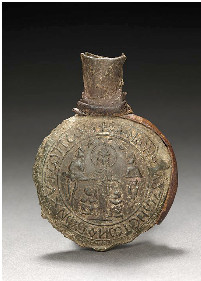
8. kép. Monzai ampulla, Cleveland Museum of Art, 1999.46.a

Ehhez az időszakhoz sorolható egy Acre kikötővárosában feltárt 12. századi műhely, mely több díszes zarándokampullát, hat darab öntőformát, egy félig kész ampullát és megmunkálatlan ólomdarabokat tartalmazott. Acre 1187-ben, Jeruzsálem eleste után vált a régió meghatározó zarándokhelyévé. A hívők ide érkeztek Európából és utaztak tovább Jeruzsálem, Szíria, Galilea vagy egyéb szent helyek felé. 17 Emellett vannak a Kelet-Mediterráneum vidékére utaló ampullák is, melyeken azonosítható ikonográfiai jegyek vagy feliratok vannak: Názáret, Sergiopolis, Konstantinápoly stb.