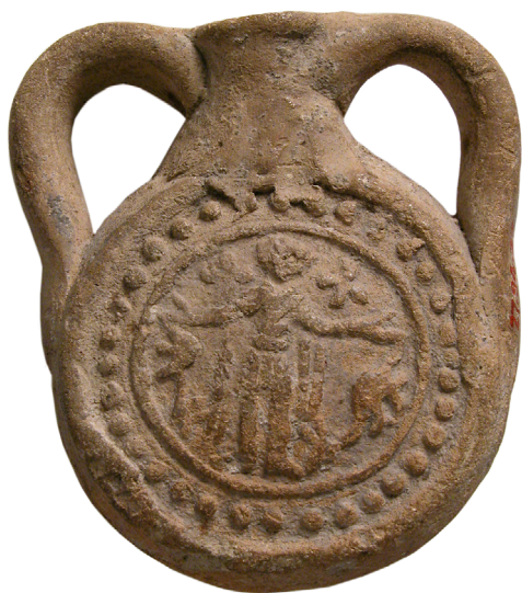
7. kép. Menasi ampulla, MET Museum, 27.94.27

Az egyik legjelentősebb kora középkori ampullagyűjtemény a monzai székesegyházban (Museo e Tesoro del Duomo in Monza) található, melyet a hagyomány szerint Theodelinda langobard királynő kapott Jeruzsálemből I. Gergely pápa ajándékaként. Ezek az 5–7. század között készültek és a korai keresztény ikonográfiai és művészettörténeti kutatás számára felbecsülhetetlenek, hisz a Szentföld, az ott levő épületek és események igen korai ábrázolásait hordozzák: Szent Sír, keresztre feszítés,