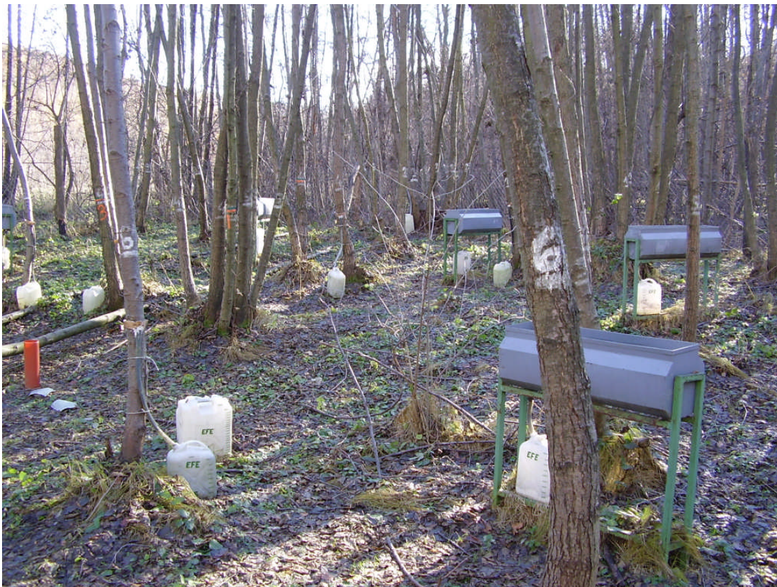
2. ábra. Égeres állományban létesített mérőkert

A kertben a talajvíz és az erdőállomány kapcsolatának vizsgálatára megfelelő geometriában elhelyezett 5 talajvízkútból álló kútcsoportot létesítettünk, amely napi észlelésű. A kútcsoport középső kútját jelen OTKA kutatás keretében beszerzett automata vízszint és hőmérséklet-érzékelővel szereltük fel.