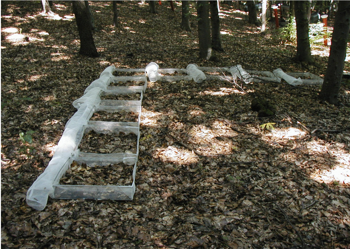
3. ábra. Keretekbe helyezett avarminták