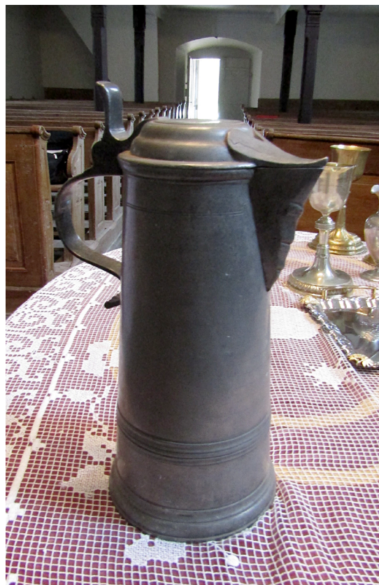
3. kép. A felsőnyéki négyiccés kanna