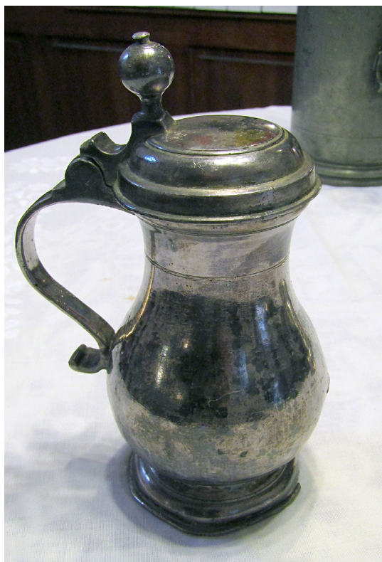
8. kép. A simontornyai ezüstözött keresztelőkancsó

Méretei: magasság: 18 cm, szájtátmérő: 6 cm, talpátmérő: 8 cm (8. kép).