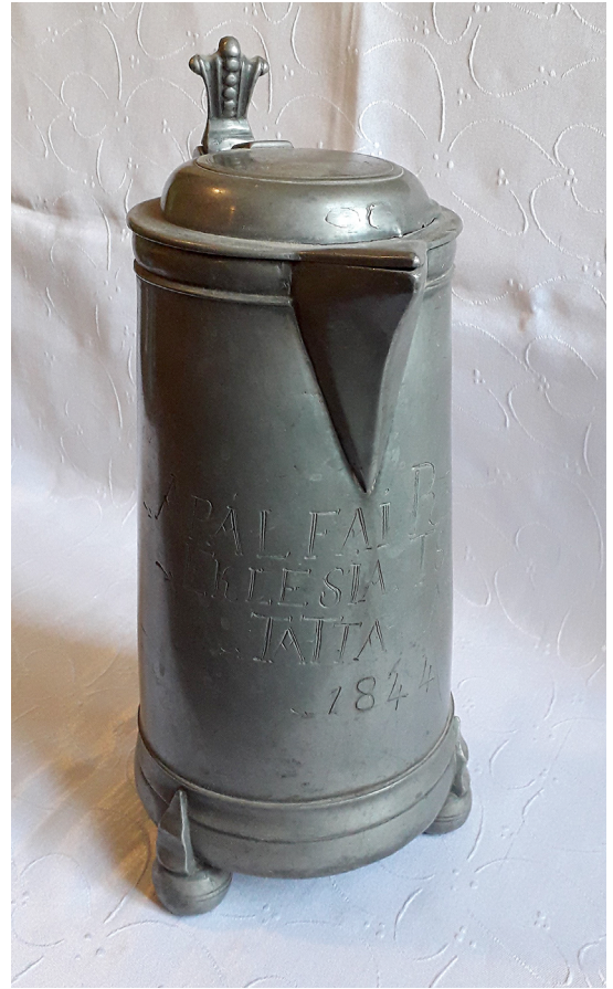
6. kép. A pálfai gyülekezet 1844-ben készült kannája

A simontornyai gyülekezet a 16. században alakult, a török összeírásokból 200–300 főre tehető a kálvinista vallást követők száma. Az 1715. évi összeírásban a településen élő 50 családból 28 református volt. 1702-ig háborítatlanul működött a közösség, amikor is a pécsi püspök elrendelte a hamis hitet terjesztő prédikátorok bebörtönzését, az egyházi működésük megtiltását. Templomukat is elvesztették a simontornyaiak. A 18. században többször is építettek paticsfalú templomot, melyek hamar romlásnak indultak. Mai templomukat 1768-ban építették. 1744-ben egy ezüstpohár és egy-egy aranyozott, illetve óntányér volt az úrasztali felszerelés. Az óntányér felirata: Simon-Tornyai-Helvetica-Eklésiáé-Anno 1748 . Az 1799-ben felvett leltárban már három fedeles ónkanna és két cserépkorsó is szerepel. 23 A három ónkanna ma is létezik, az 1748-ból való tányér már nem.