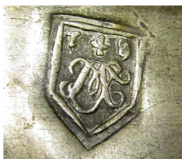
Ismeretlen bécsi mester 1749-es jegyei. Kanna, Simontornya, 18. század