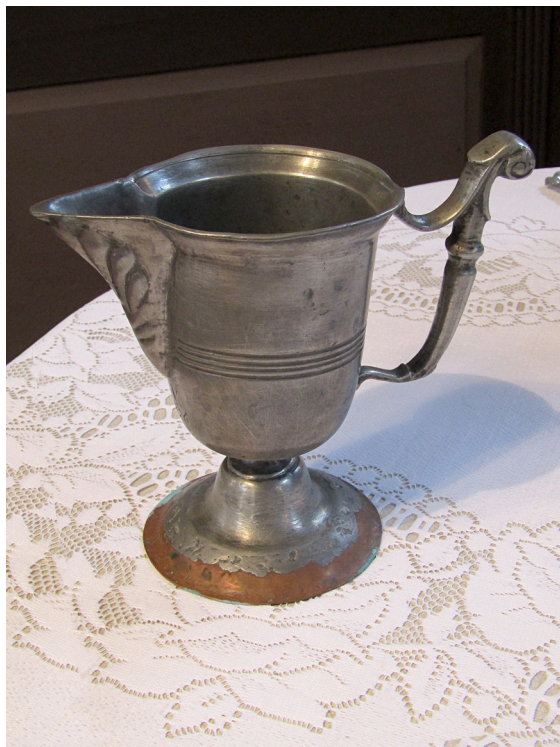
9. kép. A tolnanémedi reformátusok keresztelőkancsója

A fennmaradt 99 edény döntő többsége a 18. század folyamán készült, legtöbbször szerepel a készítés évszáma. A 18. században nincs olyan évtized, melyben ne készült volna valamilyen tárgy.