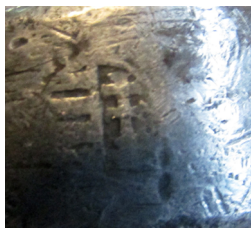
Megkopott címeres jegy, ismeretlen magyarországi mester. Keresztelőkancsó, Nagyszokoly, 18. század