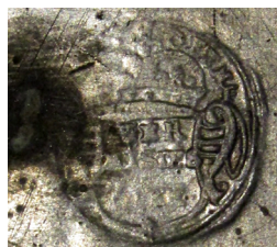
Ismeretlen mester jegye. Kanna, Nagyszokoly, 1804.