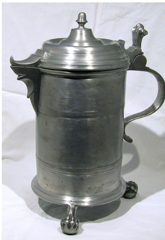
1. kép. A felsőnyéki kanna

Manapság a felsőnyéki edényekből az egyik hat icés kanna létezik, a Ráday Múzeum egyházművészeti kiállításában látható Kecskeméten. Az egyenes, hengeres kanna három stilizált, oroszlán mancsot formáló lábön áll. A kannatest talp- és szájrere me tagolt, az előbbi szélesebb, hangsúlyosabb méretű, az utóbbi enyhébb kihajlású. A palástot az alsó és felső harmadánál tagolt rátét öv díszíti és osztja három mezőre. Karéjosan megmunkált, hegyes kiöntőcsőre van, melyet közepén holdalakúra öntöttek. A kanna fedele domború, tagolt, közepén kicsúcsosodó, melyen egy makkra hasonlító fedélgomb található. A kiöntőcsőr fedele hegyesen, felfelé hajló végződésű. Füle lendületes kérdőjel alakú, mely alul gyöngyosor végződésű, felül akantuszt formázó billentőben fejeződik be. Felirat nem található rajta, az aljára F. Ny.