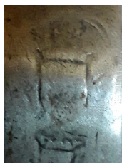
Ismeretlen jegy. Kanna, Pálfa, 1844.