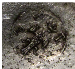
Ismeretlen székesfehérvári mester jegye. Kanna, Nagyszokoly, 1838.