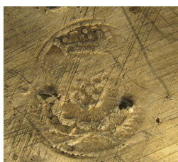
Ismeretlen mester koronás, rózsás jegye. Tál, Simontornya, 18. század