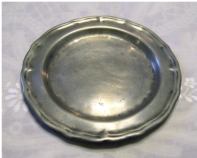
7. kép. A simontornyai kenyérosztótányér

Méretei: magasság: 2 cm, átmérő: 22 cm (7. kép).