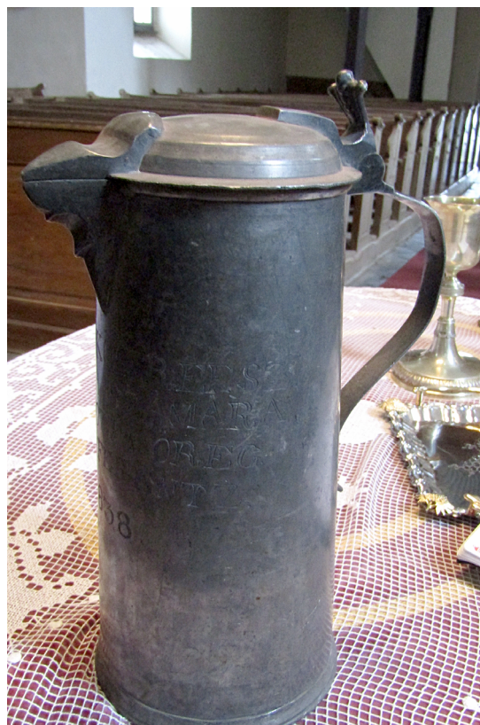
4. kép. A Szabó Ferenc adományozta kanná...