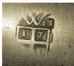
I S monogramos bécsi mester jegye a 18. század első feléből. Kanna, Felsőnyék, Simontornya