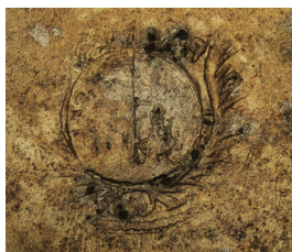
Ismeretlen mester megkopott jegye. Keresztelőkancsó, Simontornya, 18. század