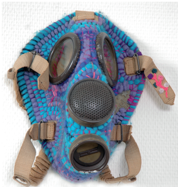
Szenes Zsuzsa: Ami korábban használati tárgy volt, most dísz (1975), Szombathelyi Képtár; a Savaria Megyei Hatókörű Városi Múzeum jóvoltából.

tó elismerését mesterségének, amely egyszerre a képzelet csodája és a test munkája. 1929-es regényében, a Laughing Boy ban Oliver La Farge egy indián nőről ír, aki a közösségtől távol nevelkedik, felnőttként kell megtanulnia szóni, s azt reméli, hogy a szövés elsajátítása „beteljesíti idilljét”. (La Farge 2004 [1929], 74) De – mint mindenki tudja, aki sző –, a tanulás folyamata hosszadalmas: fizikailag, értelmileg és érzelmileg is. „Arról ábrándozott, hogy megint beleképzelje magát, de alig idő múltán megfájdult a háta” – írja La Farge –, „alkarjai elnehezültek, tenyerében éles fájdalmat érzett, miközben a fonalak démonokként incselkedtek vele. Az állandó, monoton fonás merő tortúra volt, a festékekről pedig lényegében semmit sem tudott”. (La Farge 2004 [1929], 74-75) Magától értetődő, hogy a kárpitokban színük bujaságáért, szövetük szépségéért és a struktúrákban megjelenő meglepő részletekért gyönyörködünk. El kéne végre ismernünk, hogy az ehhez szükséges képességeket senki sem ajándékba kapja. Hogy nem virtuális hálóknak születnek, és nem kevesebb kell a megszerzésükhöz, mint valós testi munka, materiális megértés és a szövő kéz bölcsessége.