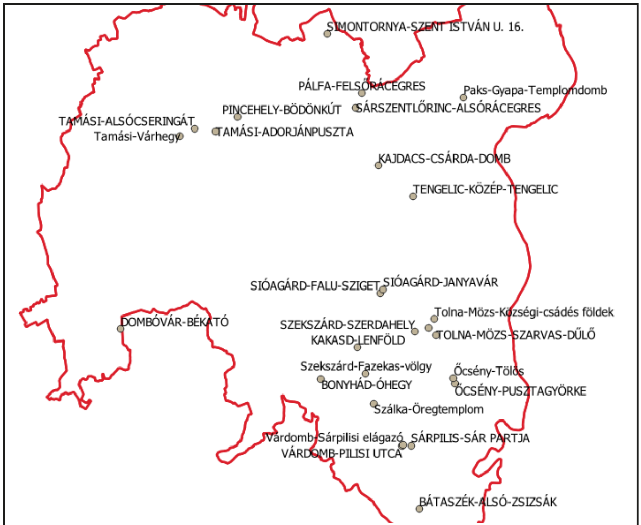
2. kép. Számolózsetonok lelőhelyei Tolna megyében (nagybetűvel a kilyukasztott zsetonok lelőhelyei)

zsetont is találtunk. 66 Anyavár csak 1545–1546-ban szerepel a török zsoldlistákban – Hegyi Klára szerint őrségét ez után felszámolták –, ekkor legalább az őrség negyede balkáni eredetű volt. 67 A régészeti leletek tanúsága alapján a vár közvetlen környékét a török kor későbbi szakaszában is lakták. Janya még a 18. század elején is Tolna megye egyik legjelentősebb rác települése volt, 68 így nem meglepetés a vár közelében, két különböző lelőhelyen (Kat. 22–23) talált két átlyukasztott számolózseton. Szerdahely falu (Kat. 26–27) közvetlenül a Szekszárd közelében fekvő, főleg balkáni katonákkal megrakott Jenipalánk vára mellett létezett (nem véletlenül nevezték a várat szerdahelyinek is). 69 A Tamási melletti Adorján (Kat. 29) rác lakóit több 17. századi adatból is ismerjük, 70 telepüket nemrég sikerült régészetileg is azonosítani; itt két, ki nem lyukasztott zseton is előkerült. A Tamási határában fekvő Henye falut (Kat. 31) 1639 és 1675 között több összeírás szerint is rácok lakták. 71 Tengelicet (Kat. 33) egy 1620-as években keletkezett feljegyzés addig a tolnaiak éltek, ekkor „a rácok megszállották”. 72 Az említett jenipalánki vártól légvonalban 2,5 km-re feküdt a Tolna-