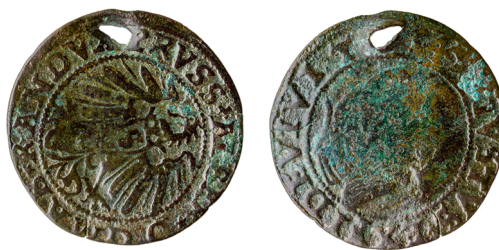
1. kép. Átlukasztott porosz garas Sárszentlőrinc-Alsórácegresről

Mindegyik érmét a köriratnál lyukasztották át valamilyen hegyes tárggyal (talán szöggel?), általában 3 mm hosszán, háromszög alakban (két kisebb zseton lyuka ugyanakkor csaknem téglalap alakú, ezek átlukasztásához talán valamilyen más tárgyat használtak). A három kisebb zsetont és a porosz garast a hátlap felől lyukasztották át, tehát ezek felerősítés után feltehetőleg egy irányba néztek.