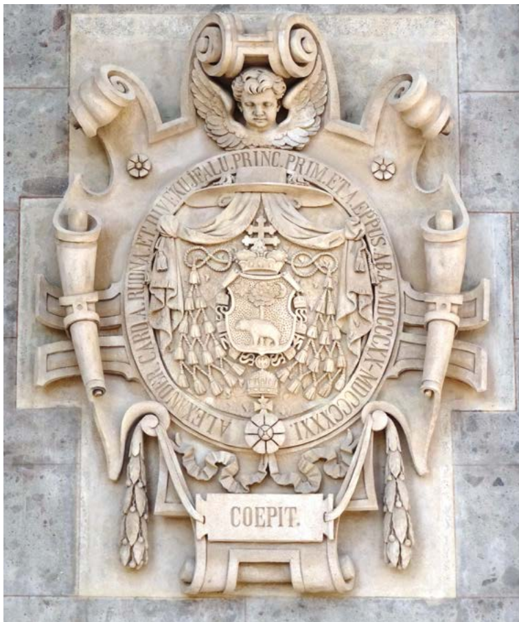
1. ESZTERGOM, JOHANN HUTTERER: RUDNAY SÁNDOR BÍBOROS ÉRSEK CÍMERE A BAZILIKA FŐBEJÁRATÁNÁL.

zését adják az új székesegyház emelésében játszott szerepüknek. (1–4. kép.) Balról jobbra: Rudnay Sándor (1820–1831) a templom építését elkezdte (COEPIT), Kopácsy József (1838–1847) folytatta (CONTINUAVIT), Scitovszky János (1849–1866) felszentelte (CONSECRAVIT), végül Simor János (1867–1891) befejezte (CONSUMMAVIT). 2 Az építésmenetet heraldikai elemekkel dokumentáló, nem mindennapi alkotás lehetséges előképe talán ma-