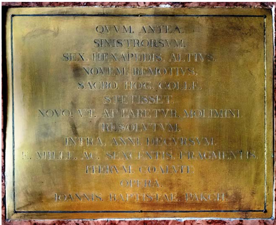
5. ESZTERGOM, A BAKÓCZ-KÁPOLNA ÉPÍTÉSI FELIRATA PACKH JÁNOS NEVÉVEL. A SZERZŐ FELVÉTELE, 2021

A bal oldalon: I. Ferencz Jozsef / ő Felsege országlása / Tisza Kálmán / minister elnök és / Péchy Tamás / közl. és közmunka minister idejében / a cs. kir. szab. Osztrák - Állam - / Vasuttársaság