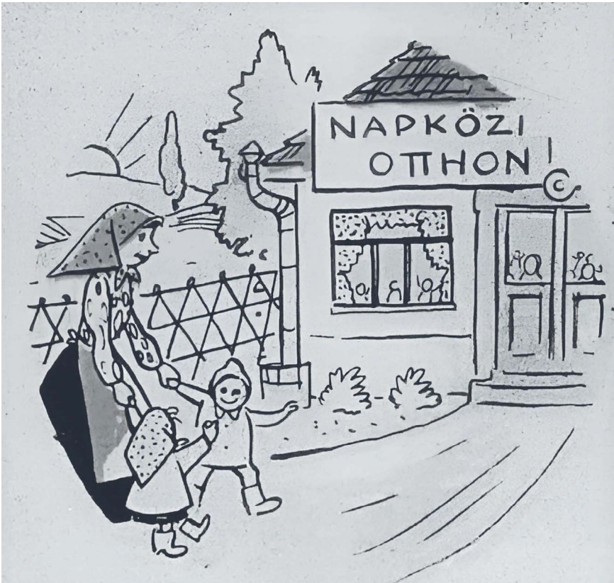
4. kép. „Ma csoporttag, s míg dolgozik, nincs gondja a gyerekre, Napköziben rá van bízva hozzáértő kezekre.” 57

Az egykori propaganda kedvelt eszköze volt a jelen szembeállítása a múlttal, amikor a korábbi rendszer hibáinak felnagyítása felerősítette a fennálló rendszer eredményeit, a szocializmus felsőbbrendűségét.