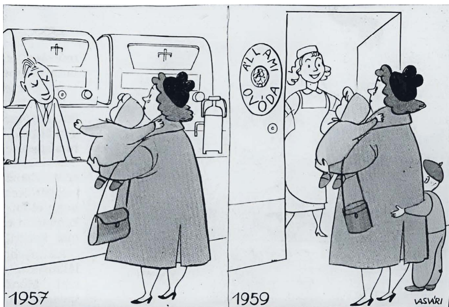
3. kép. „Mosógép nincs, de bővül az óvodák és a — Hely nincs, de már van mosógép! ... napközi otthonok hálózata ...”