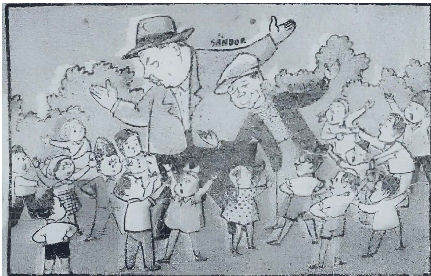
2. kép. „GYEREKEK: Igazgató bácsi, ugye mire beiratkozunk az egyetemre, elkészül a napközi otthonunk?”

IGAZGATÓ: Ha a „Gazdép”-re [a Középmagyarországi gazdasági építkezési vállalatra] várunk, csak akkorra. De mi már most hozzáfogunk és három hét múlva kész lesz.”