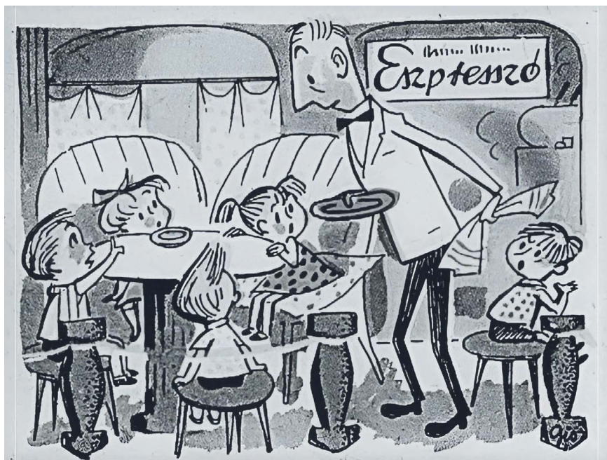
9. kép. „– Nyári szünet van az óvodákban, pincér bácsi...

Kérünk négy turmixot és egy doboz építőkockát!”