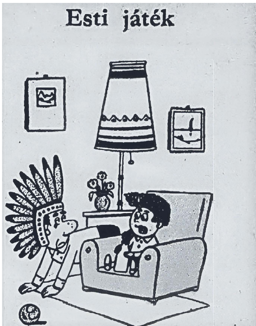
6. kép. „– Nem, papa, ma este ne! Nagyon fárasztó napom volt ma az óvodában...”

A felnőtt minta fricskájáról karikatúra is született (6. kép).