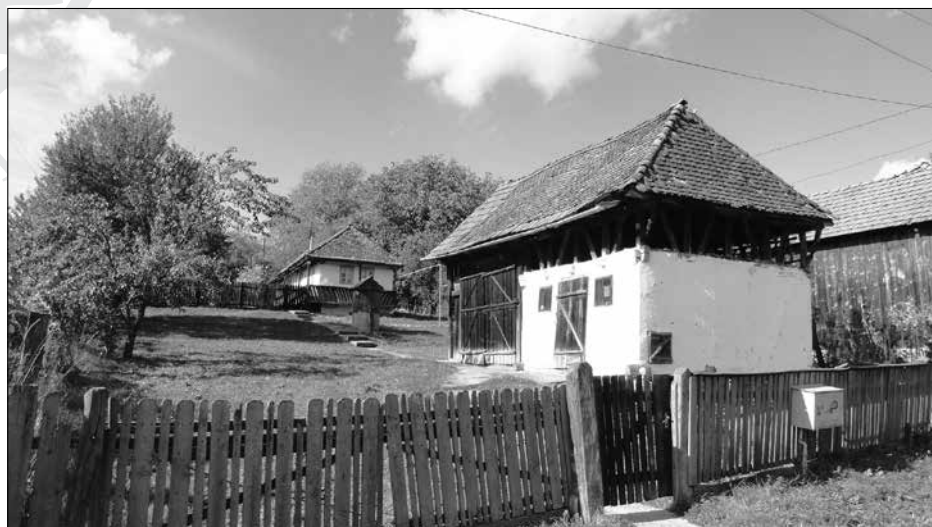
10. Gazdasági udvar háttérben a lakóházzal