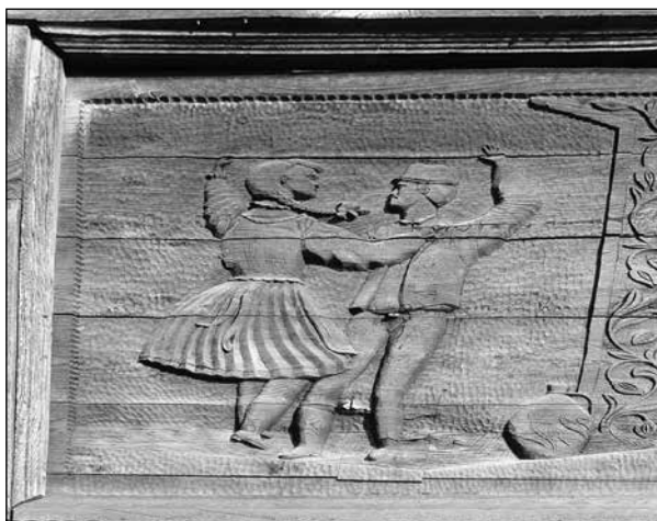
16. Táncoló párt ábrázoló kapufaragvány