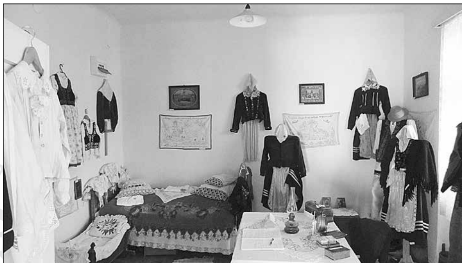
5. A falumúzeumban látható néprajzi gyűjtemény