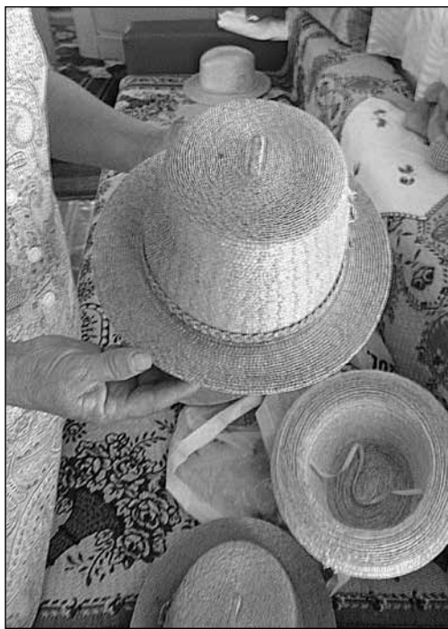
15. Jobbágytelki szalmakalap