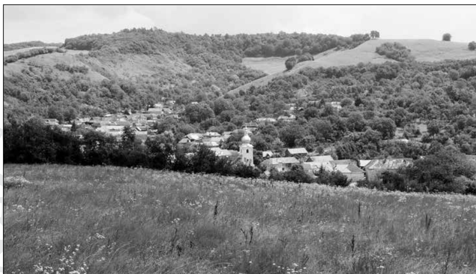
1. A falu látképe (2010)