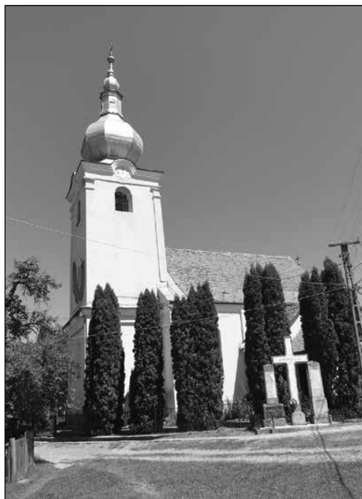
2. A római katolikus templom és az emlékművek