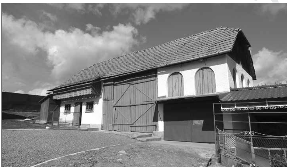
12. Gazdasági épület