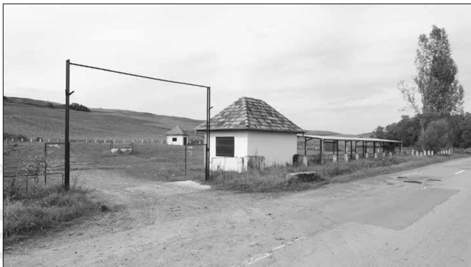
17. A székelyhodosi vásártér