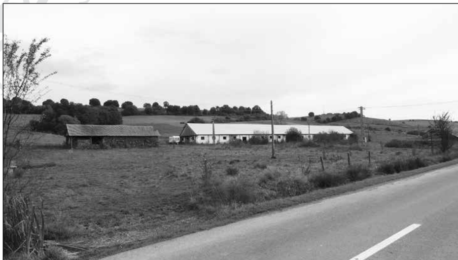
18. A székelyhodosi kollektív gazdaság megmaradt épületei