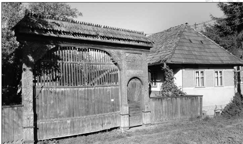
4. Balla Antal portája