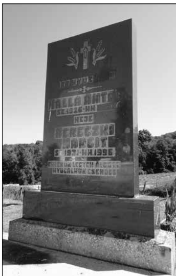
3. Balla Antal tanácsstikár síremléke