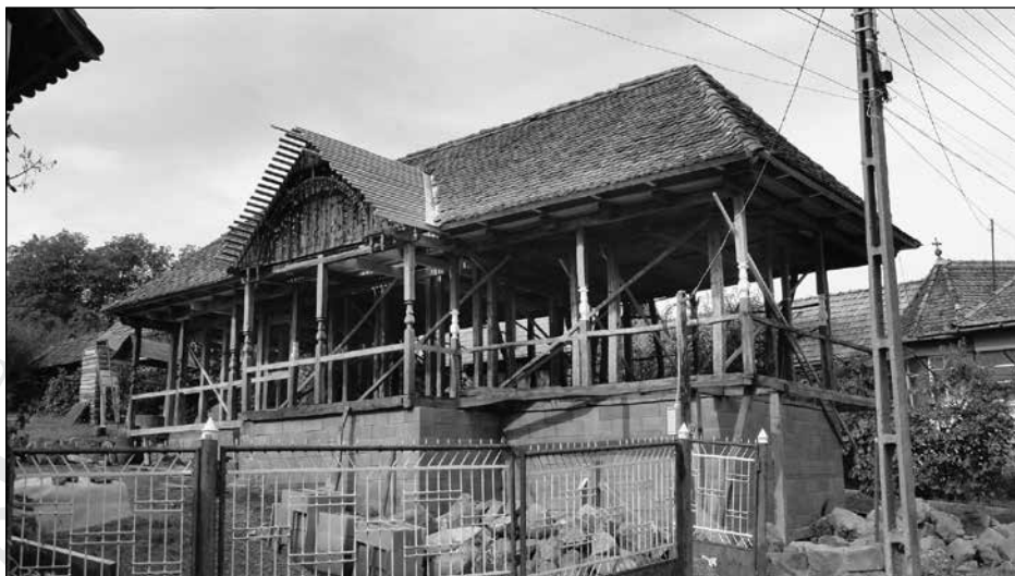
9. Hagymányos lakóház felújítás alatt