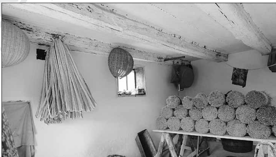
14. Szalma alapanyagok