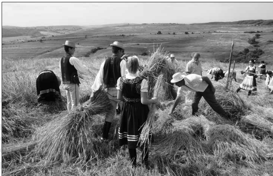
13. Aratókalács (Balla Lóránt felvétele, 2010)