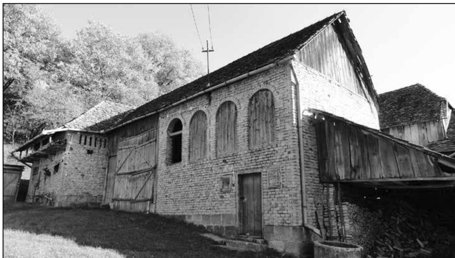
11. Gazdasági épület