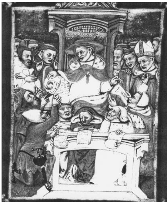
4. Bíraskodó bíboros. Balján kérelmet benyújtó katona az ügyvédjével, jobbán egy ügyvéd ügyfele képviselőjében, alul írnokok.

kérelmekből megfigyelhetjük, hogy milyen módszereket alkalmaztak az erőszakos konfliktusok reprezentációja során. A korabeli mindennapokban elfogadottnak vélt normák megismerésére – paradox módon – éppen a normasértések elbeszélései adnak módot. Azok az intézmények – jelen esetben a Penitenciária –, amelyek részt vettek a reprezentációban, nem csupán közölnek valamit a múlttól, hanem újra is teremtik azt. Ahogy a fegyelmezés folyamata megteremti magát a bűnt, az ebben részt vevő hivatal felügyeli és újraalkotja a társadalmi normákat és a mindennapi gyakorlatok megítélését. A pápai kegyelem tömeges igénylése és használata, az egyház és a hívek intenzív kapcsolata teremt meg lényegében a morált: a kérvények elemzésével megfigyelhetjük ennek létrejöttét és működését a mindennapokban.