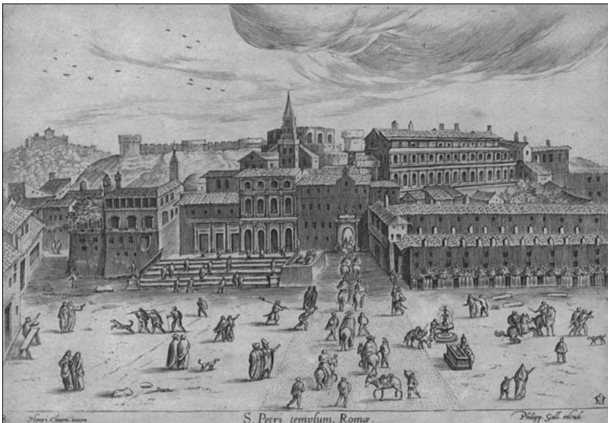
1. A Szent Péter-bazilika a 15. században

kiírták ezek nevét, ami a mai kutatót is segíti a keresésben. Több okból is nagyon különlegesek ezek a szövegek. Egyrészt érdekes, hogyan formáltak az emberek történeteket az általuk elkövetett vétségekről annak érdekében, hogy feloldozást nyerjenek vétükük lelki és jogi következményei alól. A történetmesélés közben pedig bepillantást nyerhetünk mindennapi életükbe: otthonaikba, ahogy például télen a kemence tetején alszanak együtt felnőttek és gyerekek; az utcán zajló nappali és éjszakai életbe éppúgy, mint a templomok, temetők, iskolák és kocsmák félnyilvános tereinek összejöveteleibe. A tekintetben is nagyon különbözik ez a forrástípus a korból nagyobb mennyiségben megmaradt, nagyrészt vagyoni és birtokügyekkel foglalkozó és jogbiztosítás céljából készült korabeli dokumentumoktól, hogy a jelentős vagyonnal és hatalommal nem rendelkező – ezért kevés írásos nyomot maga után hagyó – alsó társadalmi rétegek életét ismerhetjük meg belőle. Bár az egyszerű emberek hétköznapi életük sokféle problémájával keresték fel a Penitenciária hivatalát, itt elsősorban azokkal foglalkozom, akik valamilyen formában – egyénileg vagy egy csoport tagjaként – erőszakot követtek el. 15