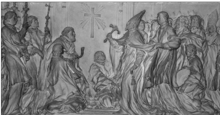
3. A pápa megnyitja a szentévet