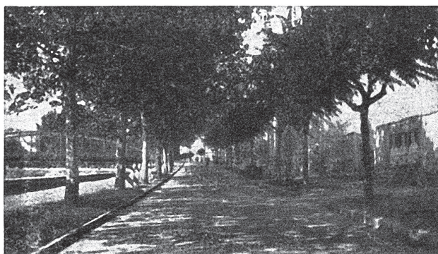
Esztergom. Sétaút a kis-Dunaparton.

Képek az üdülőről