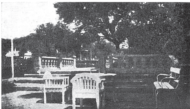
Esztergom. Pihenő a tiszti üdülő parkjában.