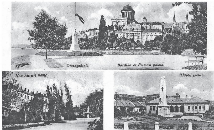
Esztergomi képeslap a Honvédüdülő épületével (Magyar Kereskedelmi és Vendéglátóipari Múzeum)