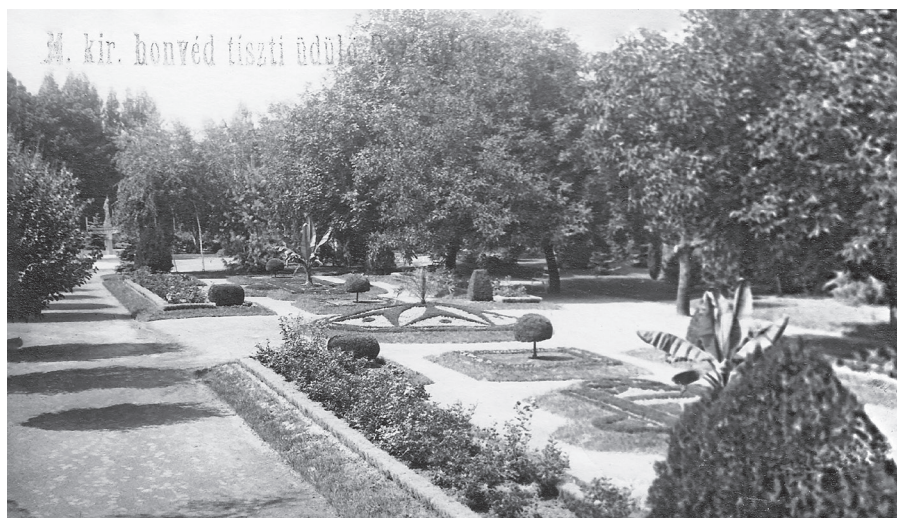
A Honvédüdülő parkja képeslapon