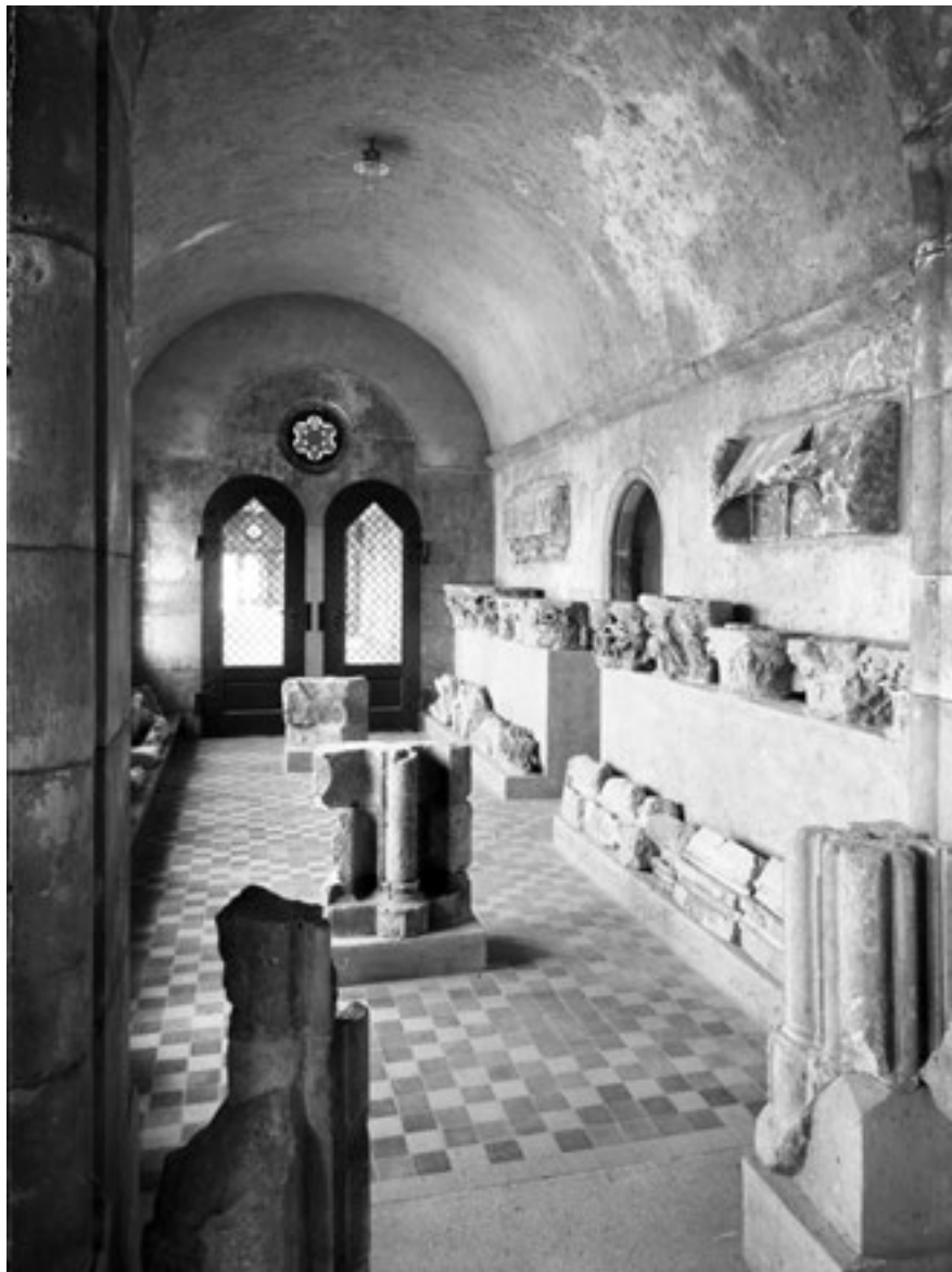
4. Részlet a Középkori Kőemléktárból, 1938.