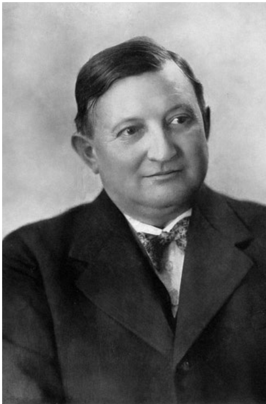
1. Horváth Henrik 1935-ben. Képes Pesti Hírlap , 1935. július 23. 2.