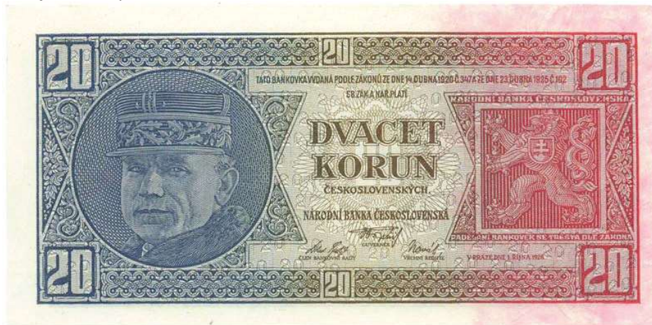
Obrázok č. 6. Československý (v skutočnosti český) text na lícnej strane 20-korunovej bankovky vzoru 1927.

Na rubovej strane sa popri/pod štátnym jazykom uvádzala hodnota bankovky aj v rusínskom/ukrajinskom, nemeckom a maďarskom jazyku; poľský jazyk však (ako sme vyššie spomenuli) zmizol. Uvádzanie textu na bankovkách v menšinových jazykoch umožnil 2. odsek 13. článku nariadenia z r. 1926: „Hodnota papírových platidel bude na rubu vyznačena podle potreby též jazyky, jimiž mluví menšiny republiky Československé.“ 12