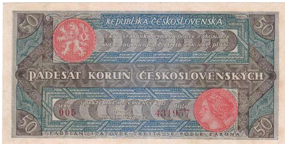
Tabuľka č. 2. Jazyky na štátovkách II. emisie československej koruny (Štátovky II. emise, 1920 – 1923). 6