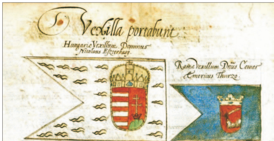
Magyarország és Bosznia zászlaja II. Ferdinánd koronázási rendtartásában

A legkorábbi biztos adat Magyarországon használt koronázási zászlóról 1490 szeptemberének közepéről származik. Ekkor Jagelló II. Ulászló király (1490–1516) székesfehérvári szertartásán még csupán egyetlen zászlót, a Magyar Királyság lobogóját vitték. Fia, a mohácsi csatamezőn elhunyt II. Lajos (1516–1526) 1508. évi koronázásán ugyanakkor már hét zászló szerepelt. Ezek a Jagelló-uralkodók vezette magyar-cseh középhatalom országait szimbolizálhatták.