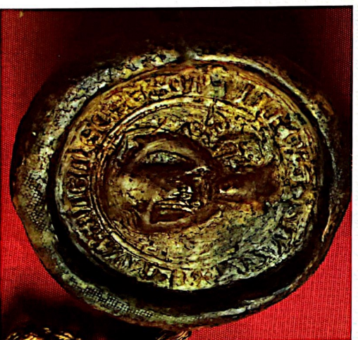
A váradi székeskáptalan 1291 és 1557 között használt nagypecsétfé