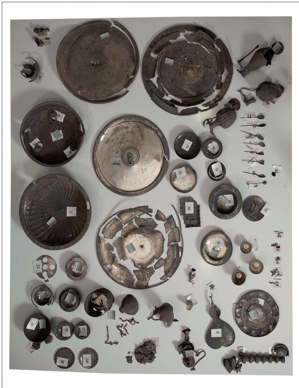
1. kép: Vinkovci-Duga ulica (Horvátország), 4. sz. végi kincs